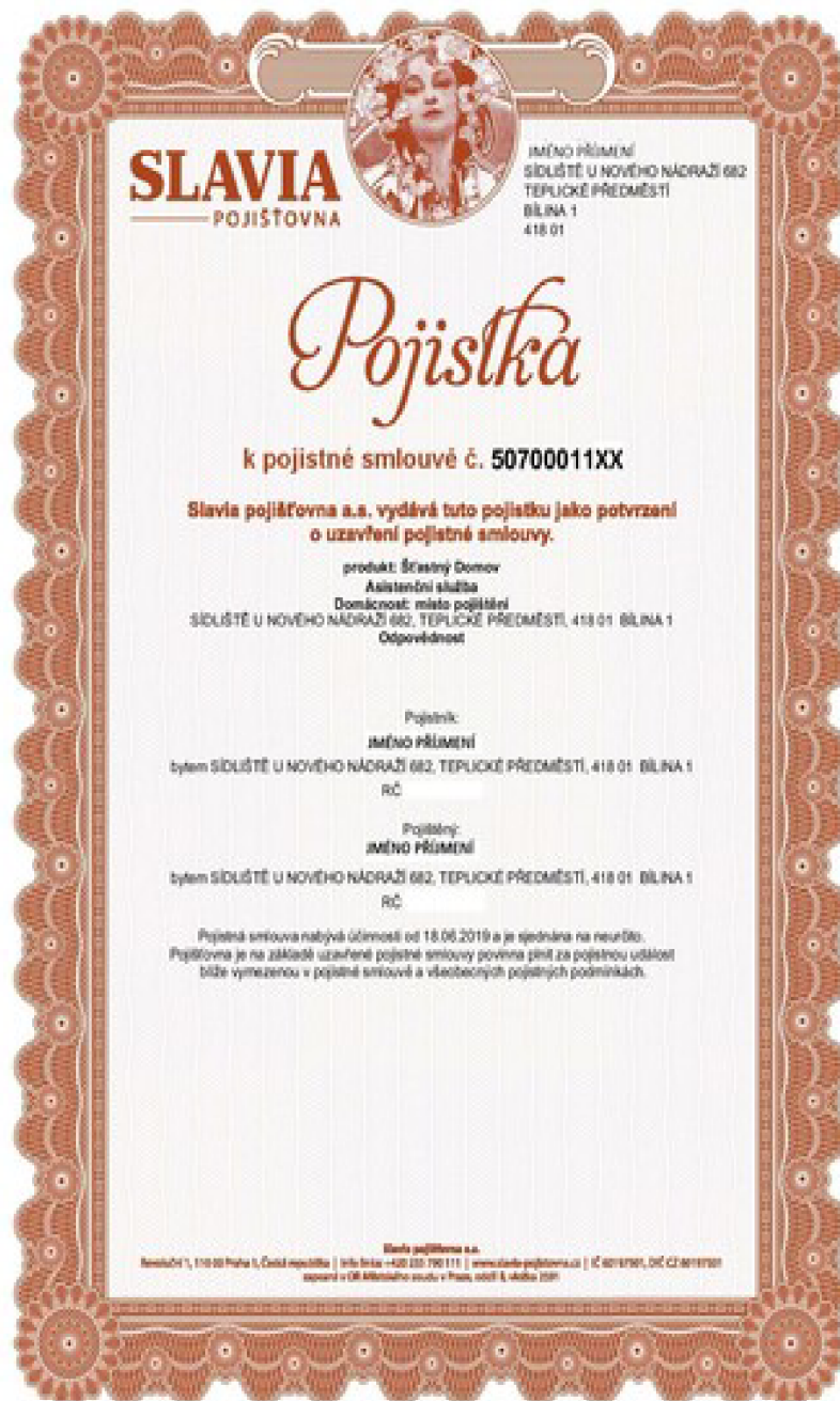
Obr. 4.1 Pojistný certifikát