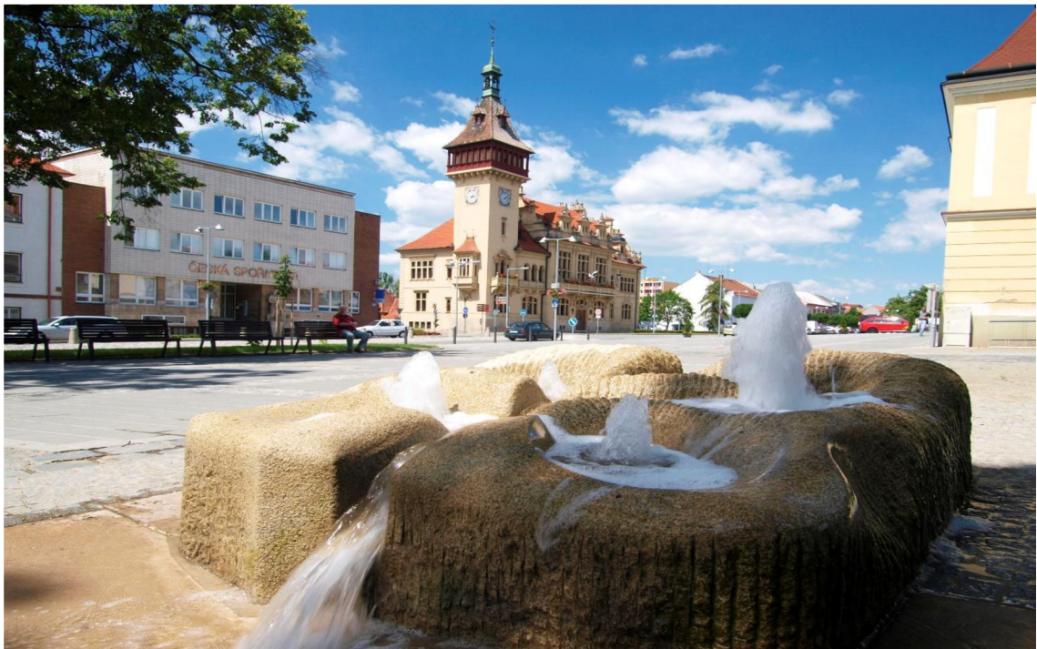
Obrázek 1: Náměstí v Napajedlech

Město Napajedla se nachází na rozhraní tří regionů Valašska, Slovácka a Hané. Žije zde kolem 7500 obyvatel. Leží 13 km jihozápadně od Zlína. Městem protéká řeka Morava, kolem které vede i cyklostezka. Nachází se zde barokní kostel sv. Bartoloměje a budova bývalého kláštera. V minulosti se Napajedla proslavila založením hřebčína, o které se postaral hrabě Aristides Baltazzi. Angličtí plnokrevníci se v Napajedlech chovají více než 130 let. Každý rok se zde pořádají tradiční Svatováclavské slavnosti, kdy městem prochází královský průvod (22).