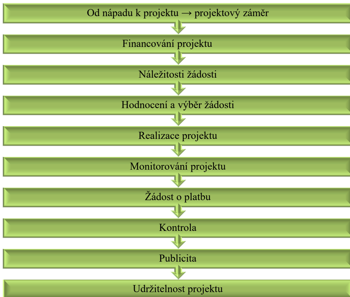
Obr. 2 Schéma postupu žádosti o dotaci

Získání financí z rozpočtu Evropské unie není jednoduché a je nutné dodržovat konkrétní kroky a postupy, které jsou vyobrazeny ve schématu na obrázku 2.