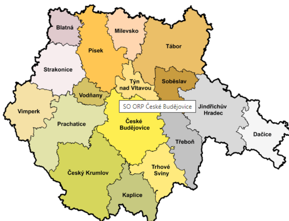
Obr. 4 – Mapa správních obvodů Jihočeského kraje

Jihočeský kraj je druhým největším krajem v České republice, dle dostupných statistických údajů se ale se svými 644 tisíci obyvateli zároveň řadí mezi kraje s nejmenší hustotou osídlení, nejvíce obyvatel žije v Českých Budějovicích. V Jihočeském kraji se nachází na 7 000 rybníků a příroda tohoto kraje je vnímána jako jedna z nejčistších u nás, více než 1/3 území tvoří lesy. Většina obyvatelstva je soustředěna ve městech (70%), venkovské oblasti jsou osídleny řidčeji. Dle zákona č. 347/1997 Sb., o vytvoření vyšších územních samosprávných celků, bylo v České republice zřízeno 14 vyšších územních samosprávných celků, včetně Jihočeského kraje, který je vymezen 7 okresy. V Jihočeském kraji je ustanoveno 17 správních obvodů obcí s rozšířenou působností (ORP) – viz obr. 4, a 37 správních obvodů s pověřenými obecními úřady. 4