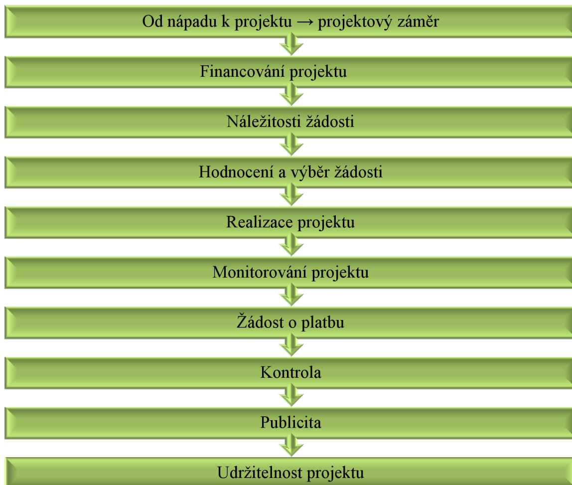
Obr. 2 Schéma postupu žádosti o dotaci

Získání financí z rozpočtu Evropské unie není jednoduché a je nutné dodržovat konkrétní kroky a postupy, které jsou vyobrazeny ve schématu na obrázku 2.