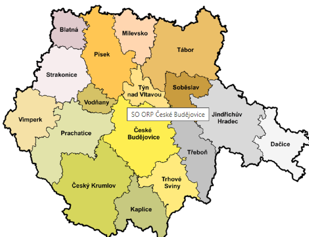
Obr. 4 – Mapa správních obvodů Jihočeského kraje

Jihočeský kraj je druhým největším krajem v České republice, dle dostupných statistických údajů se ale se svými 644 tisíci obyvateli zároveň řadí mezi kraje s nejmenší hustotou osídlení, nejvíce obyvatel žije v Českých Budějovicích. V Jihočeském kraji se nachází na 7 000 rybníků a příroda tohoto kraje je vnímána jako jedna z nejčistších u nás, více než 1/3 území tvoří lesy. Většina obyvatelstva je soustředěna ve městech (70%), venkovské oblasti jsou osídleny řidčeji. Dle zákona č. 347/1997 Sb., o vytvoření vyšších územních samosprávných celků, bylo v České republice zřízeno 14 vyšších územních samosprávných celků, včetně Jihočeského kraje, který je vymezen 7 okresy. V Jihočeském kraji je ustanoveno 17 správních obvodů obcí s rozšířenou působností (ORP) – viz obr. 4, a 37 správních obvodů s pověřenými obecními úřady. 4