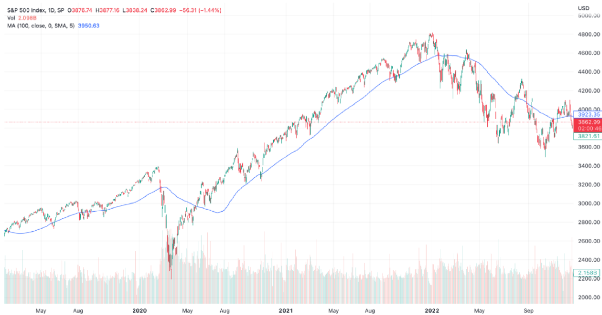
Graf č. 2: Vývoj ceny akciového indexu S&P500

Zdroj: https://www.tradingview.com ; S&P500, 2023