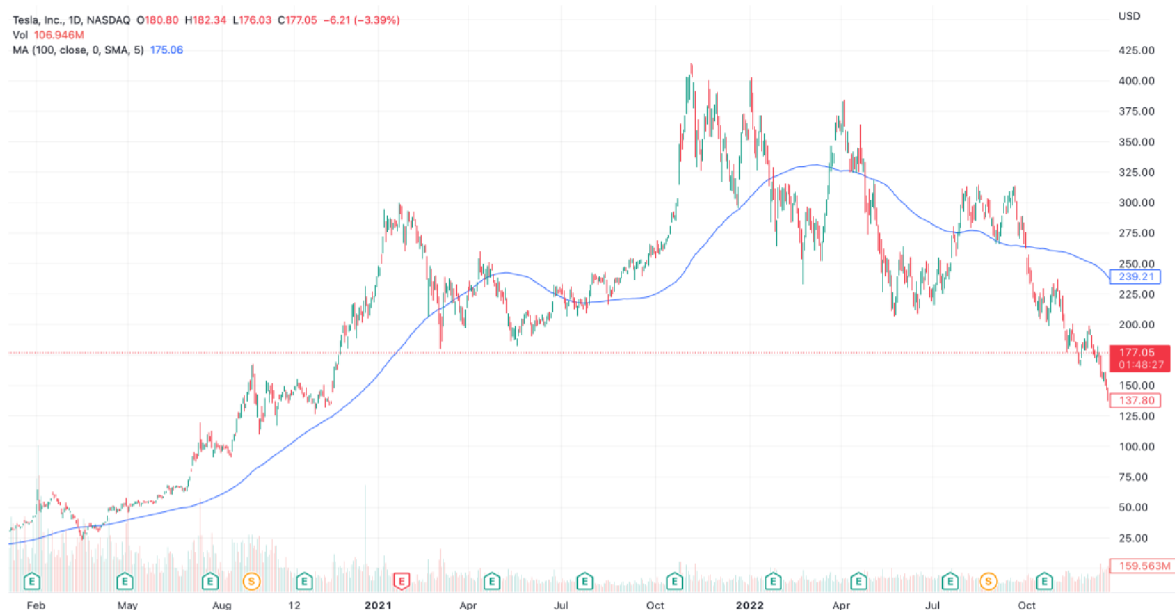
Graf č. 5: Vývoj ceny akcie Tesla