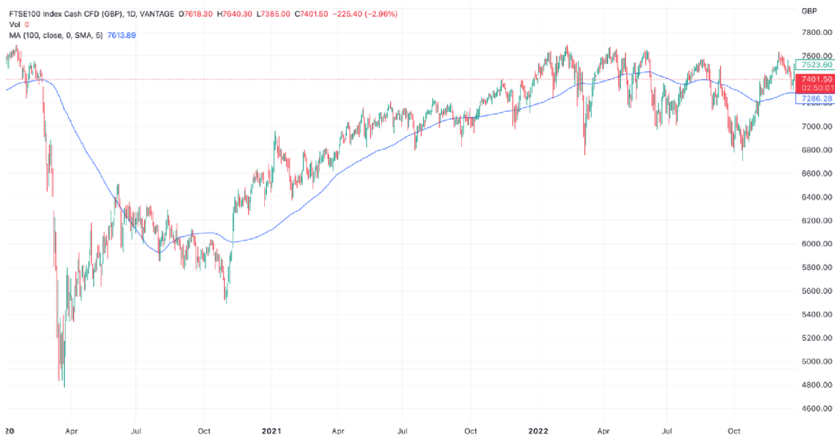
Graf č. 3: Vývoj ceny akciového indexu FTSE100