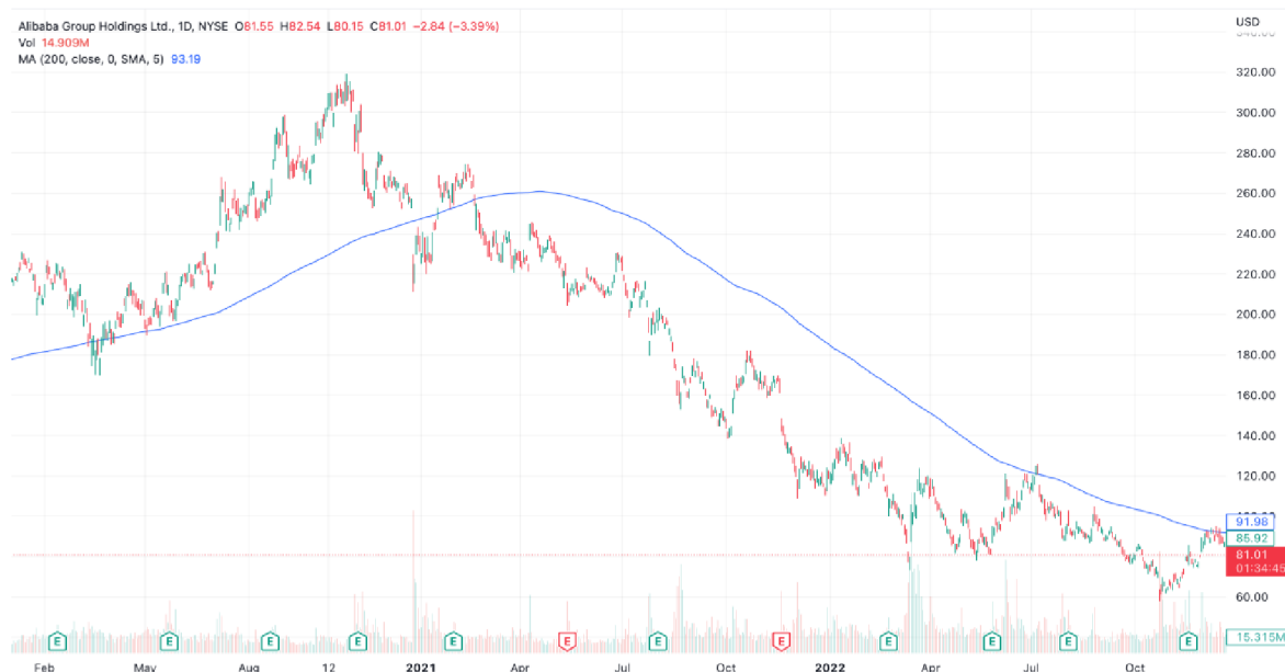
Graf č. 7: Vývoj ceny akcie Alibaba