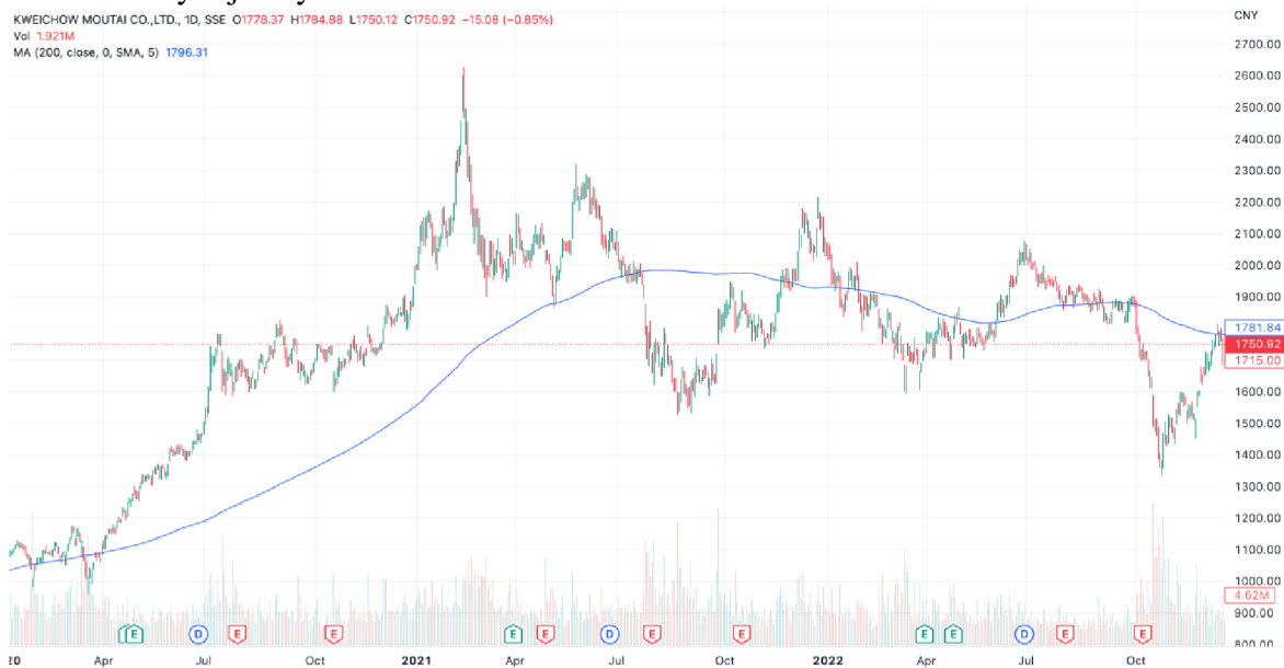
Graf č. 8: Vývoj ceny akcie Kweichow Moutai