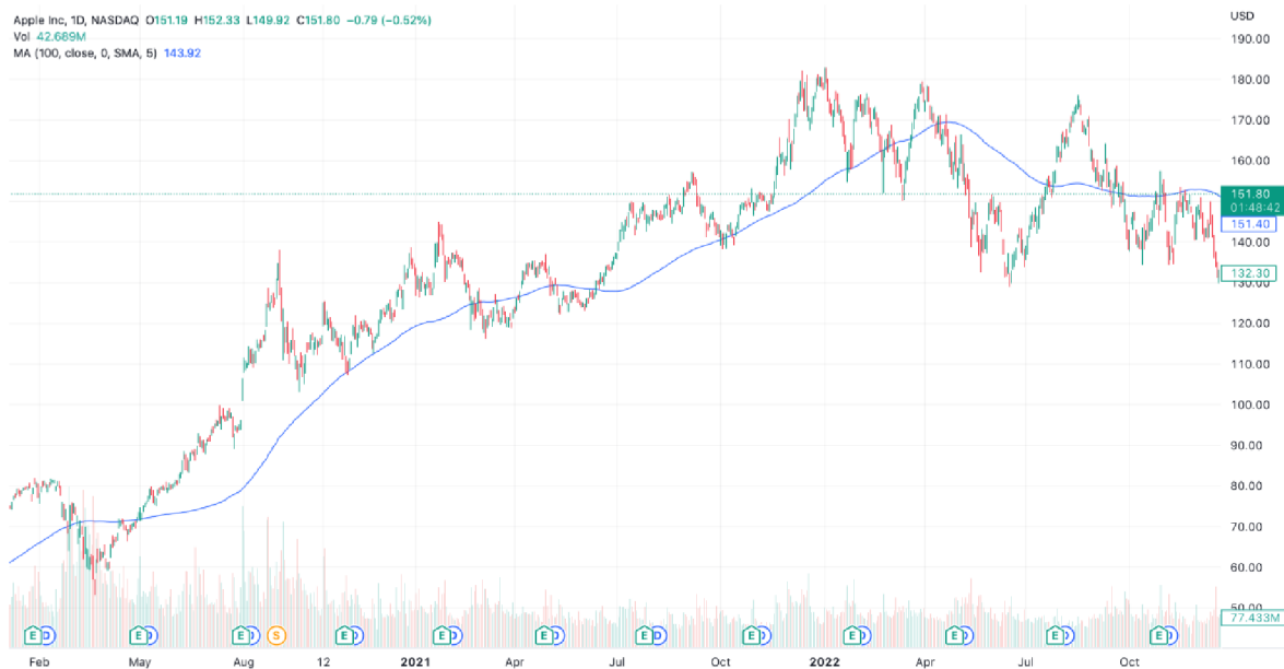
Graf č. 6: Vývoj ceny akcie Apple