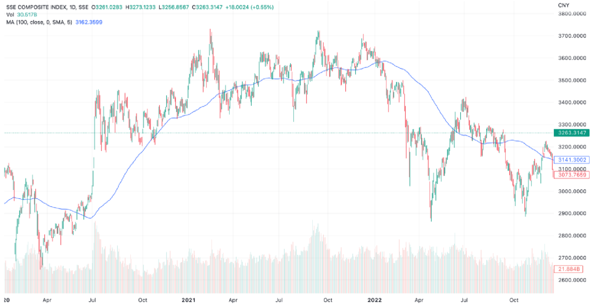
Graf č. 4: Vývoj ceny akciového indexu SSE Composite