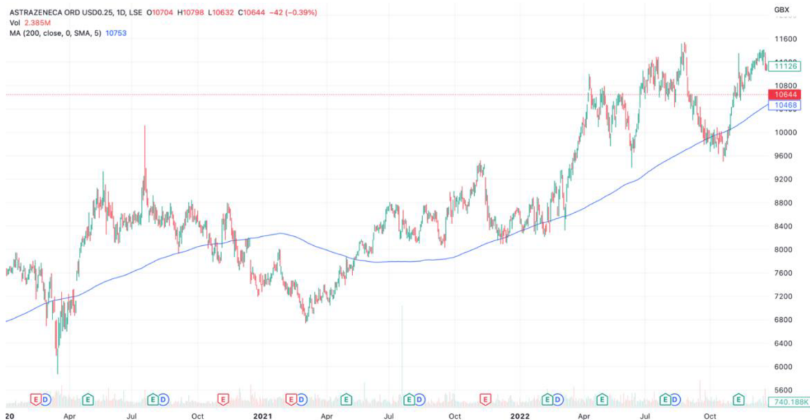
Graf č. 9: Vývoj ceny akcie AstraZeneca