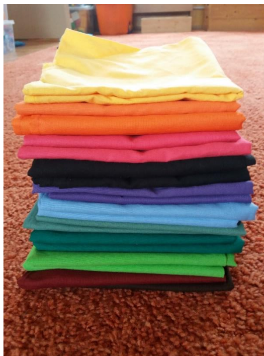
Barevné čtvercové šátky