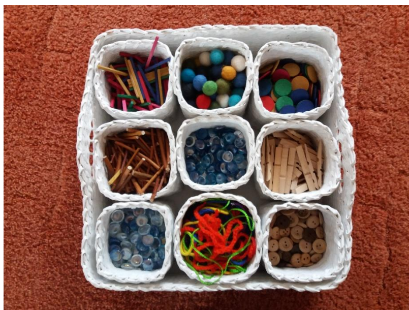
Košičky s drobným materiálom