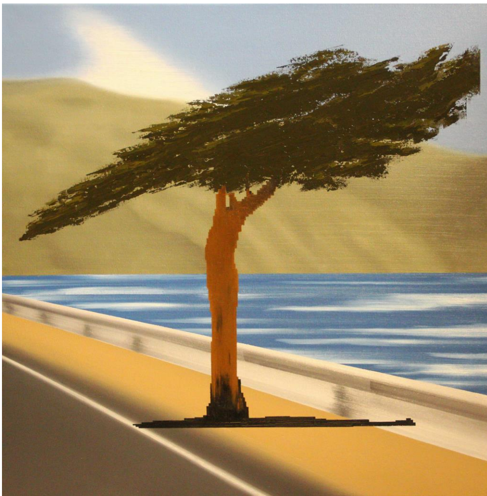
Stromek u cesty, olej, plátno, 80 x 80 cm, 2023