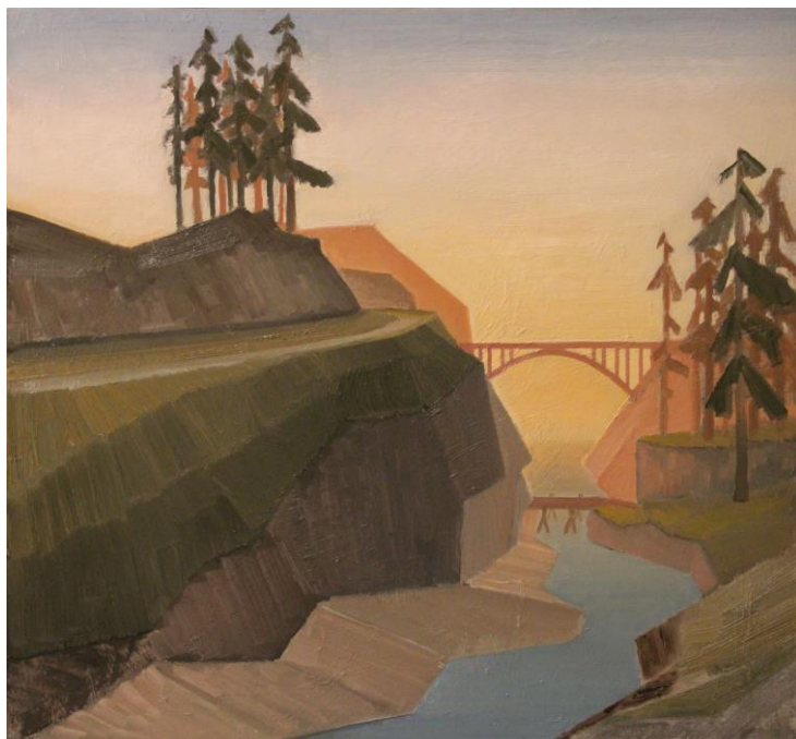
Motiv z GTA:SA č.2, olej, mdf deska, 41 x 44 cm, 2020