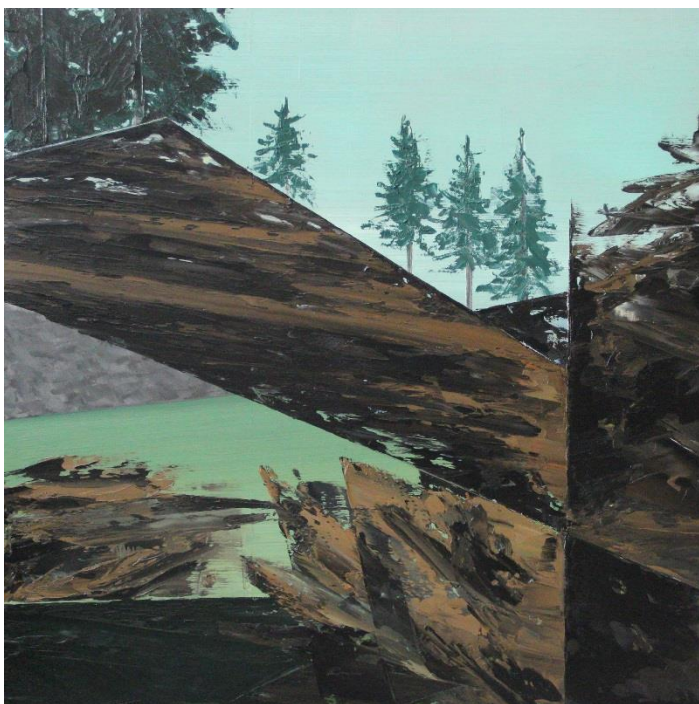
Motiv z GTA:SA – Textury křovin č.2, olej, mdf deska, 60 x 60 cm, 2021