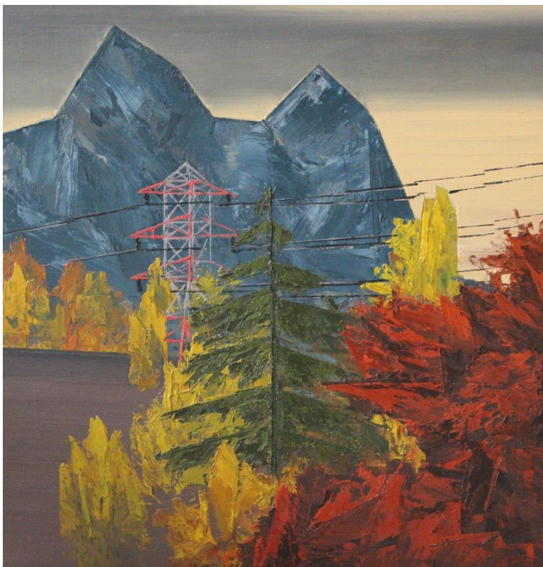
Motiv z NFS:HP2 č.2, olej, mdf deska, 36 x 38 cm, 2022