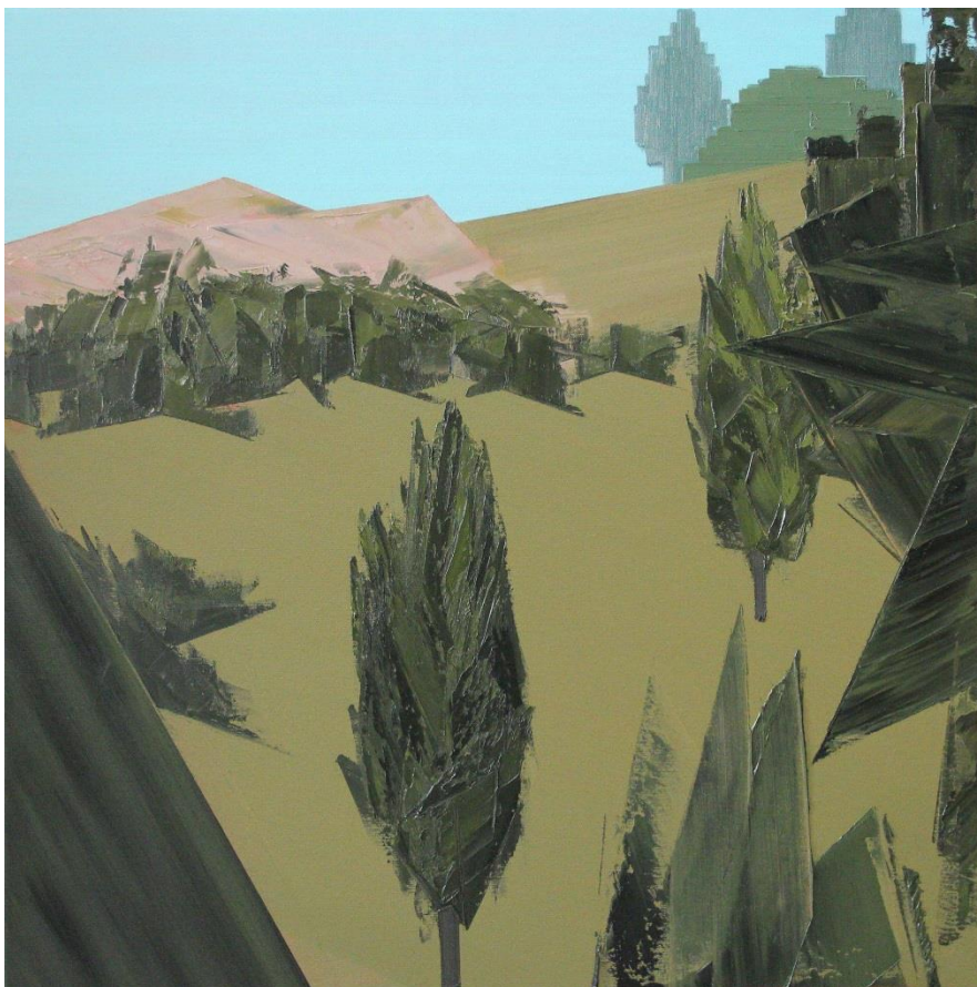
Motiv z GTA:SA č.13, olej, plátno, 70 x 70 cm, 2022