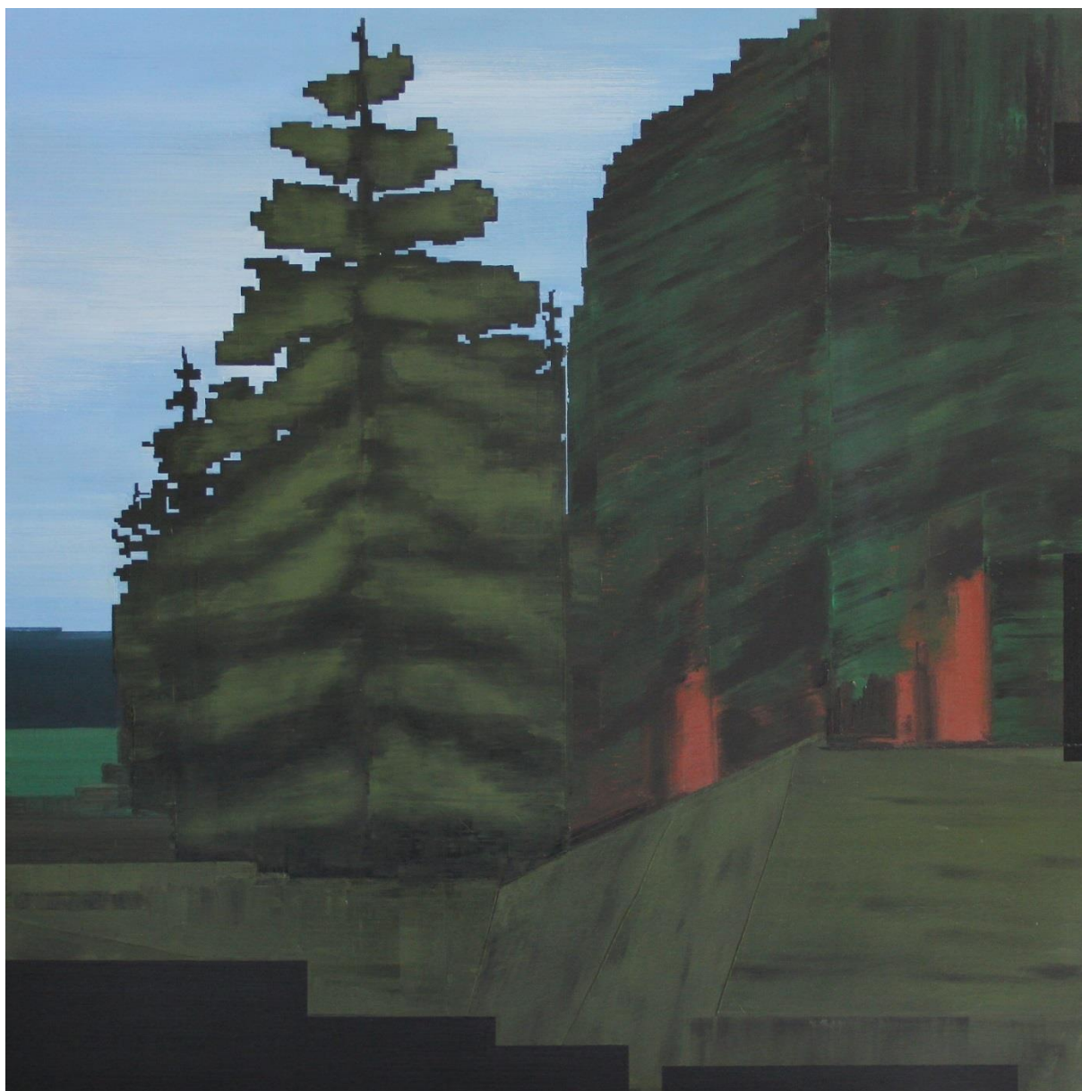
Okraj lesa (motiv z NFS II), olej, plátno, 70 x 70 cm, 2022