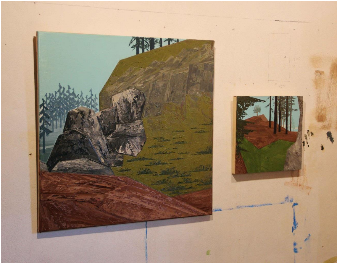
Motivy z GTA:SA č.12 a č.11, 2021