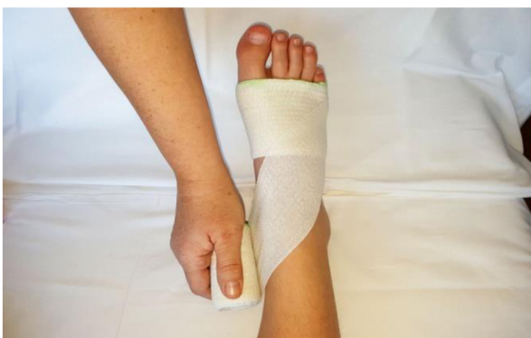
Obr. 3: Technika bandáže dolní končetiny krátkotažným obinadlem – vedení osmičkových otoček přes kotník.