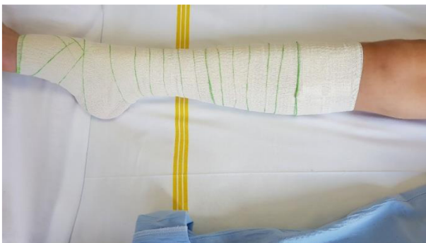
Obr. 5: Technika bandáže dolní končetiny krátkotažným obinadlem – nízká bandáž – hoblinový obvaz.