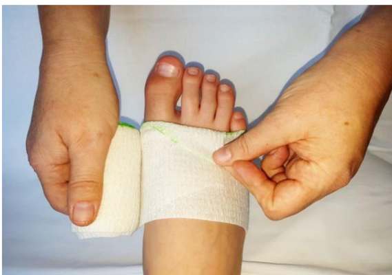
Obr. 2: Technika bandáže dolní končetiny krátkotažným obinadlem – základní otočka, tzv. zámeček.