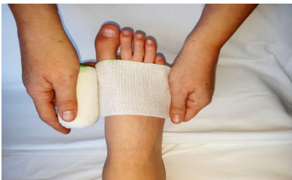
Obr. 1: Technika bandáže dolní končetiny krátkotažným obinadlem.