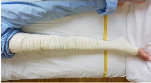
Obr. 4: Technika bandáže dolní končetiny krátkotažným obinadlem – vysoká bandáž – hoblinový obvaz.