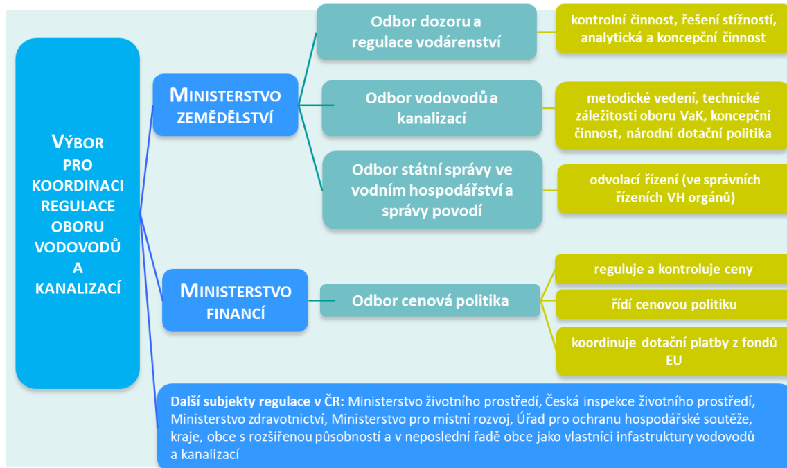
Obrázek 1: Struktura orgánů pro regulaci vodárenství v ČR

Z obrázku také můžeme vypočítat změny ve vzniku dalších nových orgánů a převedení kompetencí. Konkrétně hovoříme o Výboru pro koordinaci regulace oboru vodovodů a kanalizací, který reprezentuje pozici národního regulátora oboru vodovodů a kanalizací pro veřejnou potřebu.