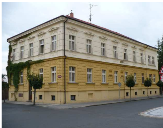
Obr. č. 1: Budova dětského domova v Nymburce

Dětský domov v Nymburce se nachází v okrese Nymburk ve Středočeském kraji. Okres Nymburk leží v Polabské nížině. Polabská nížina je úrodná oblast v okolí řeky Labe, která nabízí množství volnočasových aktivit, vzhledem ke svému příznivému rovinatému terénu a k velmi dobré poloze. Město Nymburk je vzdálené od hlavního města Prahy cca 40 km. Do Nymburka je možnost výborného vlakového i autobusového spojení. Z Prahy trvá cesta vlakem 30 minut. Dětský domov se nachází nedaleko vlakového nádraží cca 5 minut chůze, což je velmi dobré i pro rodiče, které navštěvují děti, které jsou u nás umístěné a nemají možnost vlastní dopravy.