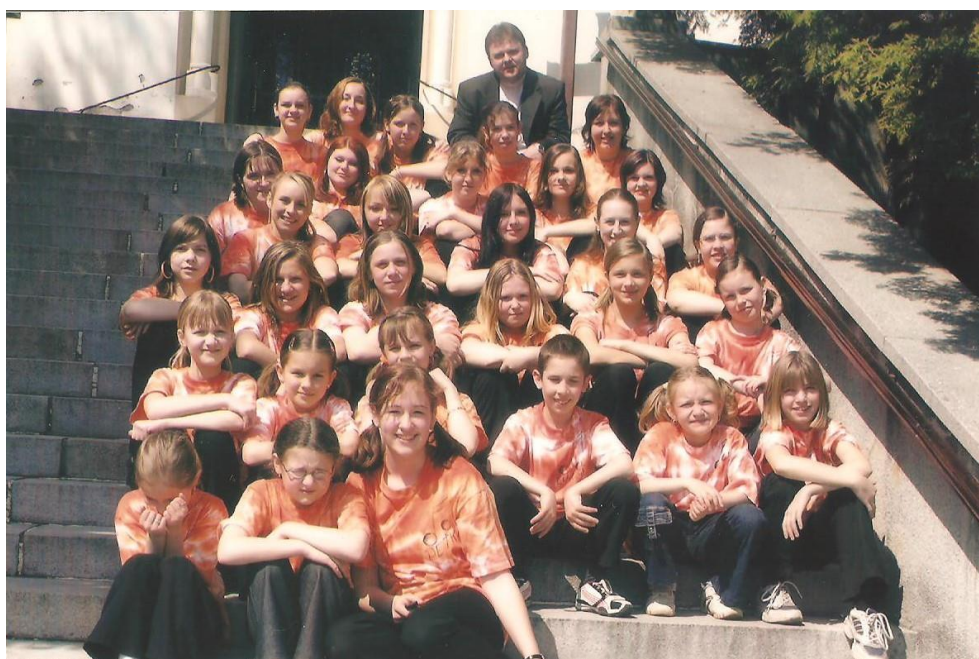
Příloha č. 8: fotografie z roku 2005, 2013