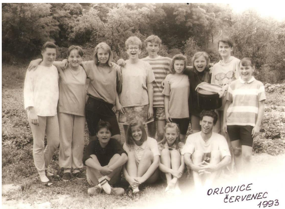
Příloha č. 7: fotografie z roku 1993, 1998