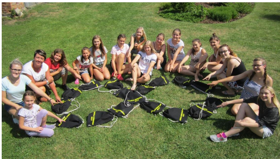
Příloha č. 10: fotografie z roku 2017