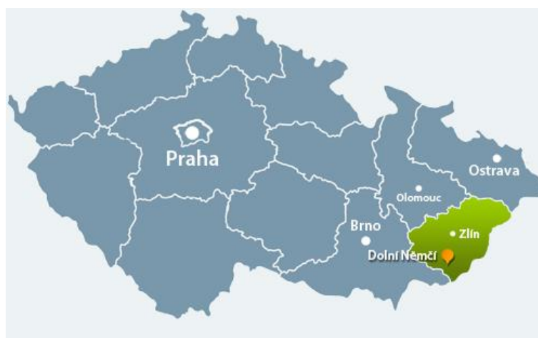
obr. 1: Umístění obce na mapě České republiky

Mikroregion Bílé Karpaty je dobrovolný svazek 9 obcí v okrese Uherské Hradiště založený v roce 2007. Jeho cílem je především rozvíjení veškerých aktivit se vztahem k celkovému rozvoji všech obcí v regionu. Mezi obce zařazené do mikroregionu patří Březová, Dolní Němčí, Horní Němčí, Lopeník, Slavkov, Starý Hrozenkov, Strání, Vápenice, Vyškovec. Sídlem mikroregionu je obec Strání.