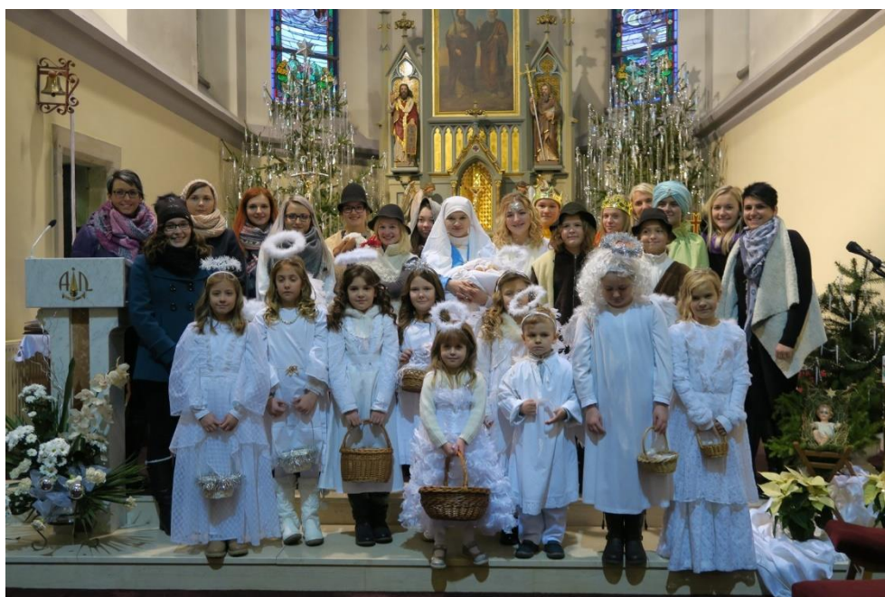
Příloha č. 9: fotografie z roku 2016, 2017