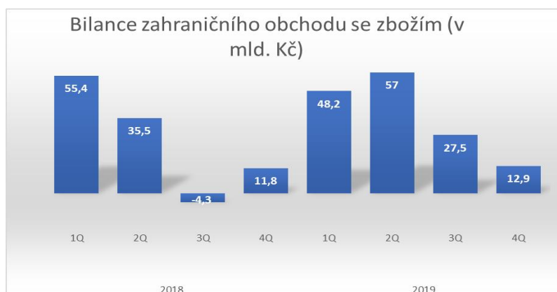
Obrázek 1: Graf bilance zahraničního obchodu se zbožím (v mld. Kč)

Od roku 2005 dosahuje český zahraniční obchod pravidelného aktivního salda. Jak lze v tabulce vidět, zahraniční obchod ČR dynamicky roste. Od roku 2005 do roku 2019 se hodnota obrátu zvýšila o 19,2 %. Hodnota vývozu se zvýšila o 19,5 % a hodnota dovozu o 18,8 %. Přesto, že hodnota dovozu představovala menší částku, jeho tempo růstu bylo větší než tempo růstu vývozu.