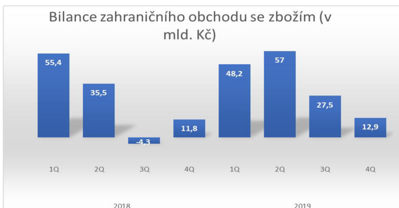
Obrázek 1: Graf bilance zahraničního obchodu se zbožím (v mld. Kč)

Od roku 2005 dosahuje český zahraniční obchod pravidelného aktivního salda. Jak lze v tabulce vidět, zahraniční obchod ČR dynamicky roste. Od roku 2005 do roku 2019 se hodnota obrátu zvýšila o 19,2 %. Hodnota vývozu se zvýšila o 19,5 % a hodnota dovozu o 18,8 %. Přesto, že hodnota dovozu představovala menší částku, jeho tempo růstu bylo větší než tempo růstu vývozu.