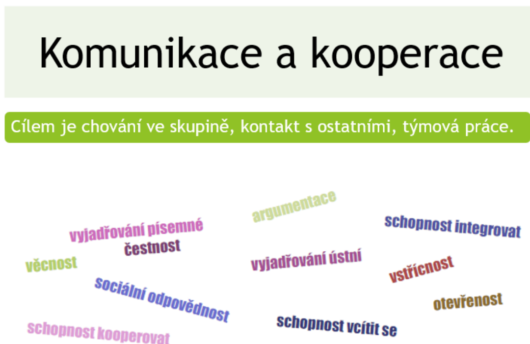
Obrázek 1 - kompetence v prezentaci