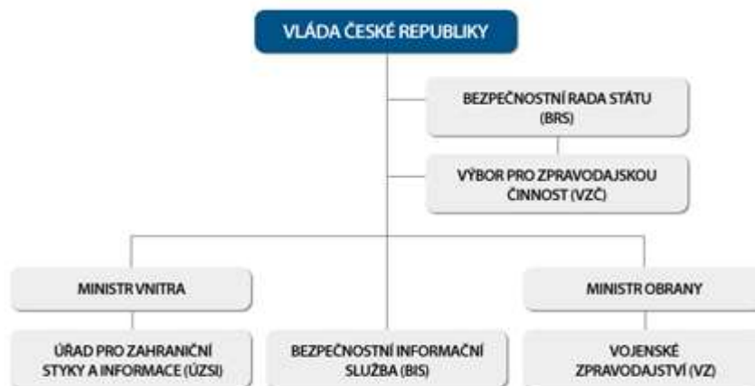
Obr. 1. Zpravodajský systém České republiky

Vláda České republiky sehrává v celém zpravodajském systému České republiky zásadní úlohu. Na základě jejího zadání a jejích zákonných požadavků dochází k vytyčování okruhu informací, které mají být získávány. Mezi další součásti zpravodajského systému České republiky (viz obr. 1) patří Bezpečnostní rada státu a Výbor pro zpravodajskou činnost. Jednotlivé zpravodajské služby, kterými Česká republika disponuje, tvoří poslední a nedílnou část zpravodajského systému. Českým zpravodajským službám se bude samostatně věnovat další kapitola této diplomové práce.