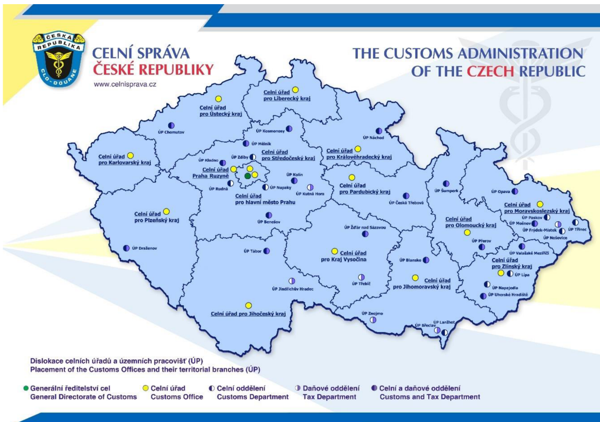
Obrázek 3. Dislokace celních úřadů a územních pracovišť Celní správy České republiky. Celní správa České republiky (2023).