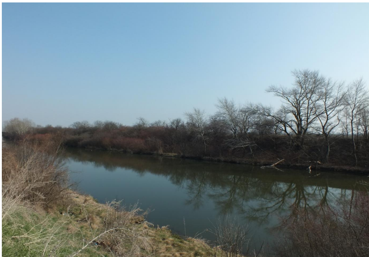
Obrázok 6 Pohľad na úsek č. 1 (autorka, apríl 2015)