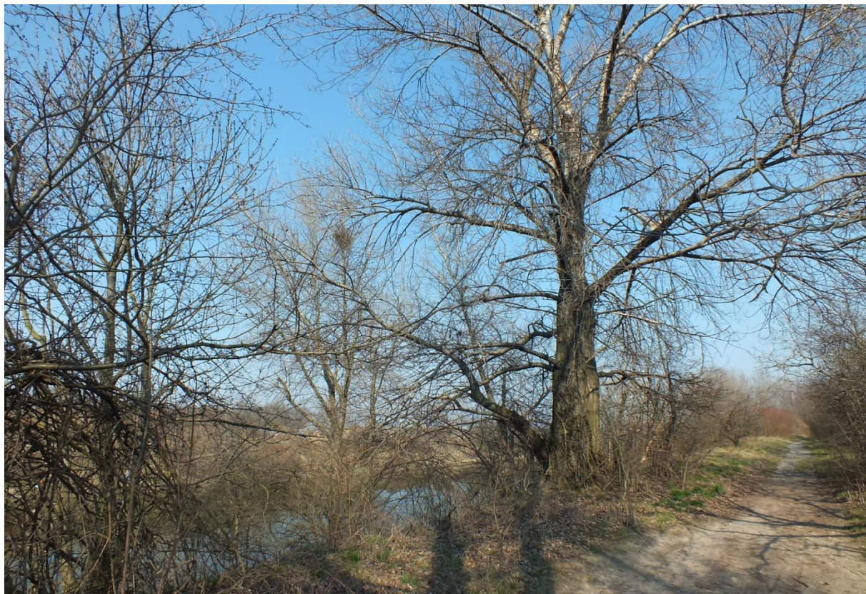
Obrázok 4 Pohľad na ľavý breh úseku č. 1 (autorka, marec 2015)