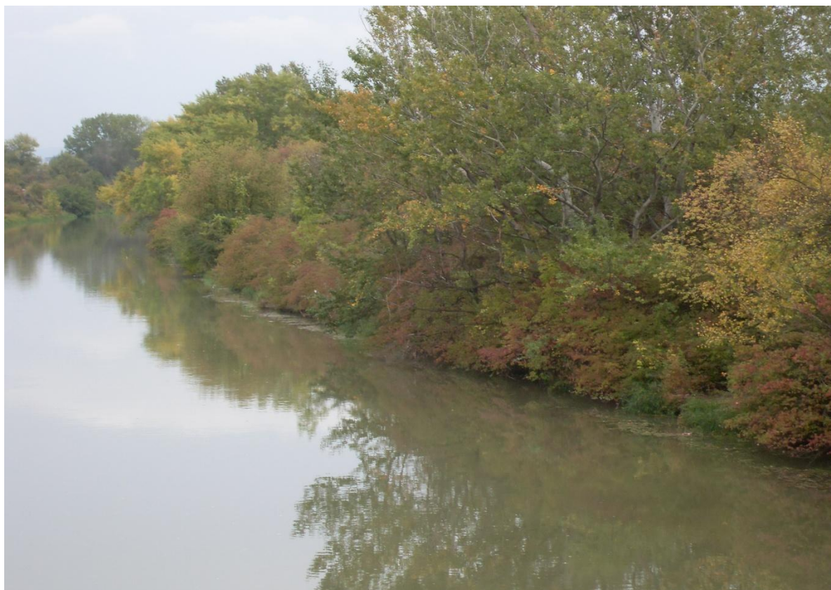
Obrázok 8 Zosadzovací rez topoľa čierneho ( Populus nigra ) v úseku č. 2 (autorka, marec 2015)