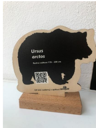
Obr. č. 16: Dřevěná živočišková