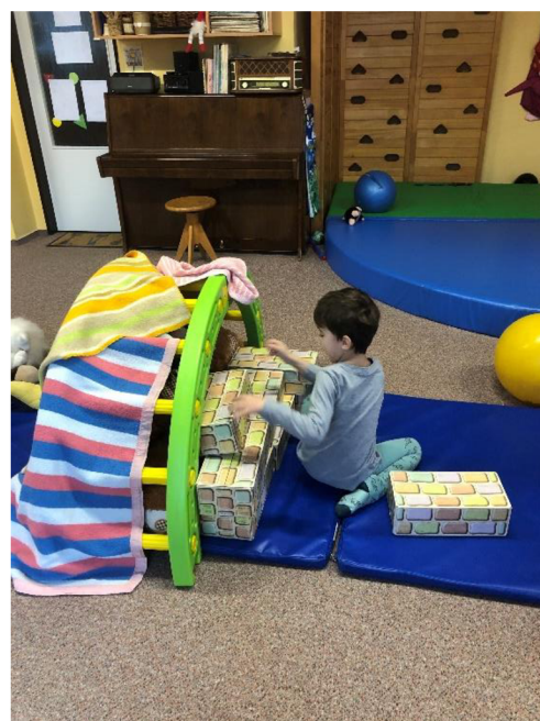
Obr. č. 11: Doupě pro medvěda