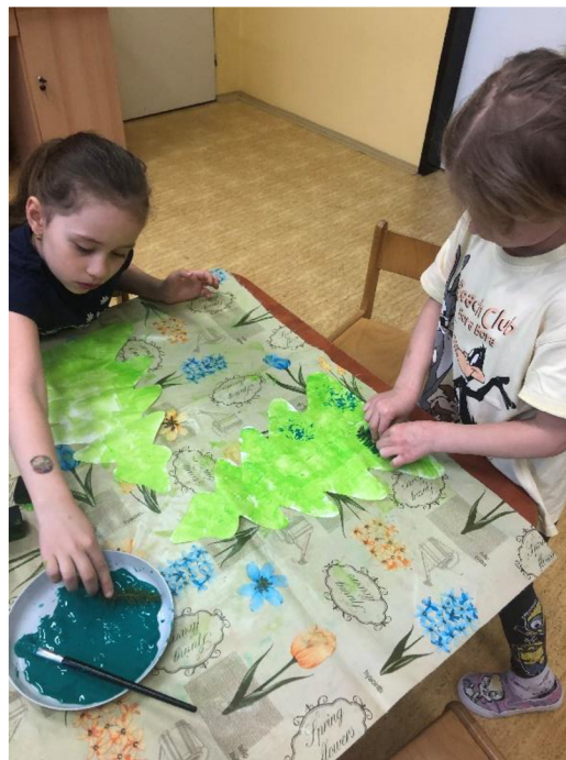
Obr. č. 3: Výroba stromů