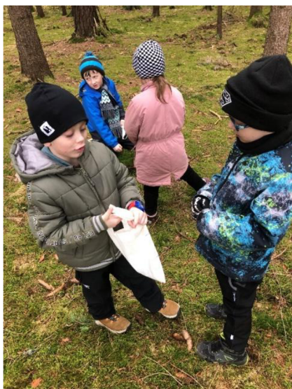
Obr. č. 12: Hádáme přírodniny