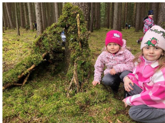
Obr. č. 23: Stavění domečků