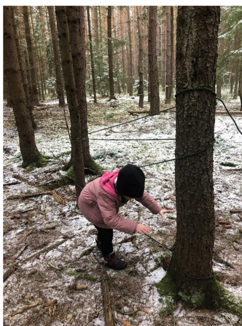
Obr. č. 33: Překážková dráha