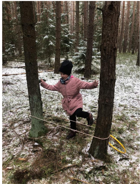
Obr. č. 31: Překážková dráha