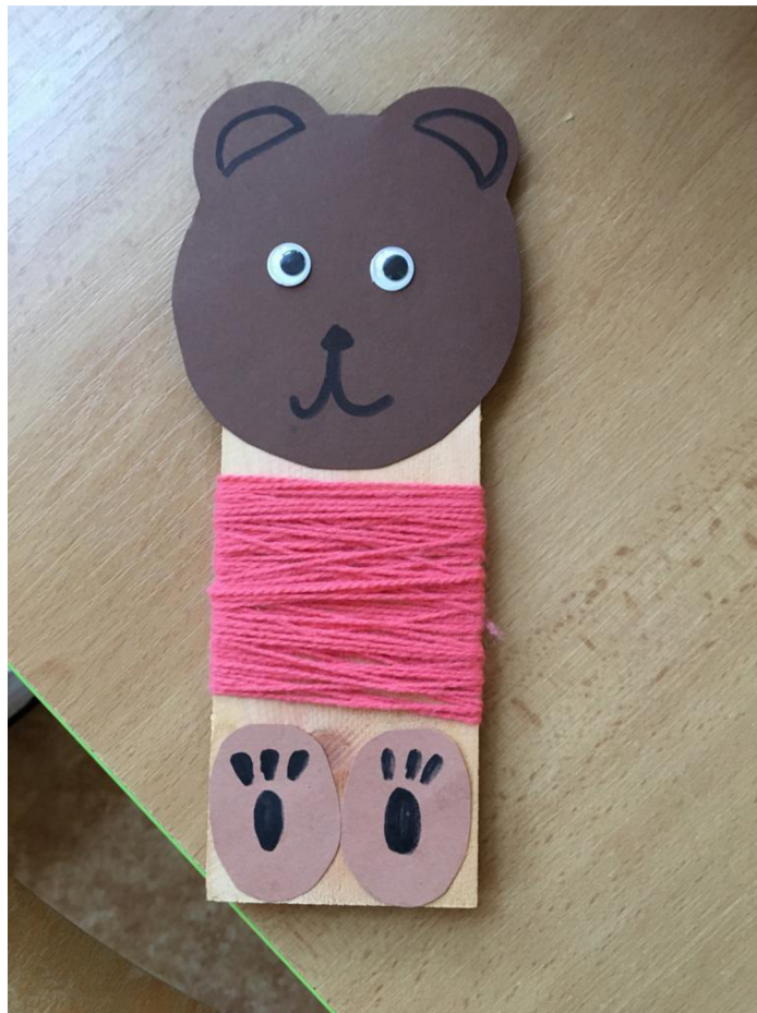
Obr. č. 20: Vyrobený medvěd