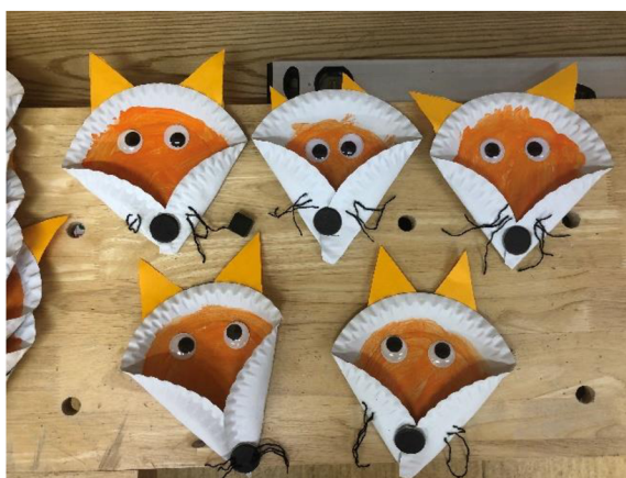
Obr. č. 9: Tvoření lišky (zdroj: Autorka, 2023)