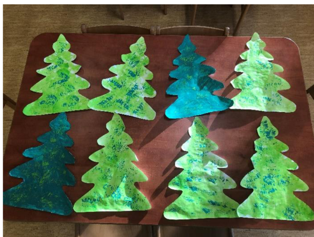
Obr. č. 2: Stromy

Popis činnosti: Vystříháme velké stromy z papíru, které pak děti dotváří barvou, kterou nanáší pomocí houbičky. Poté si namočí do jiného odstínu zelenou větvíčku s jehličím a potiskají s ní strom.