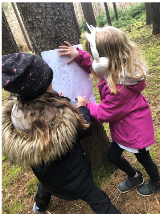
Obr. č. 4: Frotáž kůry

Popis činnosti: Děti si ve dvojici najdou v lese strom, na který přiloží papír a přežijí po něm voskovkou. Jeden z dvojice drží papír, druhý zkouší frotáž. Pak se vystřídají.