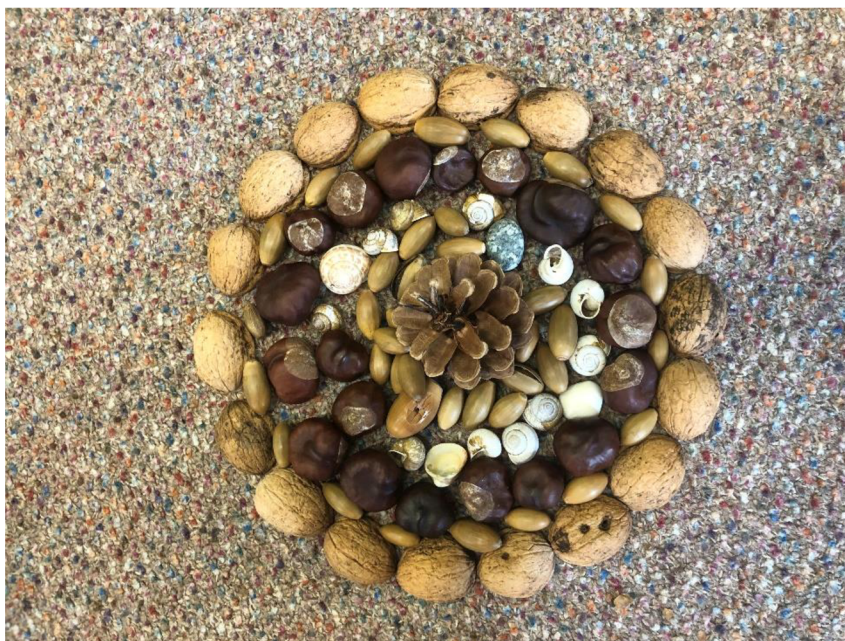
Obr. č. 28: Mandalové tvoření