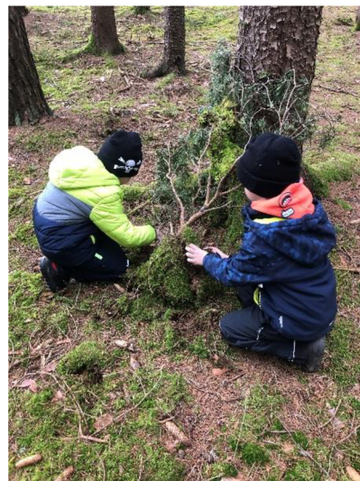
Obr. č. 25: Stavění domečků