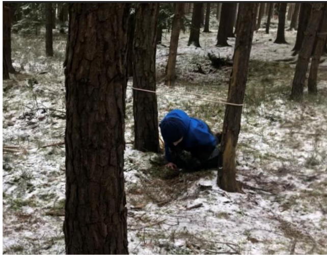
Obr. č. 29: Překážková dráha