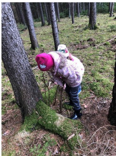
Obr. č. 24: Stavění domečků