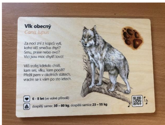
Obr. č. 17: Informace o živočiších