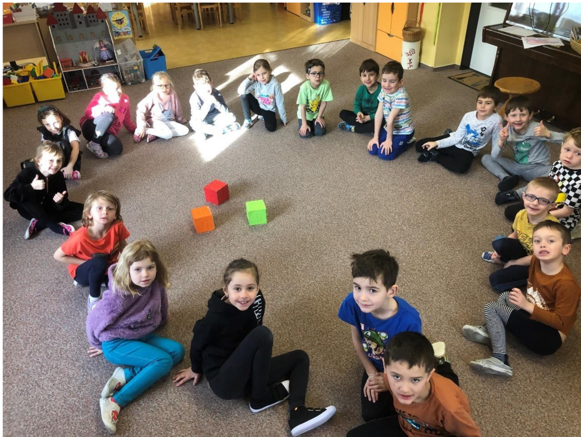
Obr. č. 14: Čtenářské kostky