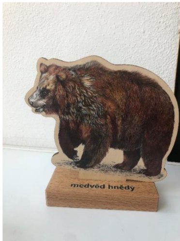
Obr. č. 15: Dřevěná živočišková