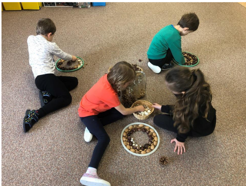
Obr. č. 27: Mandalové tvoření