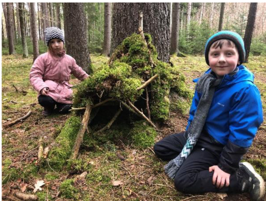
Obr. č. 22: Stavění domečků