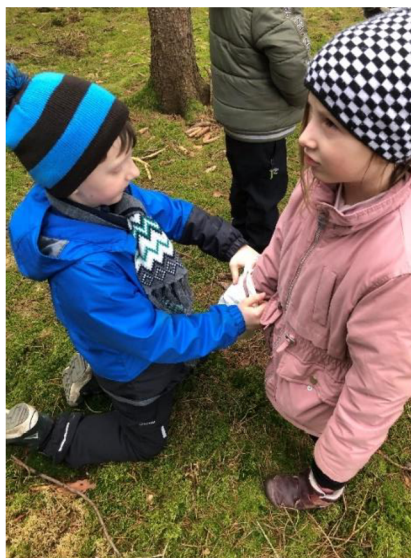
Obr. č. 13: Hádáme přírodniny