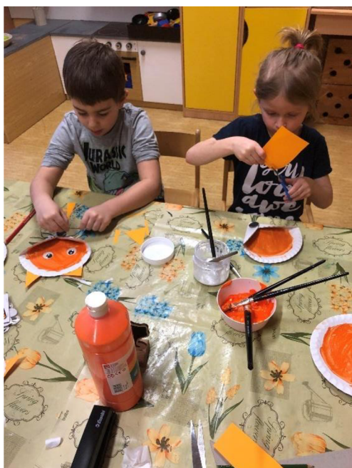
Obr. č. 8: Tvoření lišky

Popis činnosti: Děti si po skupinách tvoří lišku. Postup práce nejdříve vysvětlíme. Děti namalují papírový talíř temperou. Poté se přehnou dolní dvě strany talíře, tak aby vytvořili „špičku,“ kterou sešijeme sešívačkou. Vezmeme si textilové kolečko, které slouží jako nos a nalepíme ho na sešitý konec talíře. Pak si děti vystříhnou uši z oranžového papíru. Až bude talíř suchý, nalepí si k němu vystřižené uši a plastové oči. Nakonec si k nosu přilepí vousy (krátké provázky z černé bavlny).