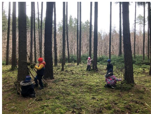
Obr. č. 26: Stavění domečků