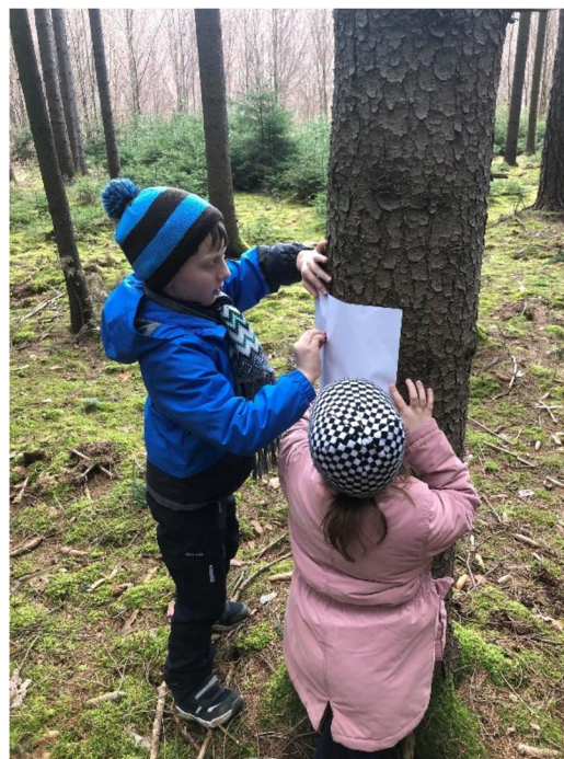
Obr. č. 5: Frotáž kůry