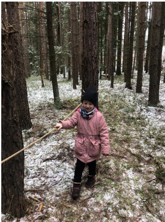
Obr. č. 30: Překážková dráha