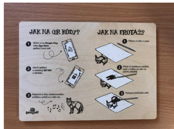
Obr. č. 18: Návod na skenování QR kódu