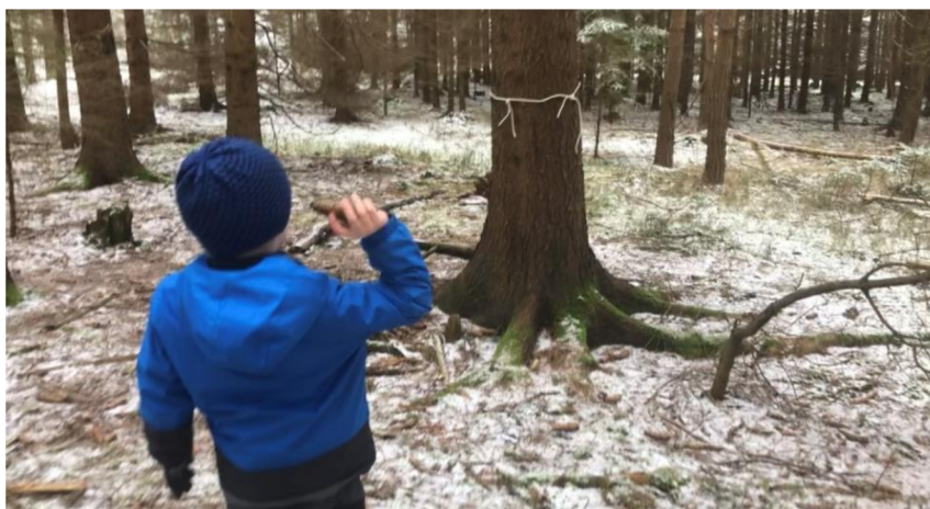
Obr. č. 32: Překážková dráha