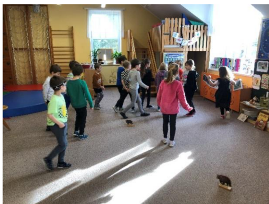
Obr. č. 1: Bedlivě poslouvej

Popis činnosti: Připravíme si zvuky zvířat v mobilní aplikaci Lesní svět. Předem si musíme na jednotlivých zvířatech naskenovat QR kód („Quick Response“), který nám najde informace o jednotlivých živočiších a také jejich zvuk. Rozestavíme po koberci dřevěná zvířata a pouštíme jednotlivé zvuky. Děti poslouchají a až se rozhodnou jaké zvíře to bylo, najdou ho na koberci a postaví se k němu. U této činnosti je nutné, aby děti předtím znaly zvuky jednotlivých lesních zvířat (prase divoké, medvěd hnědý, liška obecná, veverka obecná, jelen obecný, datel černý, jezevec lesní, ježek západní, srnec obecný).