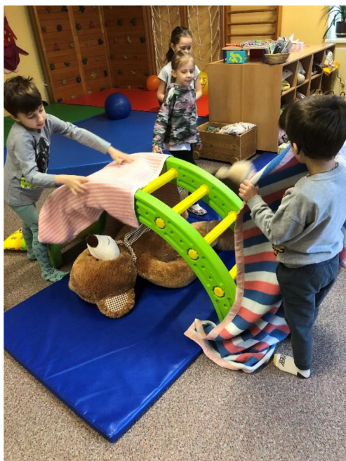
Obr. č. 10: Doupě pro medvěda

Popis činnosti: Děti mají poskytnuté různé materiály a věci ke stavbě doupěte pro medvěda. Musí se samy domluvit, jak budou doupě stavět, jaké materiály použijí, jak bude velké apod. Necháváme jim prostor pro samostatnost a fantazii. Do činnosti zasahujeme pouze, když vzniknou nějaké neshody nebo děti potřebují poradit.