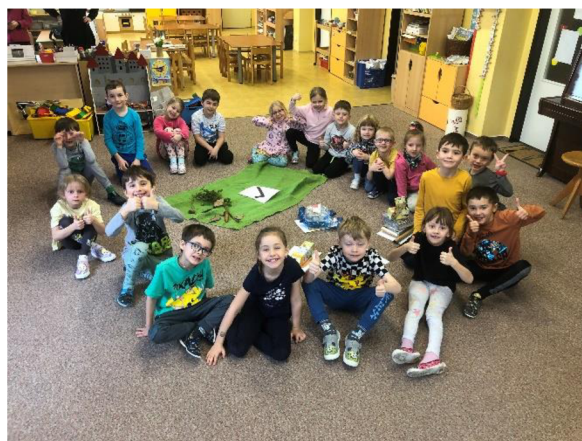
Obr. č. 7: Co do lesa nepatří/patří