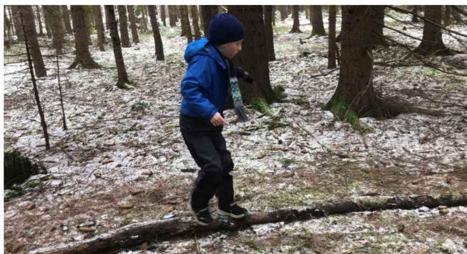
Obr. č. 34: Překážková dráha