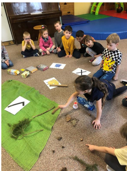
Obr. č. 6: Co do lesa nepatří/patří

Popis činnosti: Do kruhu připravíme zelené plátno, na které dáme symbol ✓. Vedle dáme symbol X a k němu vytisknuté kontejnery. Po koberci rozendáme odpadky a přírodniny. Děti chodí a sbírají věci a dávají je buď na značku X nebo ✓, podle toho, co do lesa patří a nepatří. Co do lesa patří, dávají na symbol ✓, co nepatří na symbol X a rovnou odpadky vytřídí do kontejnerů. Tyto symboly si s dětmi před činností vysvětlíme. Pokud hra bude probíhat v lese, rozmístíme pouze odpadky a symboly, označíme si například stužkami, po jak velkém prostoru se děti budou pohybovat. Přirozenější variantou je samozřejmě ta lesní. Vnitřní prostředí využijeme pouze v případě nepříznivé předpovědi počasí či nedostupnosti lesního ekosystému.