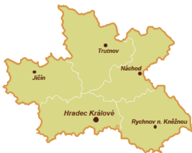
Obrázek č. 3: Mapa středisek PMS v Královéhradeckém kraji 101

Střediska Probační a mediační služby zajišťují plnění úkolů ve vztahu k soudům, státním zastupitelstvím a Policii ČR. Působí v sídlech okresních soudů nebo naroveň jim postavených obvodních nebo městských soudů. 100 V rámci Královéhradeckého kraje působí 5 okresních soudů a tím i stejný počet středisek PMS- v Hradci Králové, Náchodě, Rychnově nad Kněžnou, Trutnově a Jičíně. Rozmístění středisek v rámci okresu poskytujeme na obrázku č. 3.