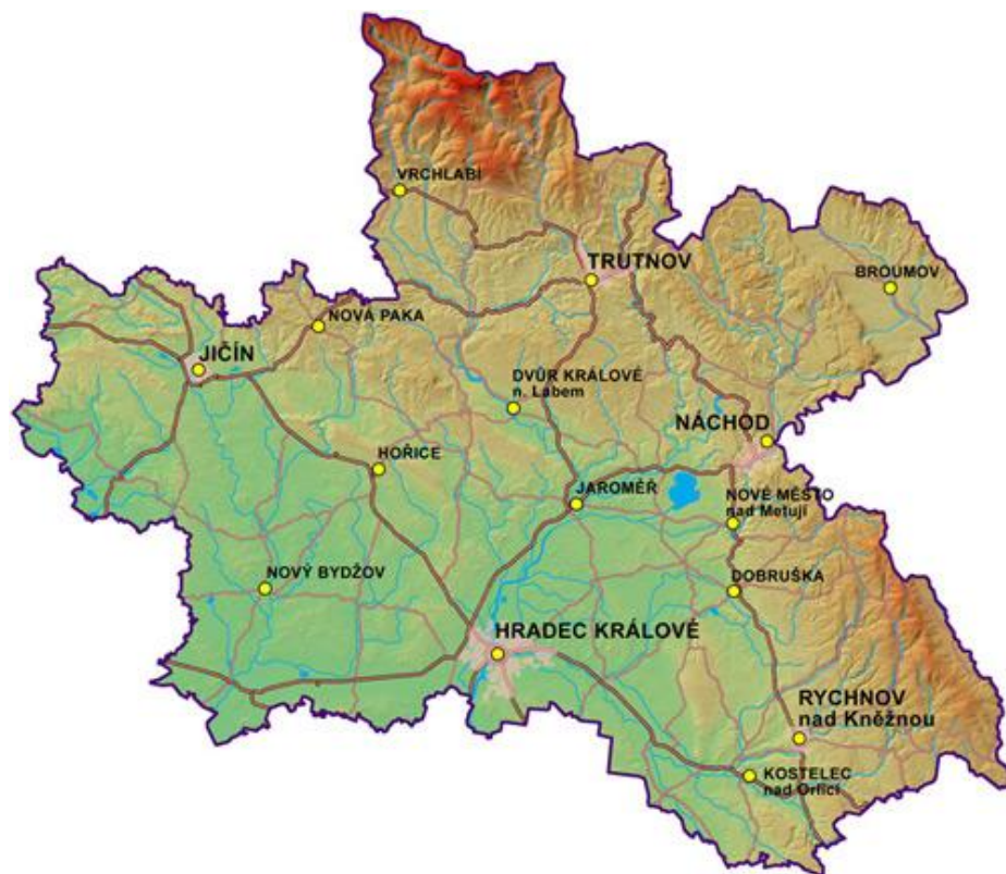
Obrázek č. 5: Mapa Královéhradeckého kraje

v oblasti Krkonoš. Zemědělství, ve kterém převažuje pěstování obilovin, řepky a kukuřice, je neintenzivnější v oblasti Polabí. Průmysl je naopak soustředěn převážně do velkých měst. 125