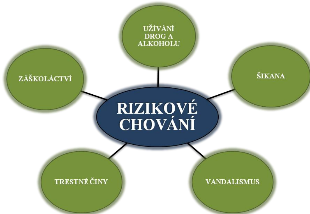
Obrázek č. 1: Vybrané typy rizikového chování mladistvých 23

Pro bližší popis jsme zvolili pouze některé typy rizikového chování. Jejich přehled poskytujeme na obrázku č. 1.