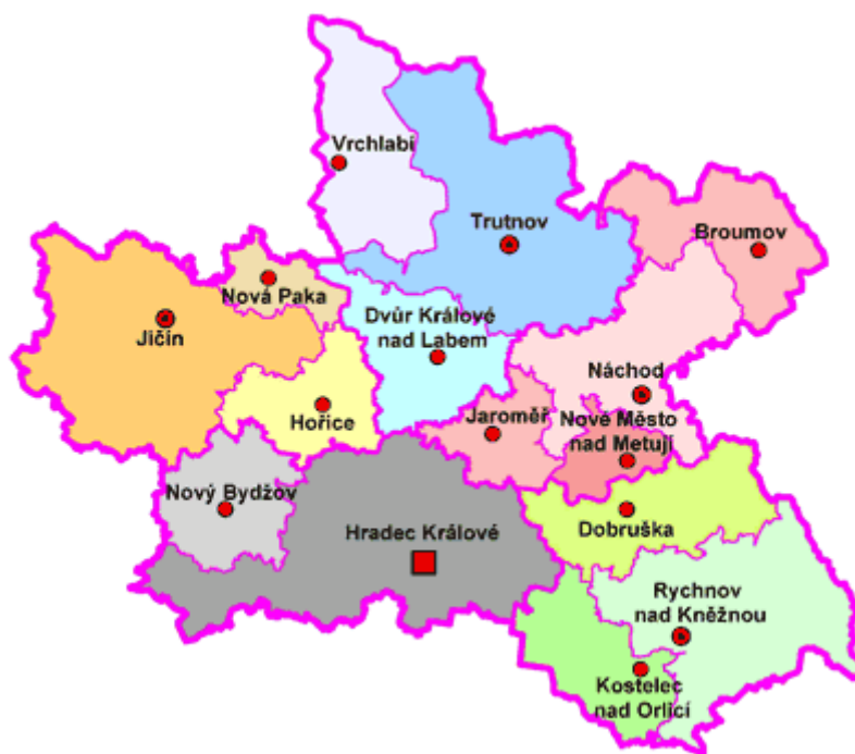
Obrázek č. 2: Mapa obcí s rozšířenou působností v Královéhradeckém kraji 44

keré se opakovaně dopouští útěků od rodičů nebo jiných fyzických či právnických osob odpovědných za jejich výchovu. To vše za předpokladu, že tyto skutečnosti trvají tak dlouho nebo mají takovou intenzitu, že nepříznivě ovlivňují vývoj a jsou či mohou být příčinou nesprávného vývoje. Péči o tyto děti zabezpečuje kurátor pro mládež v rámci tzv. sociální kurately na obecním úřadu obce s rozšířenou působností, jehož je zaměstnancem. 41 „Sociální kuratela spočívá v provádění opatření směřujících k odstranění, zmírnění nebo zamezení prohlubování anebo opakování poruch psychického, fyzického a sociálního vývoje dítěte.“ 42 V Královéhradeckém kraji bylo k 1. 1. 2003 zřízeno 15 správních obvodů obcí s rozšířenou působností. 43 Jejich rozmístění na mapě kraje poskytujeme na obrázku č. 2. Údaje o jednotlivých správních obvodech přikládáme v příloze č. 1