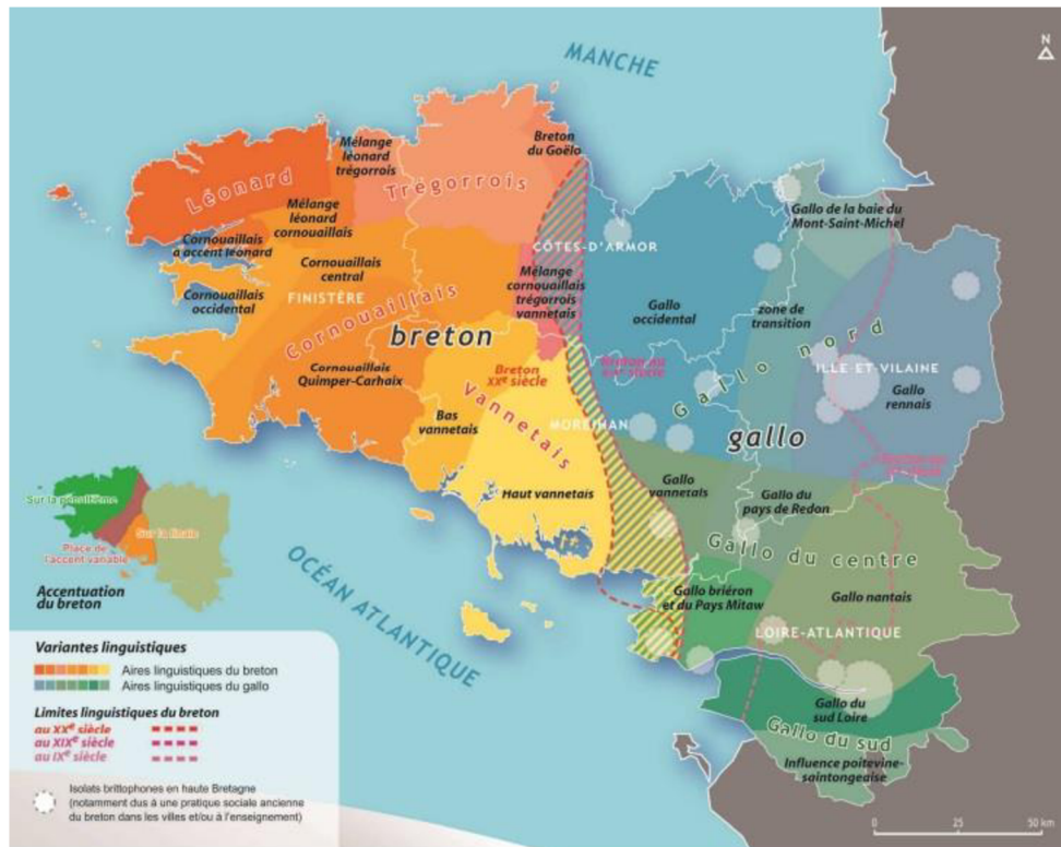
Figure 3 Trois zones linguistique de la Bretagne. Mikael Bodlore-Penlaez, 2015

Ce qui est plus difficile à tracer c'est la limite du gallo avec les langues d'oïl voisines à l'est : le normand, le mayennais, l'angevin ou bien le poitevin. Comme toutes ses langues partagent les mêmes racines du latin, elles forment un continuum linguistique - elles se mélangent et se superposent sur plusieurs régions. Il n'est pas tout à fait possible de tracer des limites entre ces langues.