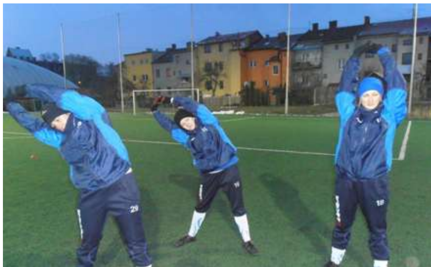
Obrázek 7: Trénink rozevření