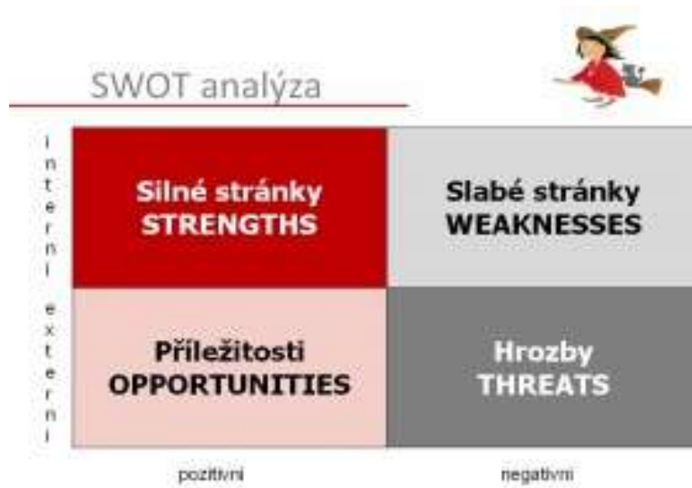
Obrázek 1: Swot analýza