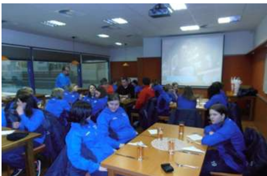
Obrázek 8: Stravování