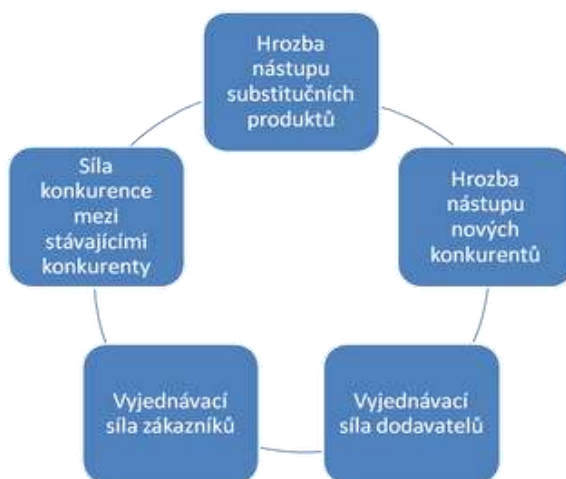
Obrázek 2: Porterův model pěti sil