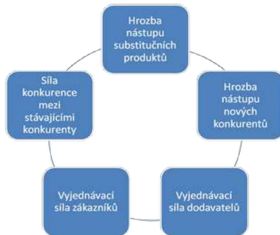
Obrázek 2: Porterův model pěti sil