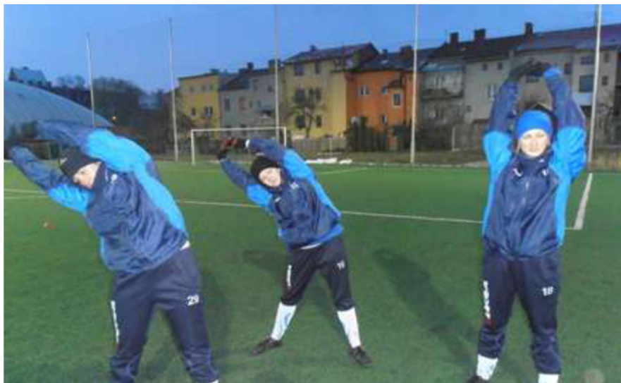
Obrázek 7: Trénink rozevření