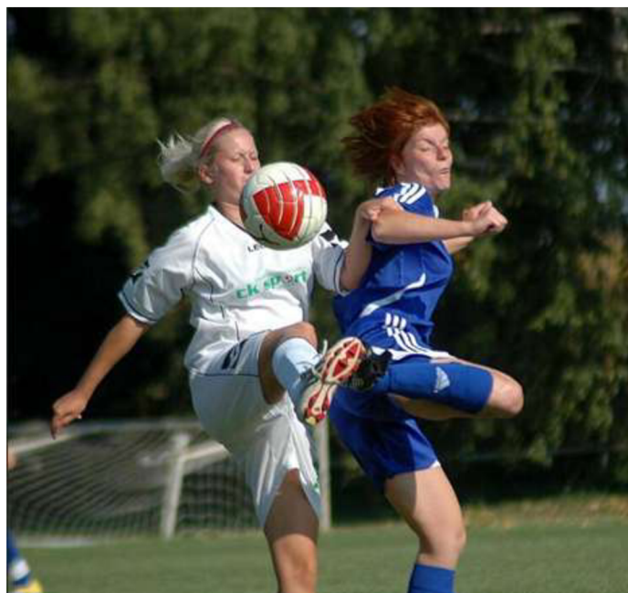
Obrázek 3: Zápas FC Olomouc x Horní Heršpice

V tabulce jsou zahrnuty pouze soutěže dospělých.