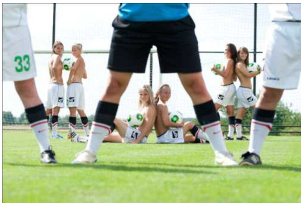
Obrázek 6: Ukázka další fotografie z kalendáře