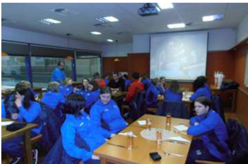
Obrázek 8: Stravování