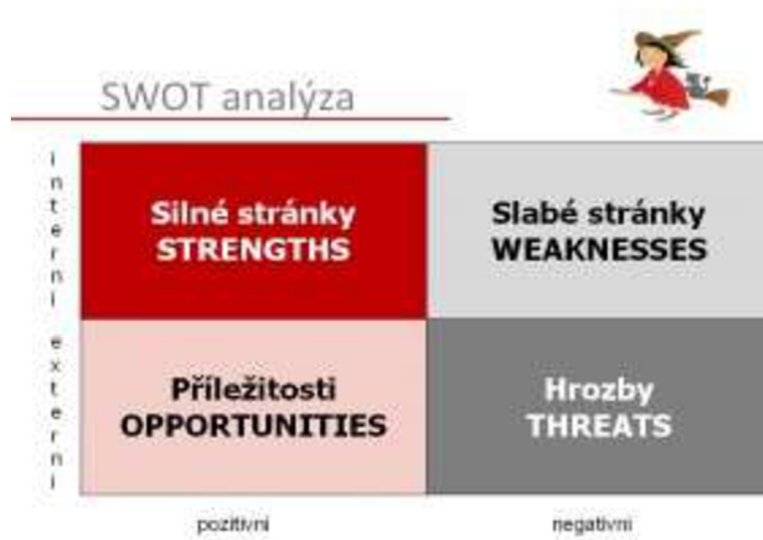
Obrázek 1: Swot analýza