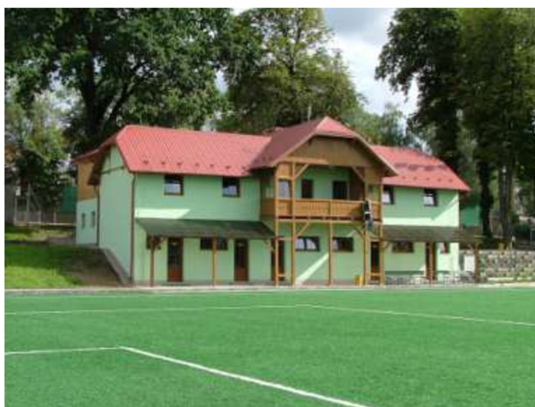
Obrázek 4: Turistická ubytovna Gól

Objekt je nově zrekonstruován. Na pokojích nejsou k dispozici sociální zařízení. Možnost využití kuchyňky, kde je mikrovlnná trouba, lednička a sporák.