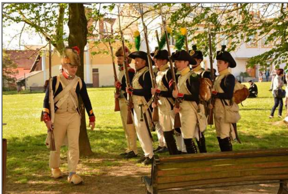
Obr. 15 Výcvik se zbraní v uniformě. Zámek Chropyně 2016.