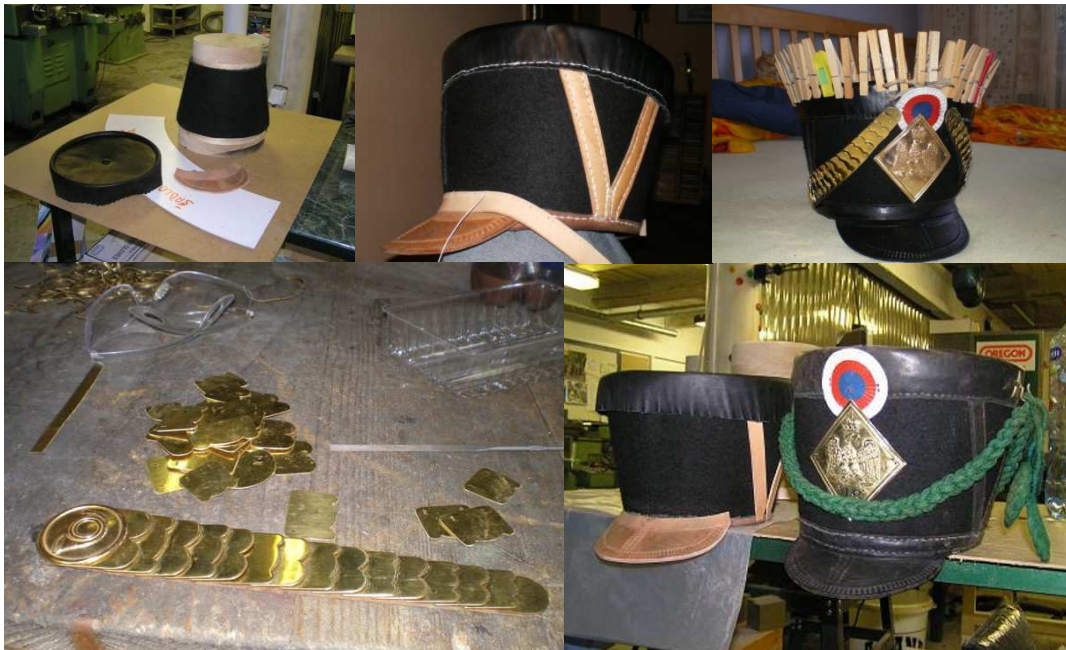
Obr. 22 Výroba čáka vzor 1807.

Z důvodu pracnosti a časové náročnosti bude pro žáky vhodné začít nejdříve s výrobou jednoduchého třírohého klobouku. Vzor a rozměry lze dle domluvy získat od členských jednotek KVH, se kterými se žáci setkají v průběhu volnočasové aktivity. Pro ně mohou vyrábět na čáka drobné doplňky, například „šupiny“ podbradníku – viz obrázek 22.