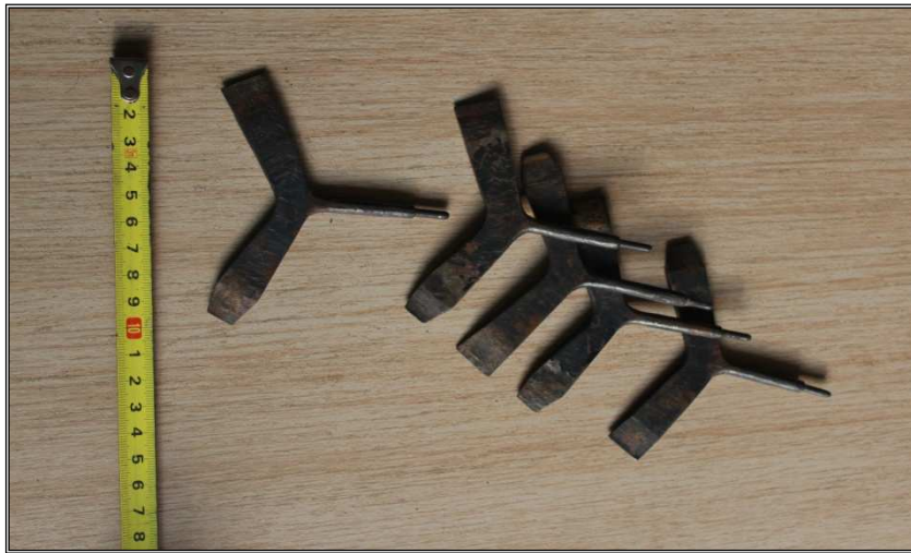
Obr. 21 Dobový klíč – šroubovák na pušku.

Rozměr 100 x 100mm, materiál černěný kov, opracováno kovářím. Dva konce zakončené ostřím šroubováku různých délek, jeden konec zakončený jehlou na čištění (propíchnutí) zátravky zbraně.