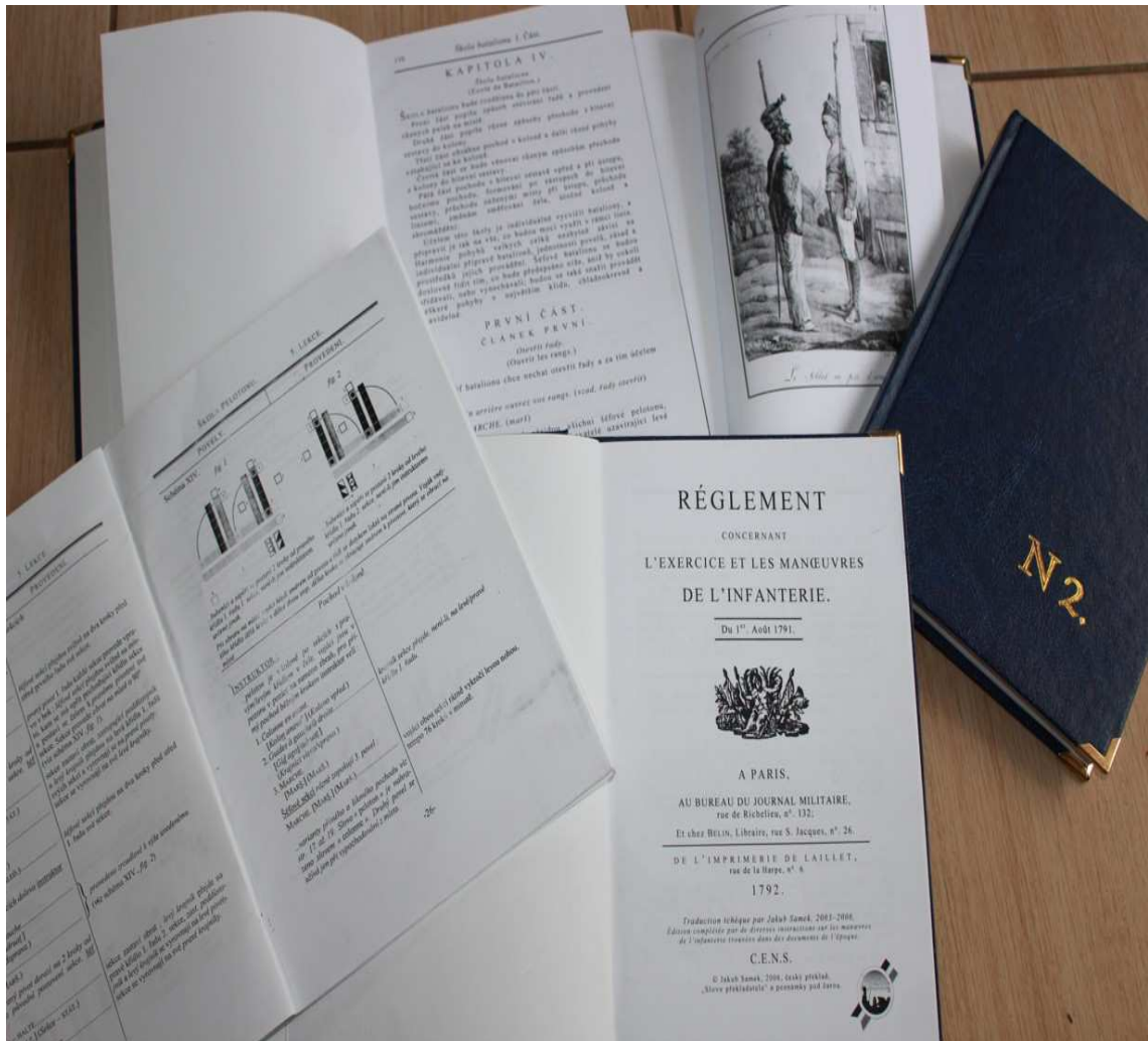
Obr. 11 Kompletní sada Škola vojáka/ pelotonu/ batalionu.