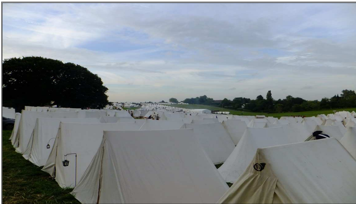
Obr. 16 Dobový tábor. Belgie, Waterloo 2015.