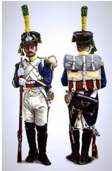
Obr. 4 Voltigeurs francouzské armády, výstrojní doplňky rok 1812 při povelu „Repos“ – pohov.