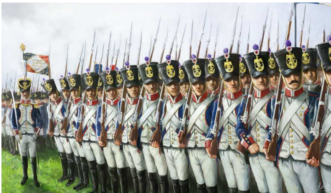
Obr. 7 Vyrovnání doleva – „A gauche alignement“.

Popisek k obrázku: Voják na konci řady vlevo při přehnaném vytočení hlavy svým ramenem tlačí nesenou zbraň mimo formaci – špatné provedení. Třetí voják zprava – špatný spodní úchop pažby pušky.