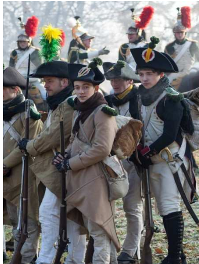
Obr. 3 „Repos“ – levá noha zůstává na místě, pravá úkrok dozadu.

Na tento povel již nemusí voják dodržovat nehybnost, tak jak u základního postoje. Zůstává však na místě. Pravá noha ukročí vzad, levá zůstává na původním místě. Zbraň opřena o zem u pravé nohy, vždy hlavní nahoru – v rámci zaručení bezpečnosti – vždy mimo tělo.