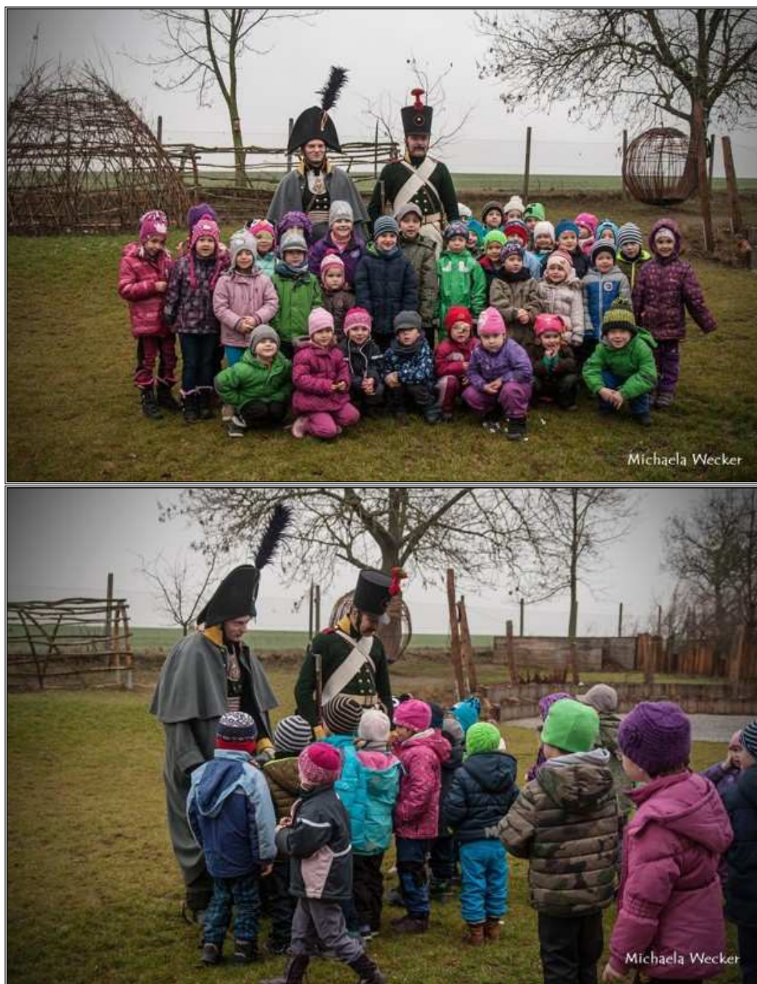
Obr. 18 Beseda pro předškolní děti 2016.