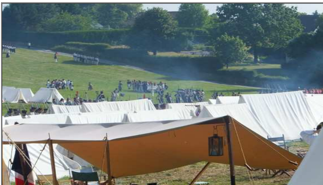
Obr. 17 Dobový tábor, v pozadí prostor pro výcvik a cvičící jednotky.