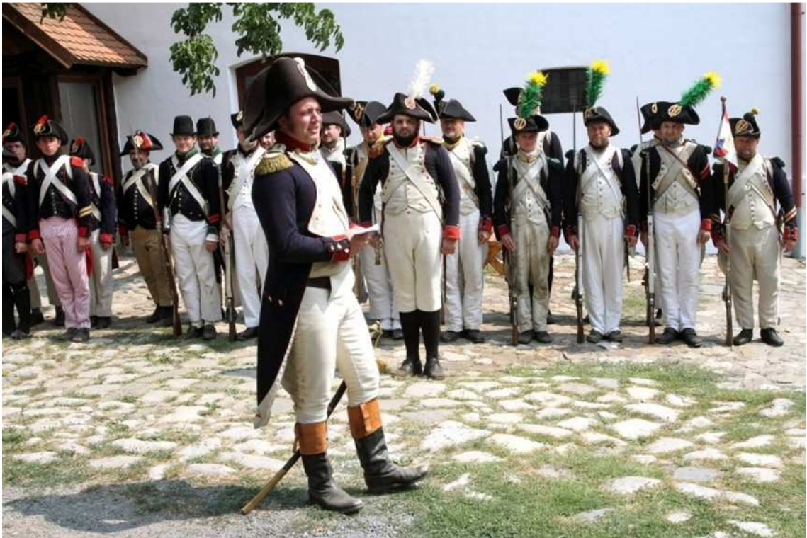
Obr. 2 Základní postoj řady vojáků se zbraní i beze zbraně. zdroj: Jelínek Pavel, autor práce