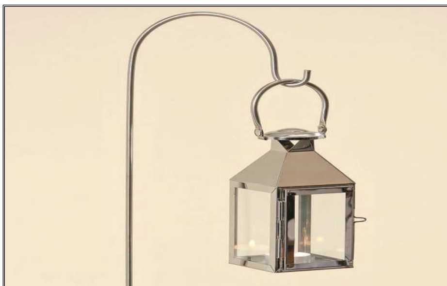
Obr. 20 Závěs na lucernu do tábora.

Přesný tvar imitace pušky zvolí učitel PV na základě strojního vybavení, zkušeností žáků a s přihlédnutím na ŠVP oboru truhlář. Pro účel volnočasové aktivity stačí hrubý tvar pušky rozměrů 40 x 100 x 1500mm. Materiál – dřevo.