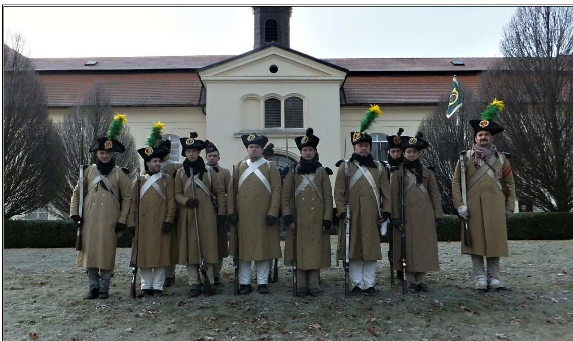
Obr. 14 Výcvik - vojenské kabáty. Výcvik jednotky 18eme Sokolnice prosinec 2016.