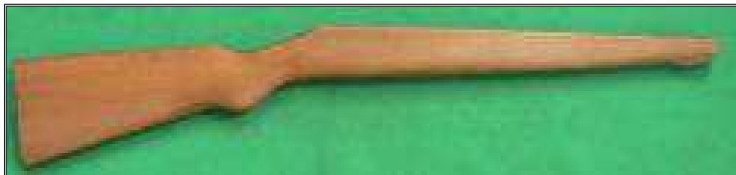
Obr. 19 Ukázka vzoru pro výrobu imitace pušky.

Přesný tvar imitace pušky zvolí učitel PV na základě strojního vybavení, zkušeností žáků a s přihlédnutím na ŠVP oboru truhlář. Pro účel volnočasové aktivity stačí hrubý tvar pušky rozměrů 40 x 100 x 1500mm. Materiál – dřevo.