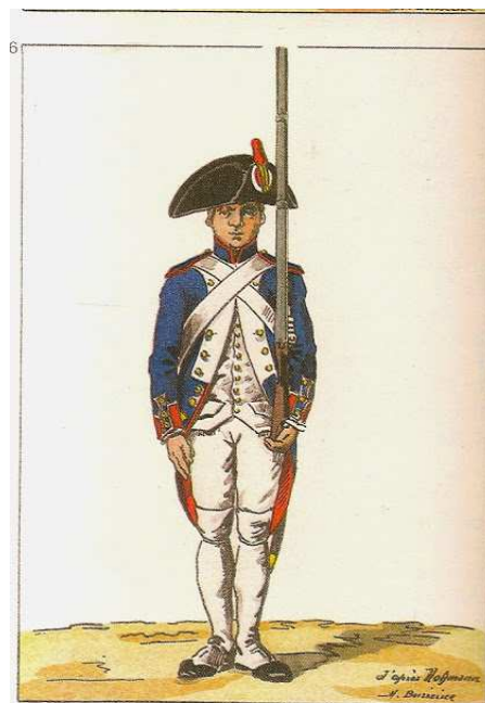
Obr. 5 „Garde a vous“ – uniforma vzor 1805

Většina povelů se skládá ze dvou slov. Na první slovo voják zpozorní a připraví se na provedení povelu a na druhé slovo povelu se teprve začne pohybovat a povel provádět. Tomu také musí odpovídat prodleva mezi oběma částmi povelu. Na tento povel se voják vrátí do základního, nehybného postoje. Zbraň zdvižená v levé ruce, opřena o rameno.