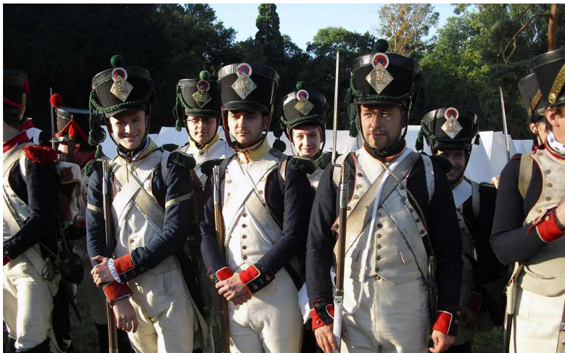
Obr. 6 Jednotka při nástupu v táboře. Francie 2014

pro účastníky překonávat společně dané úkoly, namísto vzájemné konkurence, soutěživosti a rozdělování se dle výkonnosti.