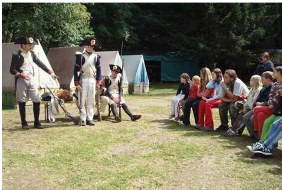
Obr. 1 Členové jednotky řadové pěchoty při besedě na letním dětském táboře, který pořádají.