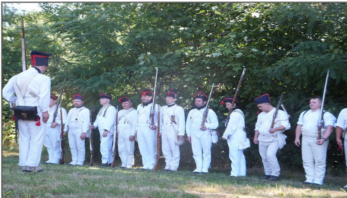
Obr. 13 Výcvik – lehké táborové odění. Bílé kalhoty, bílé tričko/košile.