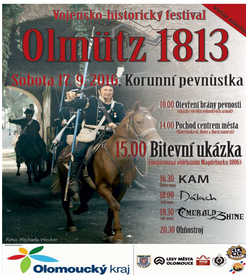
Obr. 8 Plakát s programem z roku 2016.

Popis k obrázku: Přesný program a plakát k letošnímu ročníku nebyl v době uzávěrky hotový, přesto se dá očekávat časový harmonogram velice podobný.