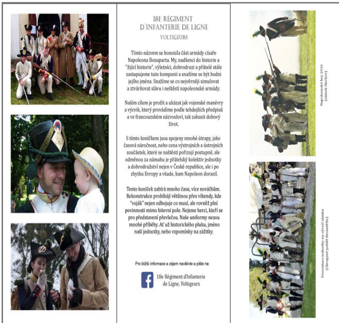
Obr. 12 Leták s kontaktem na jednotku věnující se francouzské pěchotě.