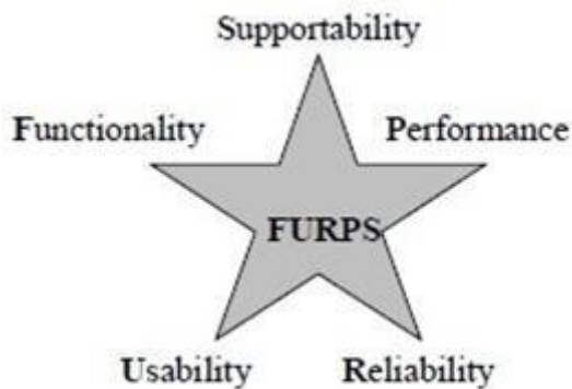
Obrázek 2: Model FURPS (autor podle [5])

Model FURPS poskytuje rámec pro strukturované a komplexní hodnocení kvality softwaru, v dnešní době se většinou setkáváme v rozšířené podobě s názvem FURPS+ , kde je model rozšířen o další kategorie, které jsou důležité pro komplexní hodnocení kvality softwaru. Tyto další kategorie jsou označovány symbolem „+“ v názvu modelu. [2]