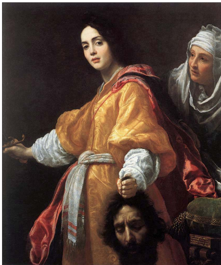
Judit s Holofernovou hlavou (1613)

Cristofano Allori, 16./17. st., italský malíř