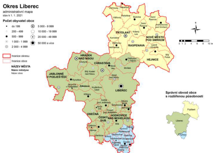
Obrázek 2: Administrativní mapa okresu Liberec

Zdroj: Mapa administrativního rozdělení okresu. In: www.czso.cz [online]. [cit. 2022-03-21]. Dostupné z: https://www.czso.cz/documents/11260/57458328/adm_Liberec.png/4c7227a8-68bf-4153-92eb-963fd6899d65?version=1.6&t=1615471059747