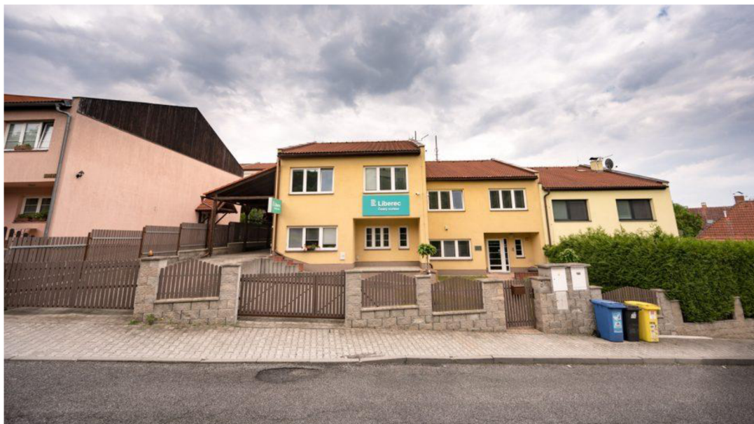
Obrázek 1: Budova Českého rozhlasu Liberec