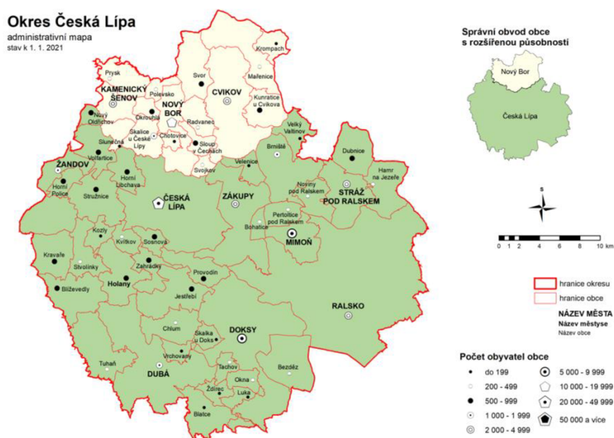
Obrázek 5: Administrativní mapa okresu Česká Lípa