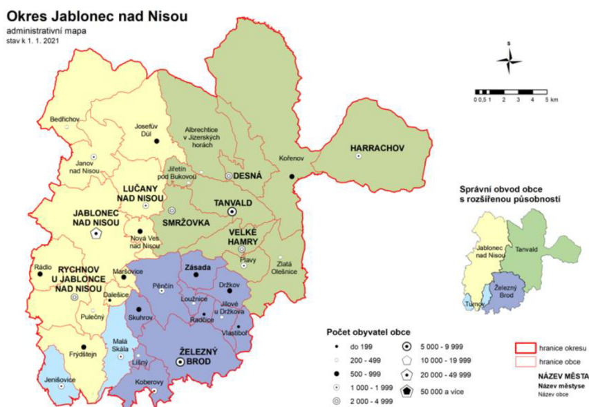
Obrázek 3: Administrativní mapa okresu Jablonec nad Nisou