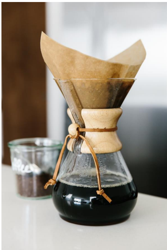
Obr.5: Chemex s papírovým filtrem