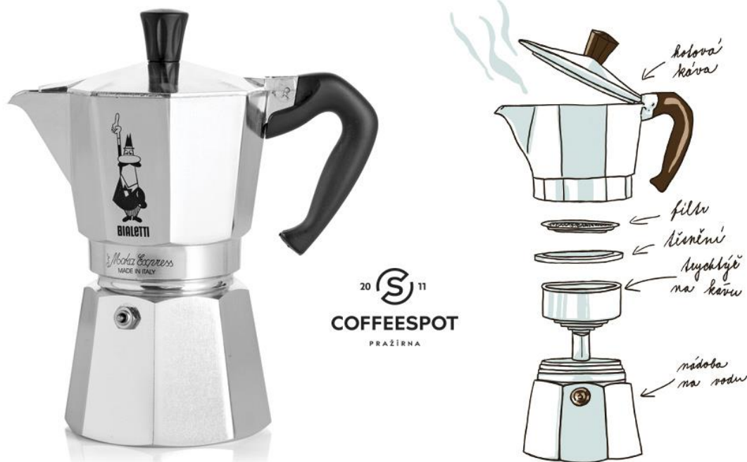
Obr.6.: Moka express a rozdělení

spálit těsnění v prostřední části. Kávu rozléváme do šálků a podáváme. V běžném obchodě se dá pořídit náhradní těsnění, postupem času zestárne a nebude plně funkční.