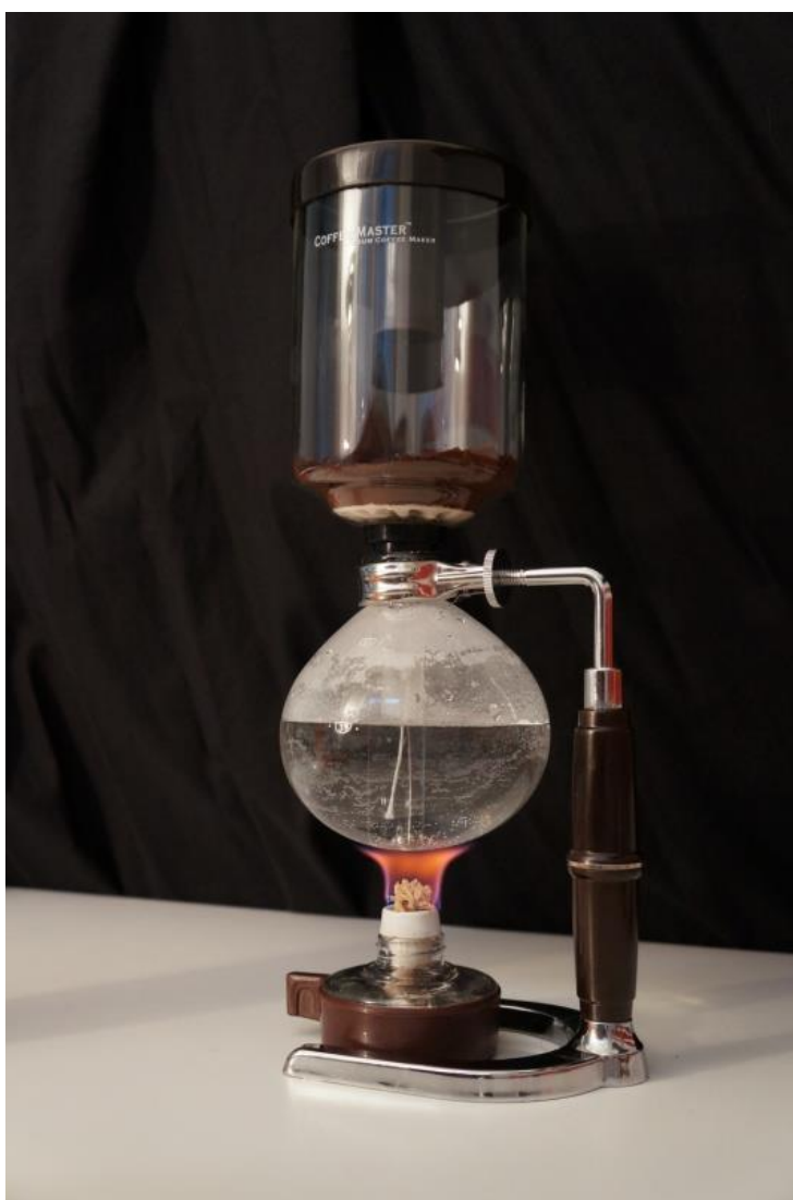
Obr.9: Příprava Vakuum Pot

Ve chvíli, kdy je téměř všechna voda ve vrchní části, nasypeme do horní nádoby kávu, která je hrubě namletá. Dávka záleží na velikosti vakuum potu a naší chuti. Obecné pravidlo udává 6 gramů kávy na 100 mililitrů vody. Zhruba jednu minutu necháme kávu louhovat a mícháme dřevěnou vařečkou, pak zhasneme kahan. Ve spodní nádobě se začne pára zmenšovat, protože už se nenahřívá a vytvoří se podtlak. Vylouhovaná káva se začne vracet zpět do spodní nádoby. Káva je hotová a je připravená k servírování, nejlépe do předem nahřátých šálek.