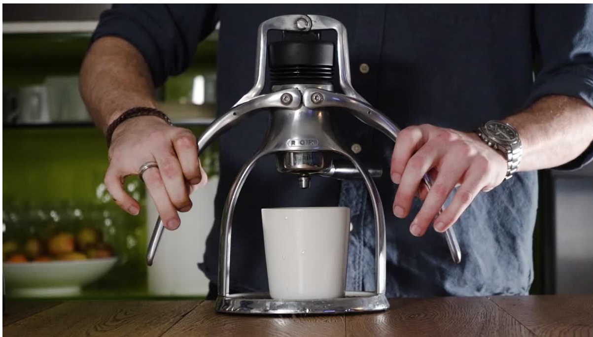
Obr. 11: Příprava ROK Espresso