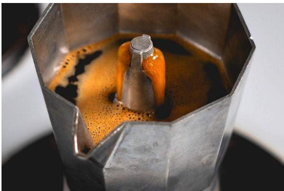
Obr.7.: Příprava moka express