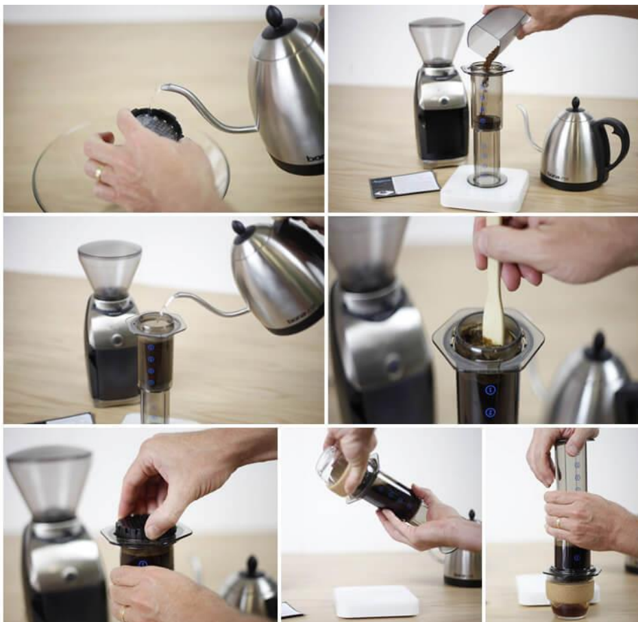
Obr.8: Příprava aeropress obrácenou metodou