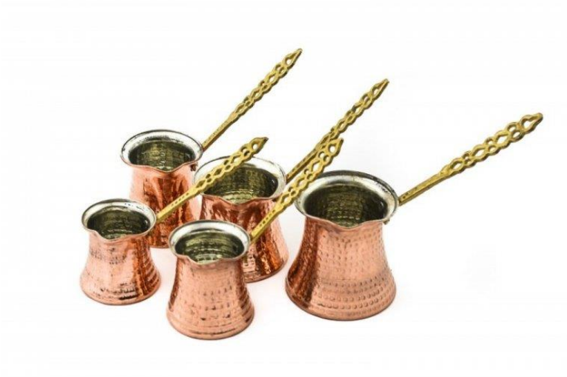
Obr. 10: Džezva Kaffia