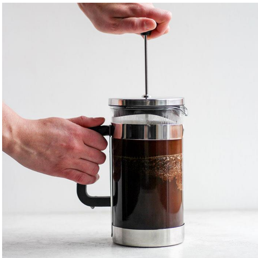
Obr.4: Frenchpress s ručním mlýnkem

Po uplynutí doby vyndáme french press z lednice a sundáme víko. Tekutinu třikrát zamícháme a počkáme, odkud se nezačne škrálop usazovat na dně. Nádobu na pět až deset minut odstavíme a necháme klesnout kávu ke dnu, poté spustíme píst, nestlačíme až na dno, rozvířili bychom zrnka, která se právě usadila. Kávu přelijeme opatrně do čisté nádoby, můžeme ji zředit studenou vodou 1:1 nebo dle chuti, zbytek se dá zamrazit ve vzduchotěsné nádobě po dobu dvou týdnů.