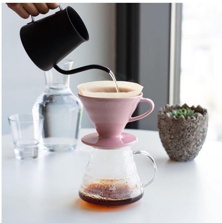
Obr. 12: Příprava metodou Hario V60 Dripper

Hario V60 Dripper se dá pořídit ve dvou variantách. První z nich je verze V60 #1 , která je menší, pojme 250 mililitrů kávy. K ní se dají pořídit filtry, které mají stejné označení a prodávají se po 100 kusech, verze V60 #2 pojme až 450 mililitrů, to vystačí zhruba pro 3 osoby. S dokoupením filtrů je to stejné jako u verze 1, prodávají se po 100 kusech.