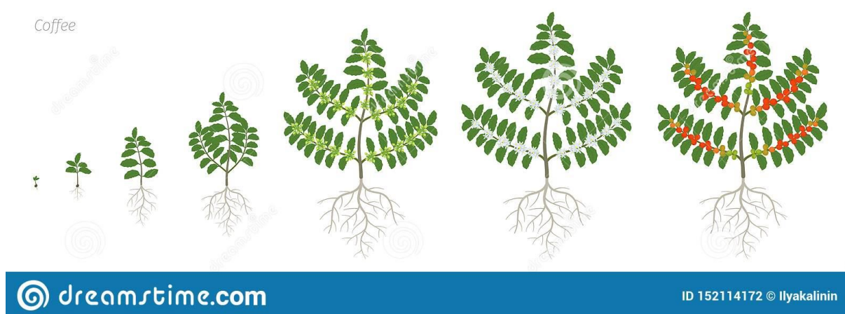
Obr.1: Podrobný proces růstu arabiky

Podmínky růstu ovlivňují kvalitu kávy – květy a plody jsou citlivé na silný vítr, sluneční záření a mráz.