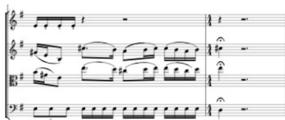
Obr. 4 177

V závěru této skladby dochází k diferenciaci v jednotlivých hlasech, viz obr. 4: