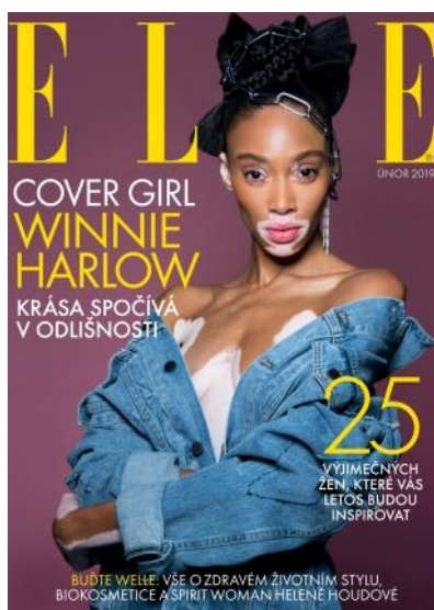
7 Netypické zobrazení krásy (ELLE, 2019)