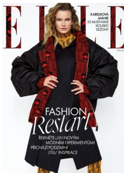
8 Fashion fotografie (ELLE, 2021)