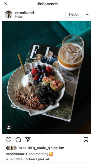
3 ELLE jako doplněk IG účtu (Instagram, [online] 2021, veronikamr1)