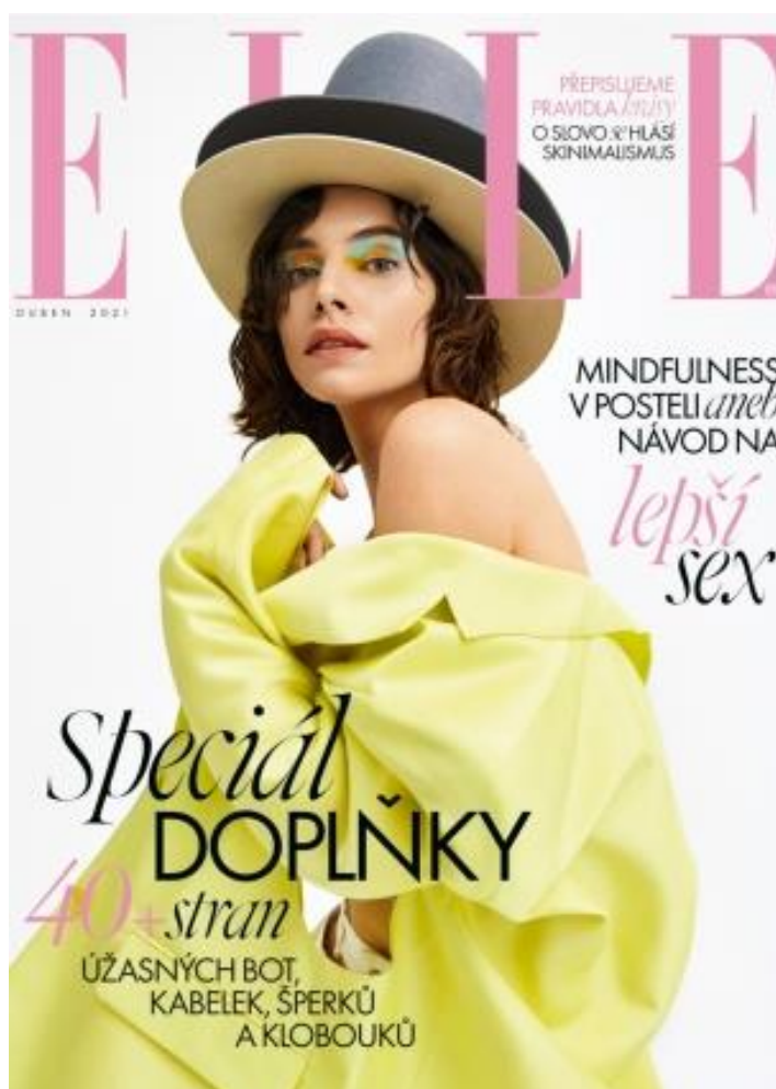
16 Duben 2021