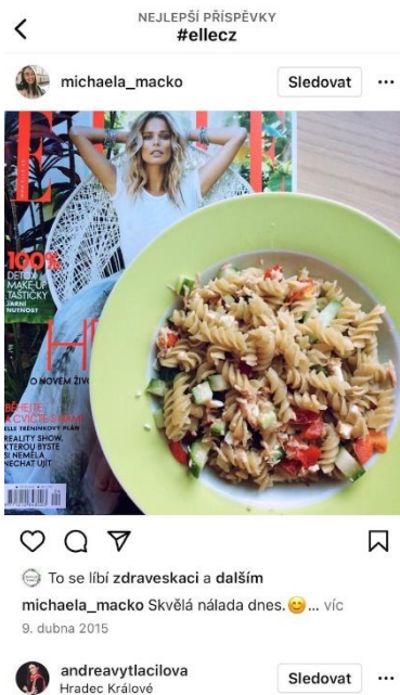
6 ELLE jako doplněk IG účtu (Instagram, [online] 2015, michaela_macko)

Ačkoliv se sám časopis prezentuje celosvětově jako nejčtenější, výsledky čtenosti Media projekt z ČR ukazují spíše průměrnou čtenost. Za 1. a 2. čtvrtletí v roce 2021 měl časopis