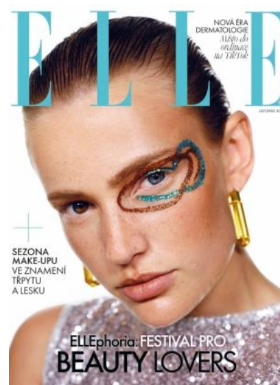
9 Beauty fotografie (ELLE, 2021)