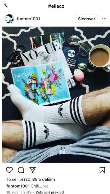
4 ELLE jako doplněk IG účtu