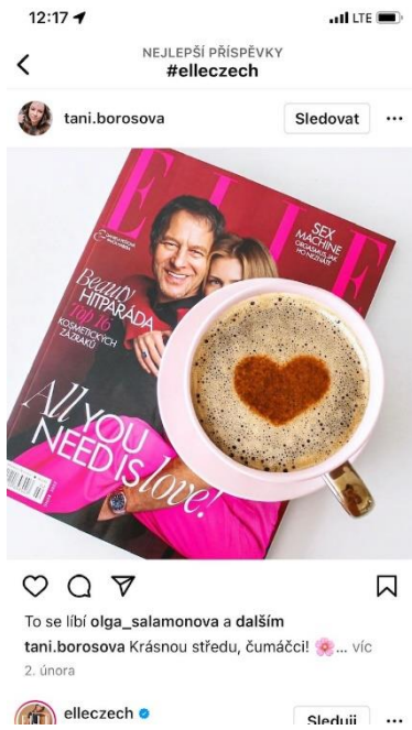
2 ELLE jako doplněk IG účtu (Instagram, [online] 2022, tani.borosova)