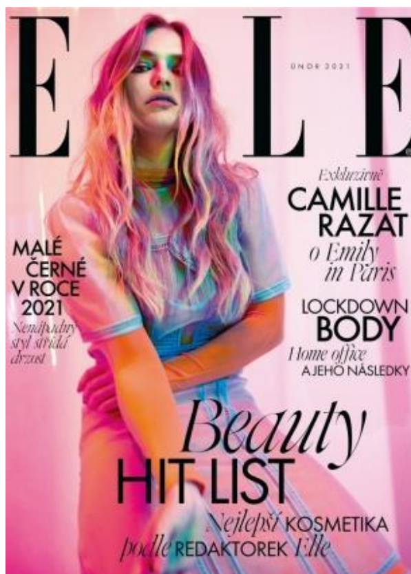
14 Únor 2021