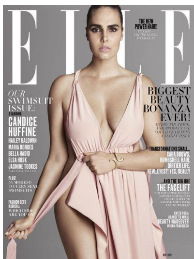
11 Modelka nadměrných velikostí Candice Huffine (ELLE, [online] 2017)