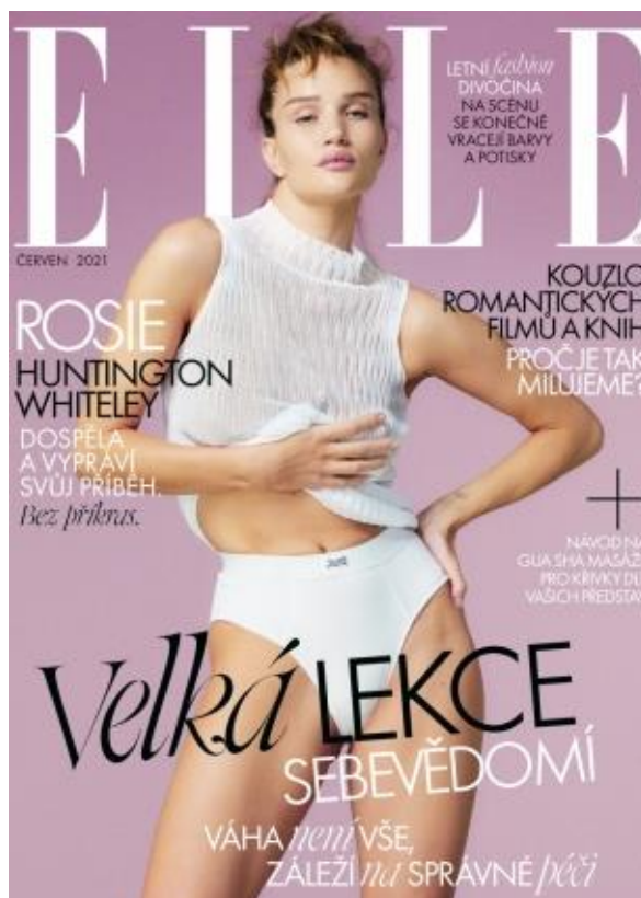
18 Červen 2021