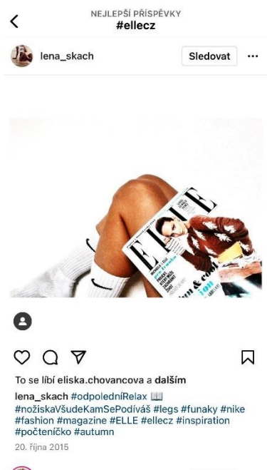
1 ELLE jako doplněk IG účtu (Instagram, [online] 2015, lena_skach)