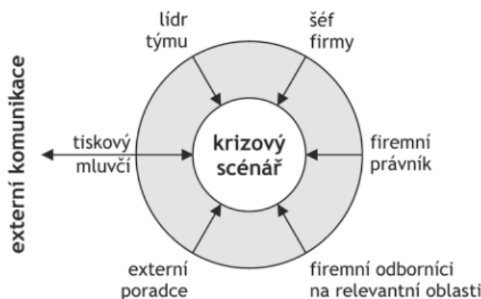
Obr. 3 Krizový komunikační tým. Spojení a dokonalá souhra kompetentních odborníků s jasně rozdělenými úkoly představuje základní předpoklad úspěšného zvládnutí krize.

nejvíce přiblížit potřebám novinářů a aby přitom dokázal obhájit firemní zájmy. Součástí týmu by měl být také šéf firmy, aby svou přítomností demonstroval důležitost celé situace a ztotožnil se s usneseními, které krizový tým schválí. Pro větší efektivitu a pohled zvnějšku je dobré do týmu přizvat i externího poradce (Chalupa, 2012).