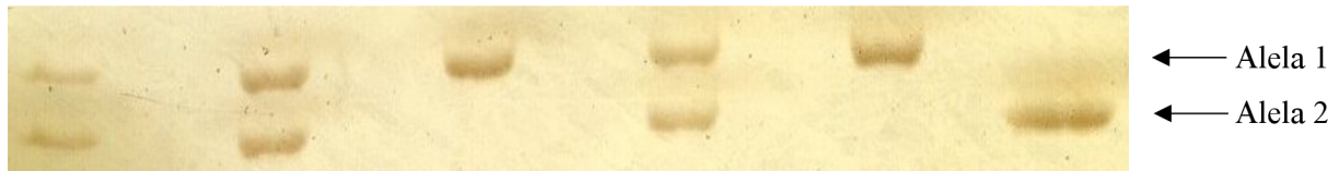
Obrázek č. 4: Příklad dvoualelového mikrosatelitního lokusu Ptero09 amplifikovaného při teplotě annealingu 63 °C. Amplifikace proběhla u 6 nepříbuzných jedinců nesyta afrického během 90 minut. Černé šipky znázorňují Alely 1 a 2.