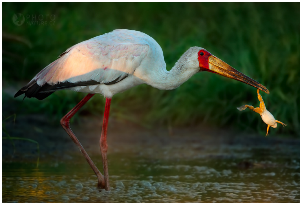
Obrázek č. 2: Nesyt africký při lovu kořisti, foto M. Jirouš (2009).

Nesyti afričtí se řadí mezi stěhovavé čápy. Na jih Afriky přilétají hlavně v říjnu a odlétají v dubnu. Trvale se vyskytují v Zimbabwe, Zambii a dalších tropických oblastech východní Afriky. Migrace tohoto druhu čápa není stále dokonale zdokumentována (Brown et al. , 1993).