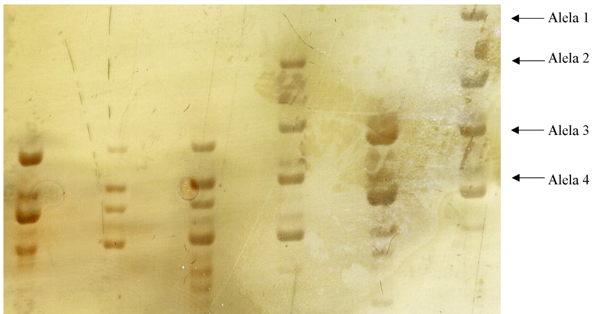
Obrázek č. 6: Čtyřalelový mikrosatelitní lokus Puff G2C separovaný při teplotě 51 °C po dobu 150 minut. Mikrosatelit byl testován u 6 nepříbuzných jedinců nesyta afrického. Šipkami jsou znázorněné Alely 1 až 4.