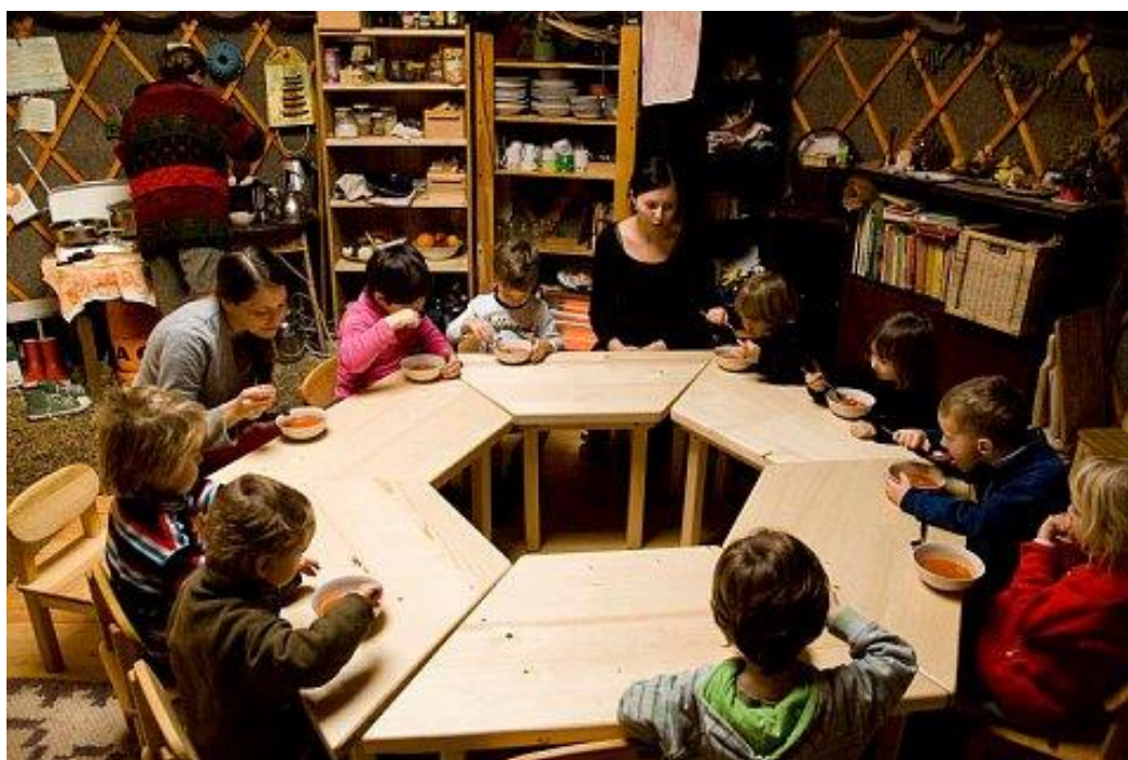
Obrázek 1: Dětský klub Šárynka 24

Nejasnosti právního režimu odrazují provozovatele od zahájení činnosti poskytování služeb péče o předškolní děti. Zároveň nepřináší jistotu rodičům v podobě jasně definované kvality služeb. Na tento stav reagovalo Ministerstvo práce a sociálních věcí ČR připravovaným zákonem o službách péče o děti, kterému se budu věnovat podrobněji v oddíle 3.5.1.