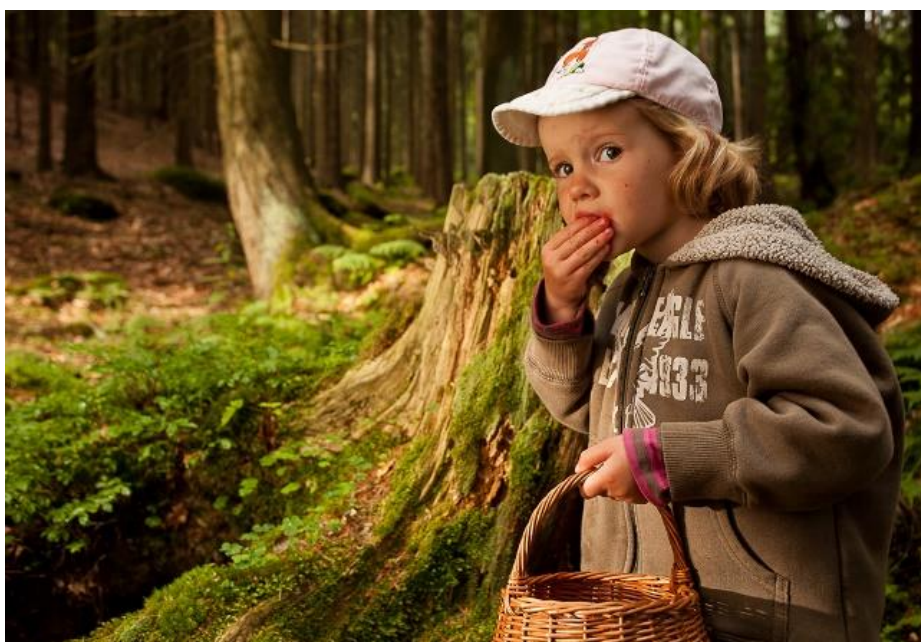
Obrázek 2: Lesní mateřská školka Mezi stromy 27

Cena za umístění dítěte do tohoto typu zařízení se pohybuje do šesti tisíc Kč měsíčně. 26