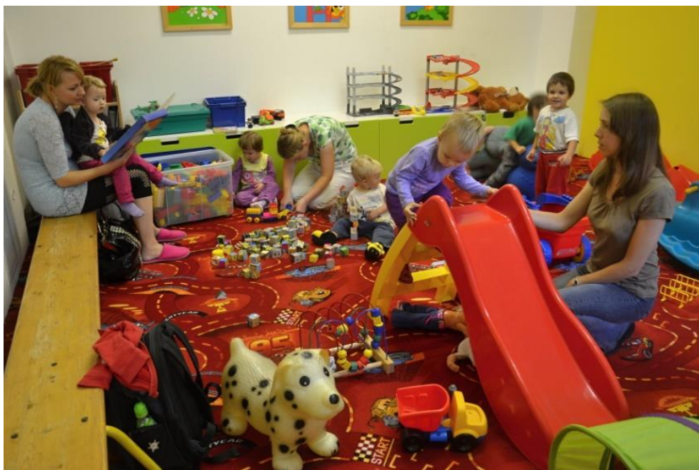
Obrázek 3: Rodinné centrum Provázek v Olomouci 36

Do skupiny předškolních vzdělávacích zařízení obecně platného právního charakteru patří také tzv. „Lesní školky“. V těchto zařízeních děti pobývají za příznivého počasí celý den venku nebo v lese na čerstvém vzduchu. Tato zařízení jsou tak obzvláště vhodná pro děti se zvýšenou nemocností, která pobytem v „Lesních školkách“ klesá.