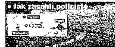
Jak zasáhli policisté

První Mlýnce – Po půlnoci policisté v úterý ráno na louce u Mlýnce v Praze rozehnali účastníky taneční party CzechTek. Účastníci party se začali sjíždět po půlnoci. Na louku u Mlýnce dorazili po jedné hodině ráno.