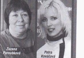
Více o rozvodu na str. 2 a 3

ni dobře spolu plnit řadu společenských povinností. O celé věci byli dosud informováni jen naši nejbližší přátelé a příbuzní. Neviděli jsme důvod informovat zatím o našem rozhodnutí veřejnost; naplali s tím, že jejich rozhodnutí změní až Blesk. Ten už několik dní poukázal na až moc častá setkávání Paroubka s Kováčovou. Čtenářem Blesku