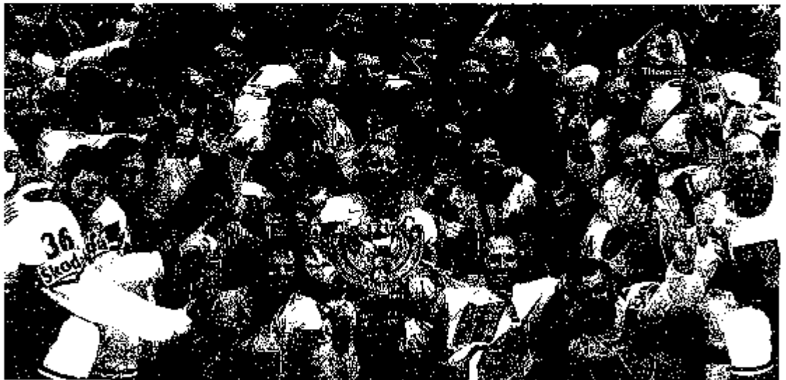
36. Zlatý pohár v rallye, který slaví vítěz z Finska po půl letech soubojů s vítězi. Pohár převzali v úvodu závodu.

DNE DNES Jak shodit 5 kilo za 5 minut Za každou minutu předtím, než 19:00 hod. začne, 1. kolo, 1. kolo představení z... Odkaz v seznamu DNE DNES