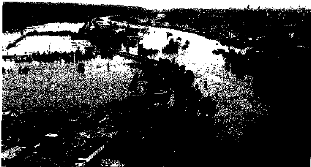
ZBRASLAV POD VODOU. Svatojanský náhon v Zbraslavi. Pohled ze vzduchu zprava

Praha Zalesy pohlcovaly téměř celá Čechy. Desítky tisíc lidí již nemá domov. Přemnoží se louže, záplavy ohrožují životy. Povodně vlní se po celé zemi. V Praze se staly dva případy rabování.