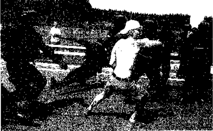
...A ZÁSAH. Policie v úterý ráno na louce u Mlýnce v Praze rozehnala účastníky taneční party CzechTek.