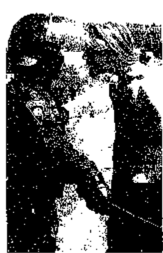
VYDRÁVÁNÍ... Policie v úterý ráno na louce u Mlýnce v Praze rozehnala účastníky taneční party CzechTek.

Účastníci party se začali sjíždět po půlnoci. Na louku u Mlýnce dorazili po jedné hodině ráno. Účastníci party se začali sjíždět po půlnoci. Na louku u Mlýnce dorazili po jedné hodině ráno.