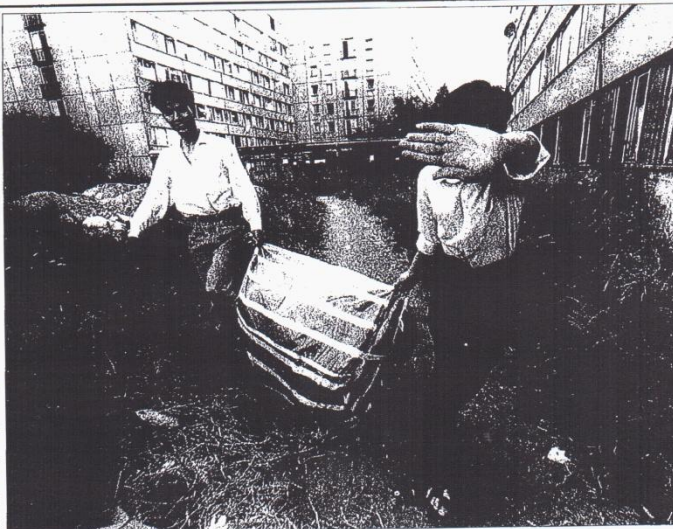
Dva vietnamskí obchodníci nesou tašku se zbožím k ubytovně Košík

Jechoutek uvedl, že Slavia již má obdoby splátkový kalendář dohodnut s vodárenskými a tepleňskými, jimž také dluží peníze. RADEK PECÁK