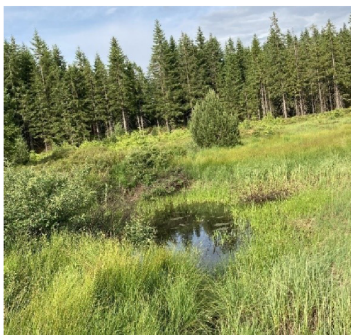
Obr. 2 – rašeliniště v prostorech bývalého cínového dolu Rolava v Krušných horách

Rašelina se na rašeliništích získává z důvodu výroby zahradní rašeliny. Tento způsob výroby patří mezi významné antropogenní zákroky. Rašeliniště je odvodněno, vegetace se odstraní a silná vrstva půdy se sklídí (Salonen 1987; Price 1996). Odhaduje se, že 0,3 % rozlohy České republiky pokrývají rašeliniště (Spitzer et al. 1999), z toho největší zásoby rašeliny se nacházejí na Třeboňsku, kde je 30 % celostátních zásob uloženo v padesáti rašeliništích (Matouš 1988). Slatinná a přechodová rašeliniště se vyskytují po celém území České republiky od nejnižších poloh až po subalpínský stupeň (Hájek & Rybníček 2010; Chytrý et al. 2010).