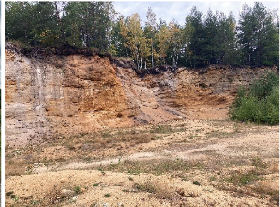
Obr. 8 - bývalá pískovna Erika

Těžebny jílu poskytují biotopy pro širokou škálu ptačích druhů s různými nároky na prostředí. Některé druhy ptáků těží z těžebních aktivit, například z hnízdních možností v budovách v těžebních prostorech. I tyto lokality jsou důležitým stanovištěm pro břehule říční ( Riparia riparia ) (spolu s pískovnami a uhelnými doly) (Krása & Matějů 2009). Těžebny jílu slouží také jako loviště a hnízdiště pro skupinu vlaštovkovitých ptáků a rorýsů obecných ( Apus apus ). Otevřená stanoviště kolonizují převážně kulík říční ( Charadrius dubius ) a skřivan lesní ( Lullula arborea ). V oblastech ruderalní vegetace se vyskytuje bramborníček hnědý ( Saxiola rubetra ), koroptev polní ( Perdix perdix ), křepelka polní ( Coturnix coturnix ) a ůhýk obecný ( Lanius collurio ). Druhy, které hnízdí v okolních lesích jsou: krahujec obecný ( Accipiter nisus ) a krkavec velký ( Corvus corax ). A z náletových lesů jsou to: včelojed lesní ( Pernis apivorus ), žluna zelená ( Picus viridis ) a žluna hajní ( Oriolus oriolus ), uvádí Řehounek et al. (2010).