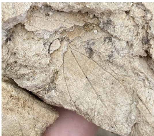
Obr. 1 – detail třetihorní zkameněliny z pískovny Erika

Vytěžené pískovny bývají většinou zalesňovány, v případě větších lomů slouží jako nové místo k vytvoření vodní plochy. Například v okrese Nymburk zaujímají lomová jezera přes 50 % celkové rozlohy všech vytěžených pískoven. Při těžbě štěrkopísku je ovlivněn i reliéf, dochází k urychlení erozních procesů, což komplikuje případnou rekultivaci. V místech pískoven je vegetace bohatá na nepůvodní druhy flóry, například na březích to nejčastěji bývá zlatobýl kanadský ( Solidago canadensis ) (Matějček 2005).