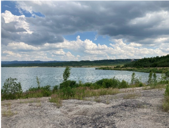
Obr. 7- jezero Medard, vlastní foto