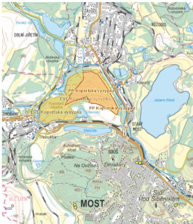
Obr. 4 – vytyčení Kopistské výsypky podle: https://drusop.nature.cz/ost/chrobjekty/evl/index.php?pageposevl=25&SELECT_ID_USE_FILTERevl=&SELECT_ID_CHECK_ALLevl=&EXPORT_ALL_step=&ORDER_BYevl=v1.nazev

minimalizací těžké techniky. Kopistská výsypka je unikátním příkladem rekultivace důlní krajiny, která se stala důležitým biotopem pro ohrožené druhy obojživelníků. Kromě chráněných obojživelníků se na výsypce vyskytuje i řada dalších rostlinných a živočišných druhů. Je to cenná lokalita pro studium rekultivačních procesů a biodiverzity v dříve zdevastovaných oblastech (Melichar et al. 2019).