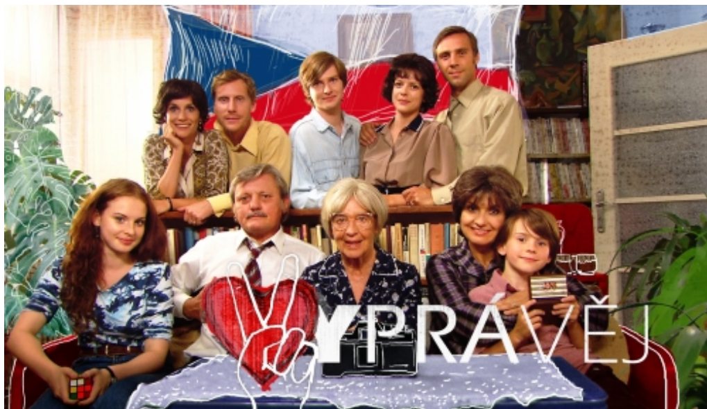
Obrázek 15: Úvodní fotografie IV. řady seriálu