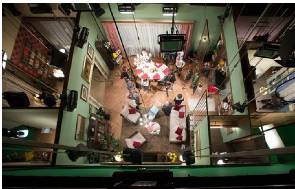
Obrázek 8: Fotografie dekorace studia Vyprávěj