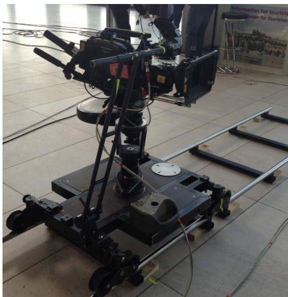
Obrázek 6: Camera dolly na kolejnicích

podle výbavy. Kolejnice se skládají buď z rovných dílů, nebo oblouků, celý kruh je pak tvořen osmi díly. Všechny typy kolejnic se do sebe upevňují pomocí spojek.