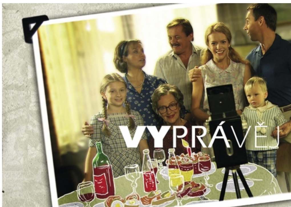
Obrázek 12: Úvodní fotografie I. řady seriálu