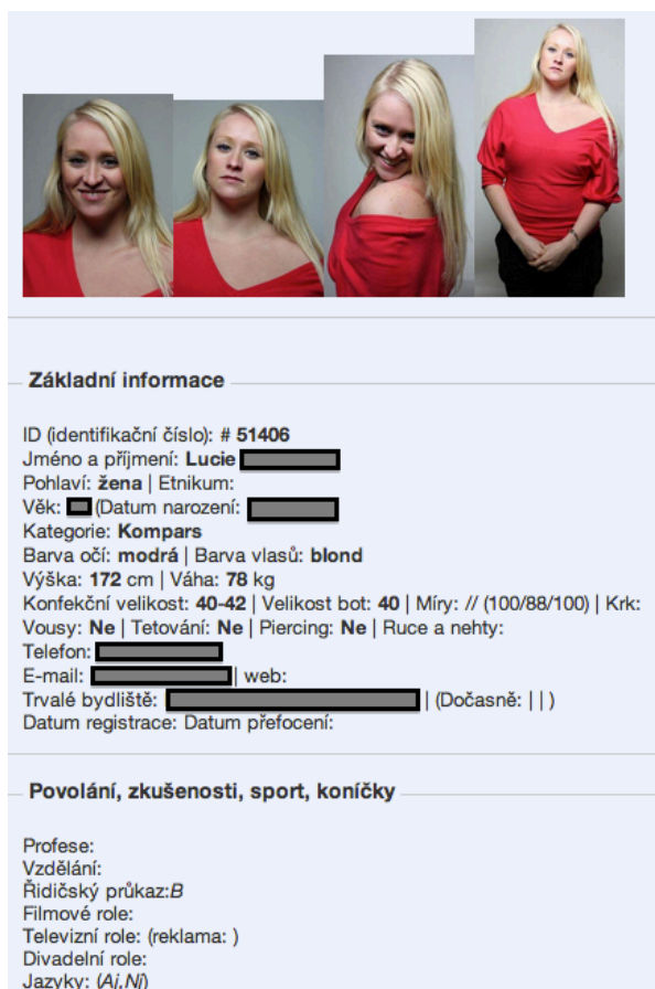
Obrázek 9: Ukázka set – karty v databázi castingové agentury