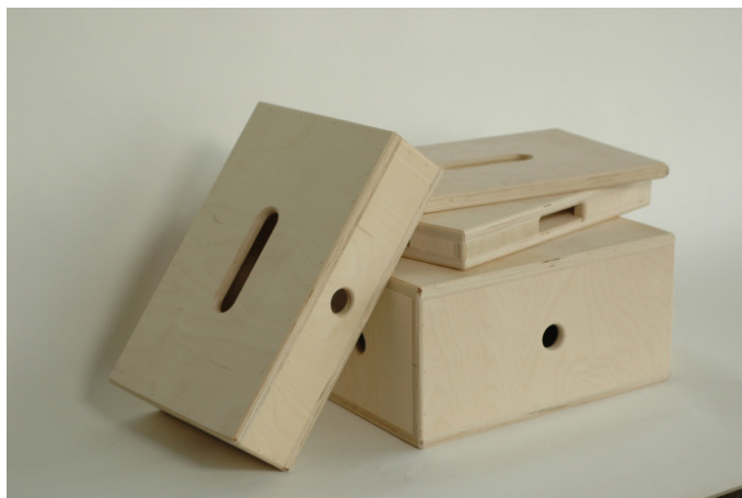
Obrázek 7: Apple box