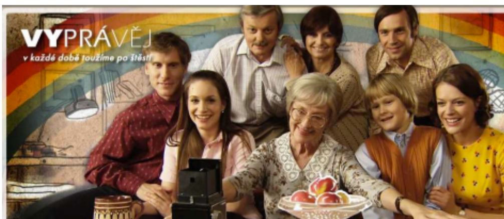
Obrázek 13: Úvodní fotografie II. řady seriálu