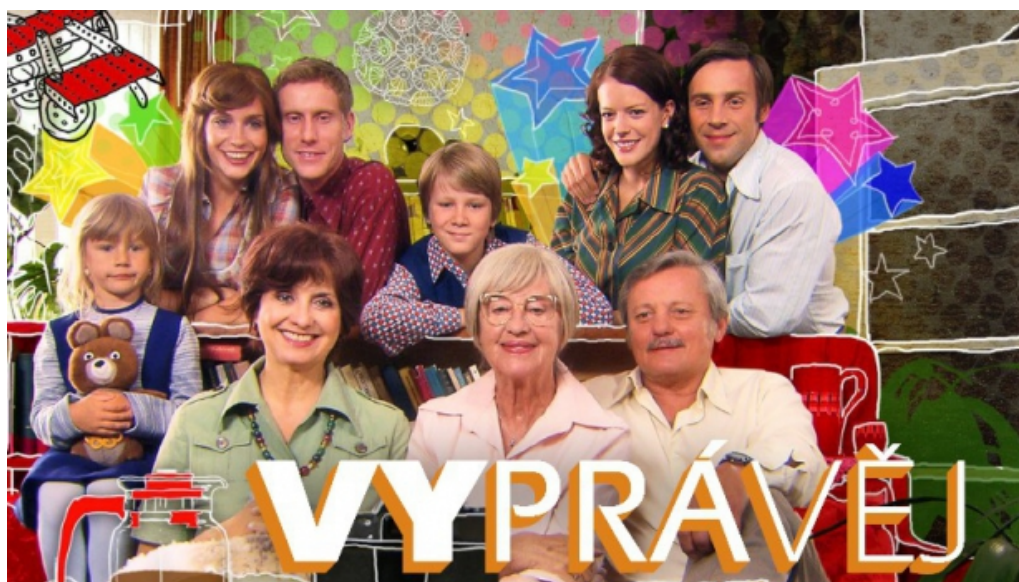
Obrázek 14: Úvodní fotografie III. řady seriálu