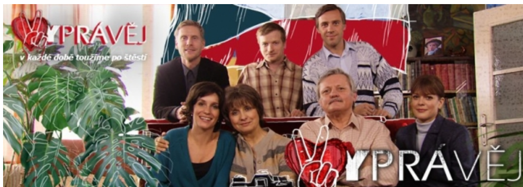
Obrázek 16: Úvodní fotografie V. řady seriálu