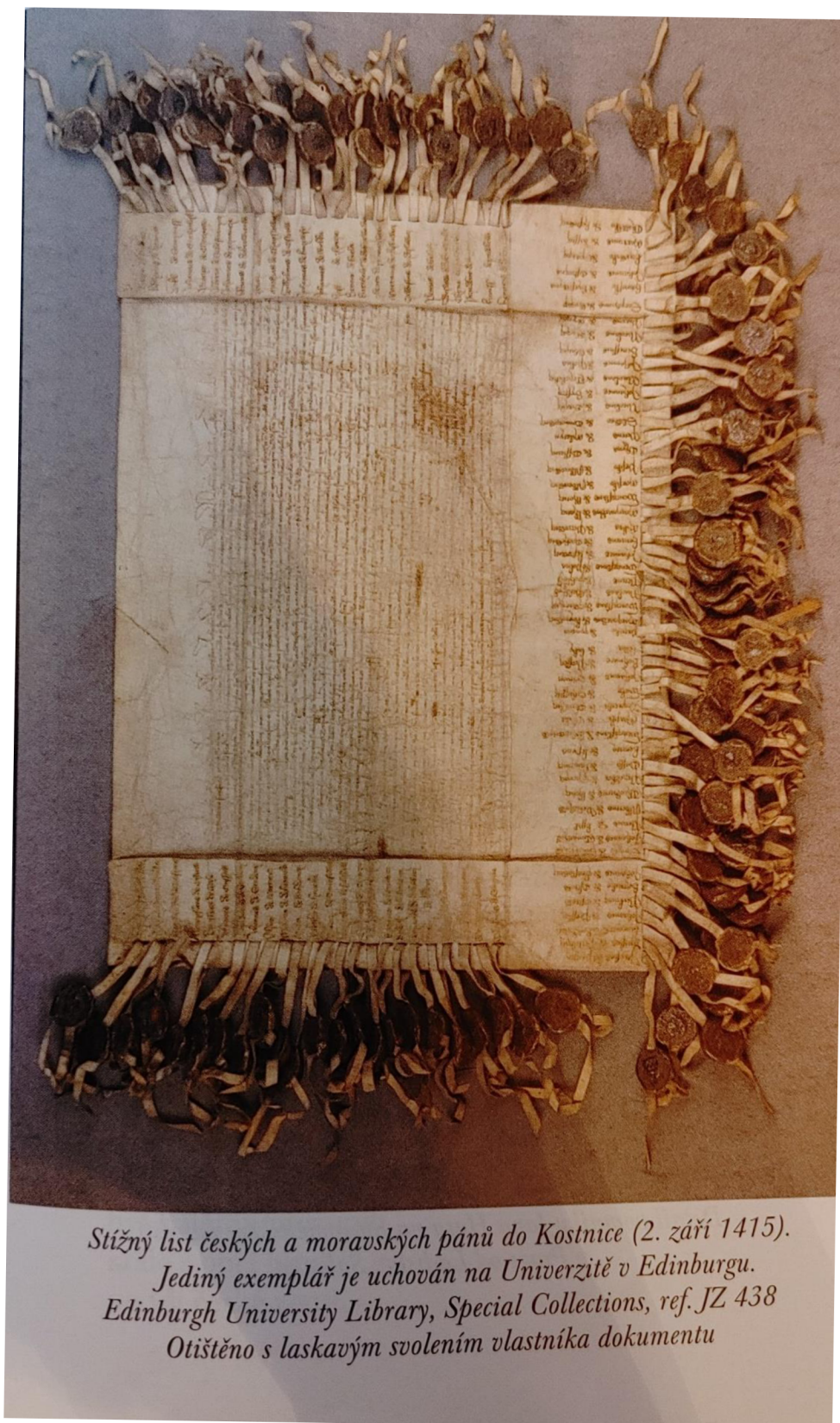
Obrázek č. 11