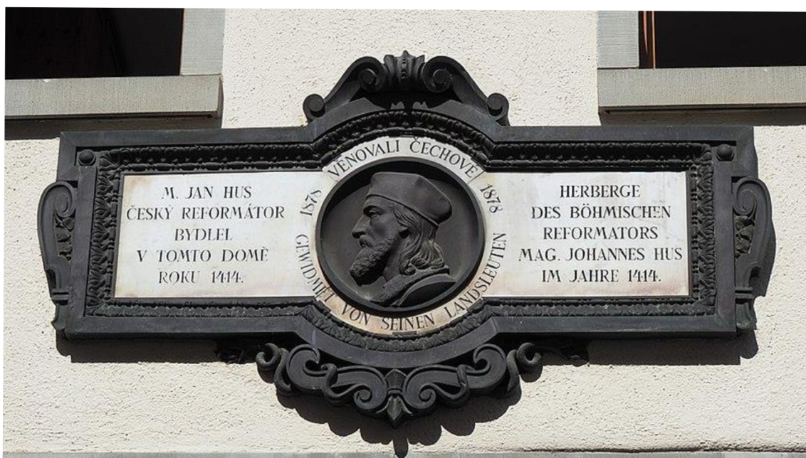
Obrázek č. 7