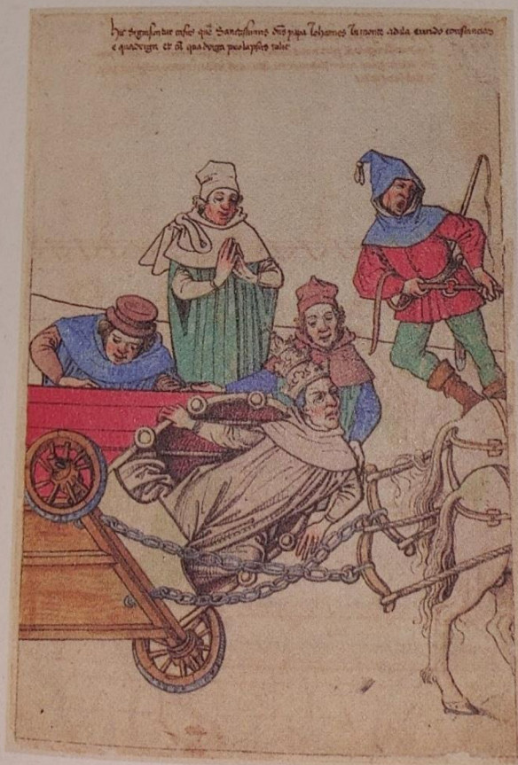
I. Převržený vůz s papežem Janem XXIII. při cestě do Kostnice.