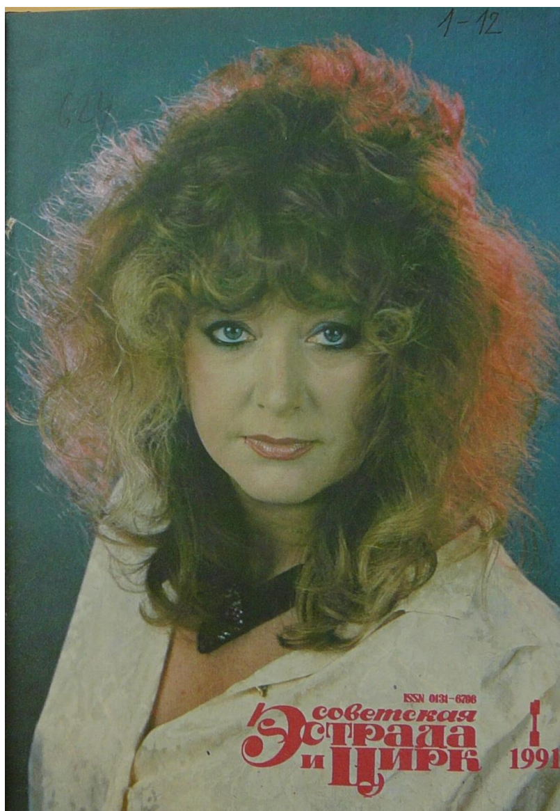
Obr. B: Obálka časopisu se zpěvačkou Allou Pugačovovou