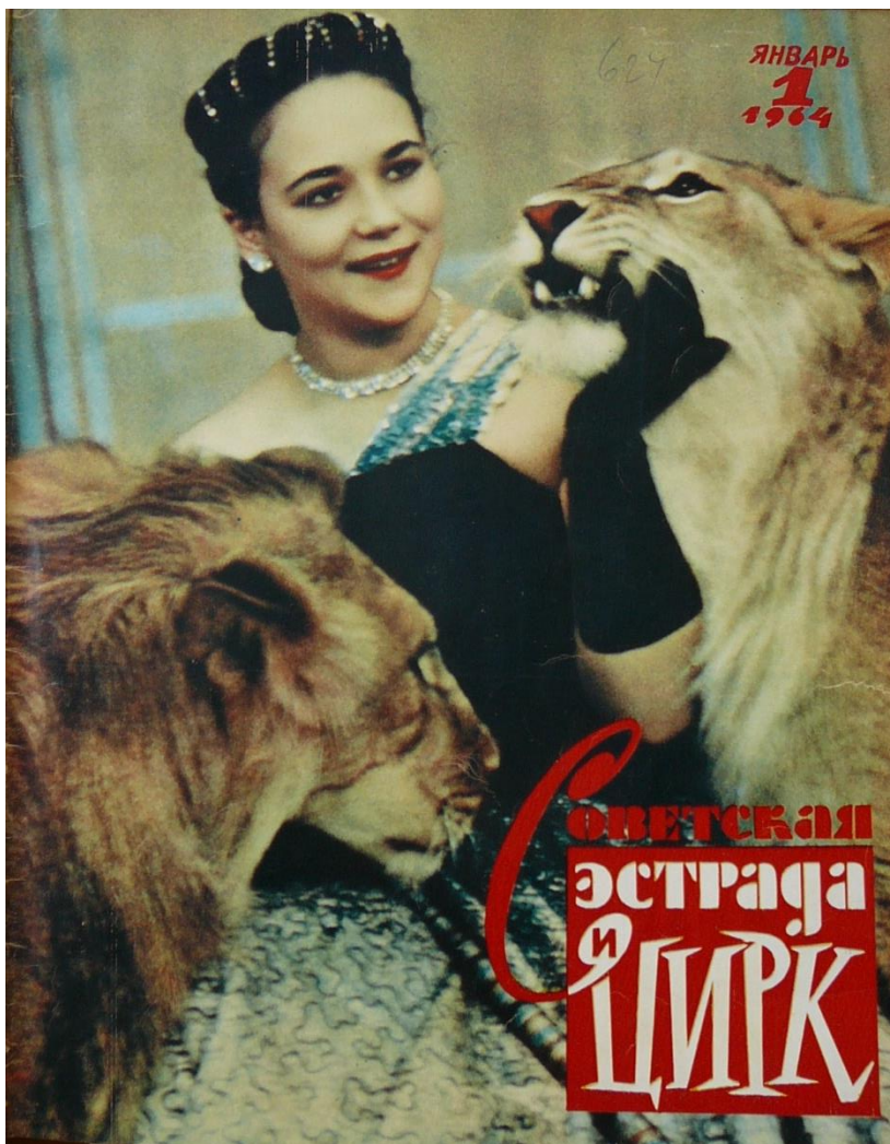
Обр. А: Обálка часопісу ад фотэграфá Е. Савалова

Zdroj: Sovetskaja estrada i cirk. Moskva: Iskusstvo, 1964, roč. VIII, č. 1.