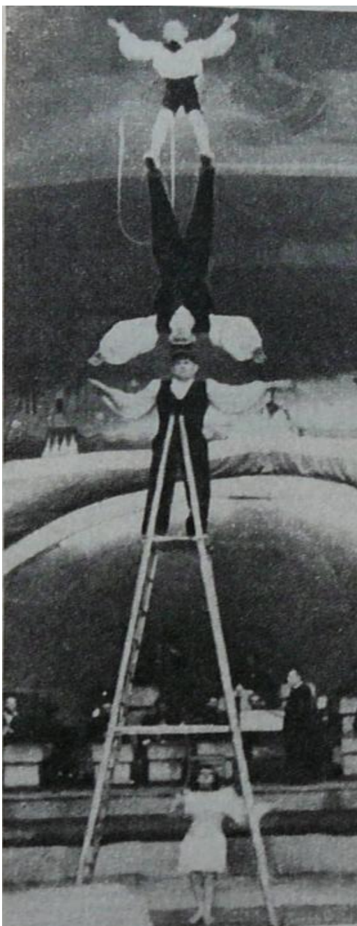
Obr. C: Rekordní představení