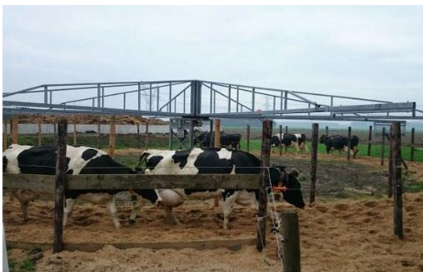
Obrázek č. 12: Cvičení skotu (dr.ir. W. Ouweltjes)

Ouweltjes (2015) ve svém projektu používal kolotoč pro koně, kde krávy chodily dvakrát denně po dobu 45 minut. Rychlost chůze byla přizpůsobena lehkému tempu krav, a to 3,4 km/h. Během pokusu byly krávy důkladně sledovány, aby se zjistil rozdíl mezi oběma skupinami. Zaznamenávala se individuální produkce mléka a příjem krmiva a každý týden se odebíraly vzorky krve pro sledování metabolismu. Chování krav bylo zaznamenáváno senzory, které měřily vzorce aktivity. Byla sledována srdeční frekvence, a to jak v klidu, tak při cvičení, aby bylo možné měřit fyzickou kondici. U všech krav se každý týden hodnotila pohyblivost a prokrvení dolních končetin.