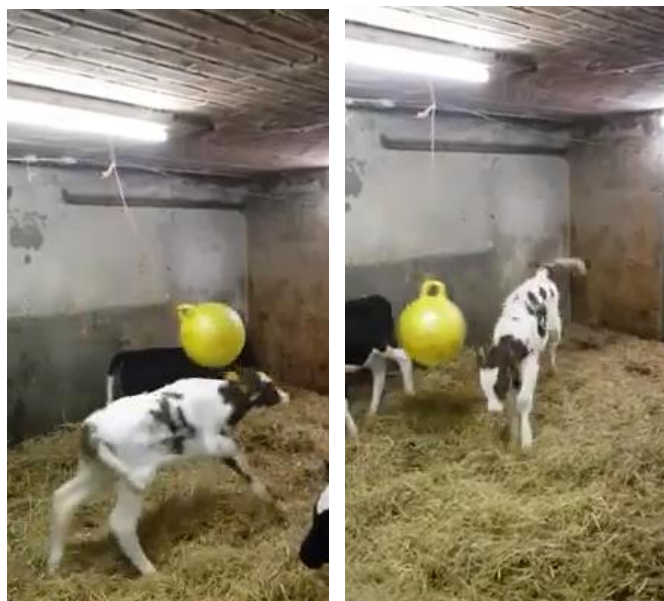
Obrázek č. 9 a č. 10: Tele hrající si s míčem (Ing. Matuš Gašparík, Ph.D.)