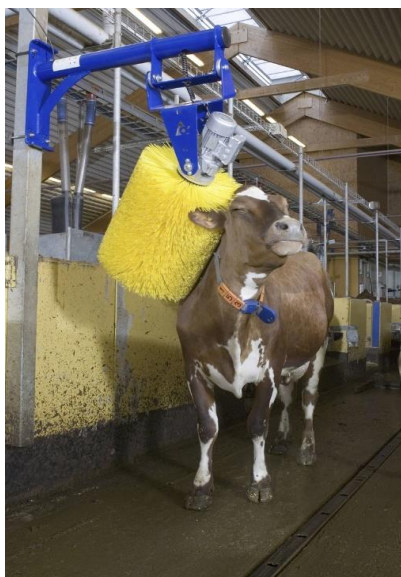
Obrázek č. 5: Automatické drbadlo

a významný rozdíl ve výskytu mastitid, jakmile byly nainstalovány mechanické kartáče. Rozdíl se zvětšoval s rostoucím počtem laktací. Důvodem snížení případů mastitid v kotcích s kartáči může být hypotéza, že krávy, které jsou aktivnější a více chodí, leží kratší dobu ve stájích, čímž se méně vystavují bakteriím na povrchu stáje. Také péče o krávy může vést k celkově čistší kůži u zvířat s přístupem ke kartáčům. Ačkoli samotná mléčná žláza nebude při použití kartáče čištěna, ocas a zadní partie budou čištěny, což může vést k nižší expozici mléčné žlázy kvůli obecnému snížení nečistot na těle krávy. Ve dvou kotcích se zvířaty z první laktace nebyl pozorován žádný rozdíl v mastitidě (Schukken & Young 2010).