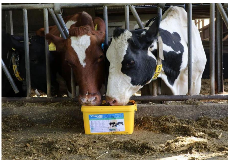
Obrázek č. 7: Krávy olizující doplněk stravy (Vitacube)

Obrázek č. 7 znázorňuje krávy olizující doplněk stravy.