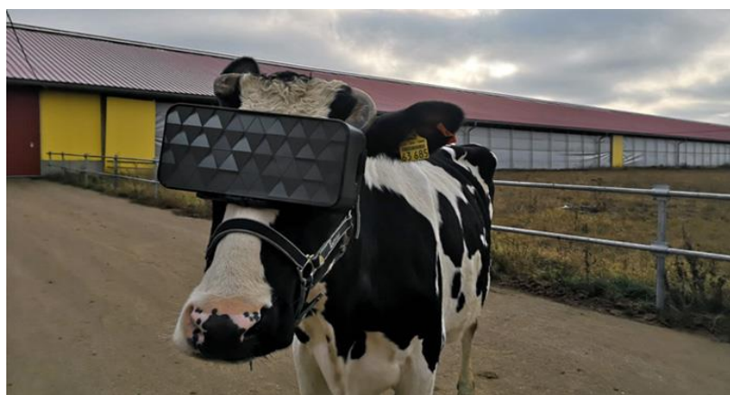
Obrázek č.11: Virtuální realita

Během prvního testování odborníci zaznamenali snížení úzkosti a zvýšení celkové emoční nálady stáda. Vliv VR brýlí na mléčnou užitkovost krav ukáže až další komplexní studie. Pokud pozitivní dynamika pozorování zůstane zachována, hodlají tvůrci projekt rozšířit a modernizovat domácí mlékárenskou výrobu. (Ministerstvo zemědělství Moskevské oblasti 2019). Otázkou zůstává, jak bude kráva schopná orientovat se ve svém fyzickém prostoru bez toho, aby ho viděla, jak bude reagovat na virtuální podněty bez jejich fyzické přítomnosti (požírání pastvy), a jak bude reagovat na oddělení od známého stáda. Na obrázku č. 11 vidíme krávu s brýlemi na virtuální realitu.