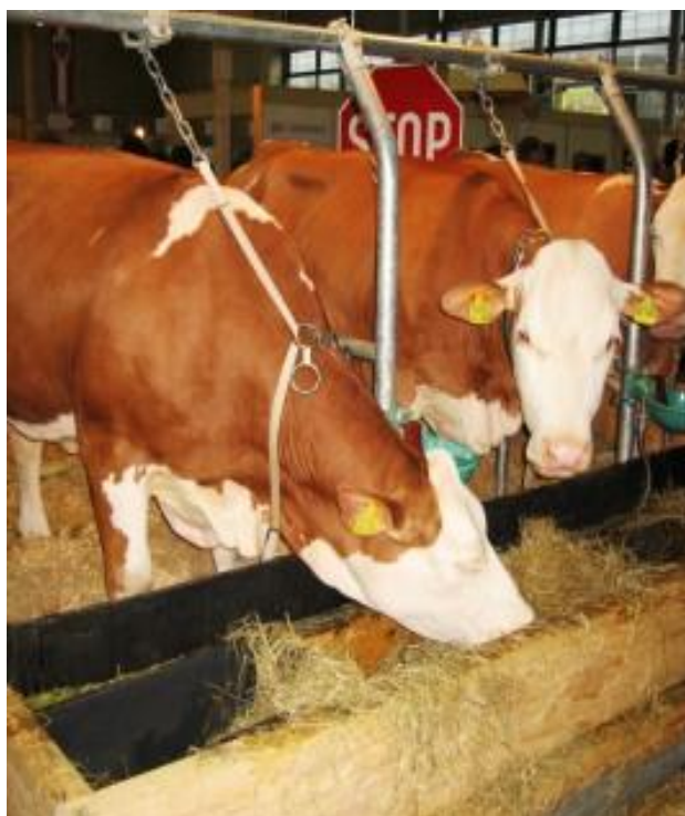
Obrázek č. 3: Vazné ustájení skotu (Staněk Standa)

Vazné boxové ustájení znázorňuje obrázek č. 3.