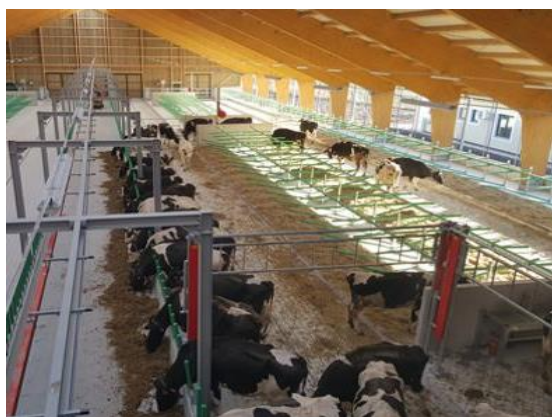
Obrázek č. 1: Volné stelivové ustájení (Dostál Dalibor)

Na rozdíl od vazného typu ustájení vykazuje volné ustájení lepší výsledky zdravotního stavu končetin a čistoty dojnic, mezi další výhody patří dobrá plodnost a minimální poškození struků a vemen (Macháček 2015).