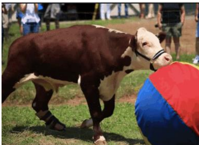
Obrázek č.8: Kráva hrající si s míčem (Joan M Siegel)