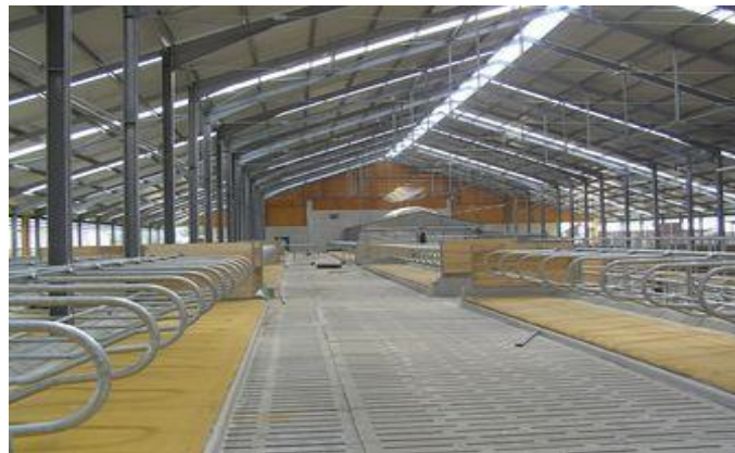
Obrázek č. 2: Volné bezstelivové ustájení (KUSÝ s.r.o.)