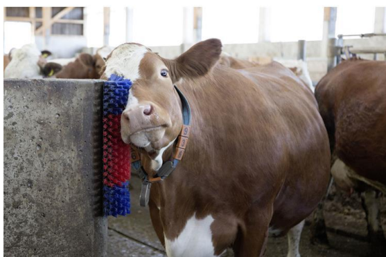
Obrázek č. 6: Mechanické drbadlo (ALM centrum)