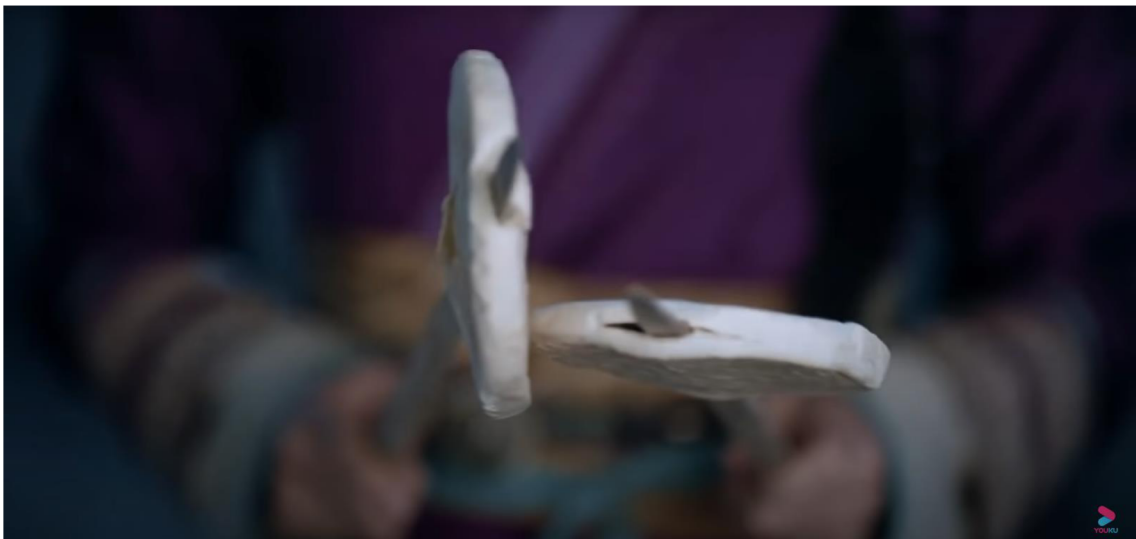
Obrázek 9: Dotýkající se placky

Na konci druhého dílu v čase 43:33, kdy spolu Wen Kexing a Zhou Zishu bojují, Gu Xiang (顾湘) opodál nad ohněm opéká tzv. shaobing (烧饼), což je druh pečené placky. Během toho, co se spolu hlavní postavy perou, je záběr na Gu Xiang, která jakoby imituje jejich pohyby. Na Obrázku 9 je vidět, jak do sebe placky naráží. Mezi fanynkami je tato scéna spojována s výrazem tie shaobing (贴烧饼), 90 který v jednom ze čtyř klasických čínských románů – Hong lou meng (红楼梦; angl. Dream of the Red Chamber; Sen v červeném domě) odkazuje na homosexuální sex. Bývá tak brána jako připomínka toho, že se jedná o adaptaci danmei románu. 91