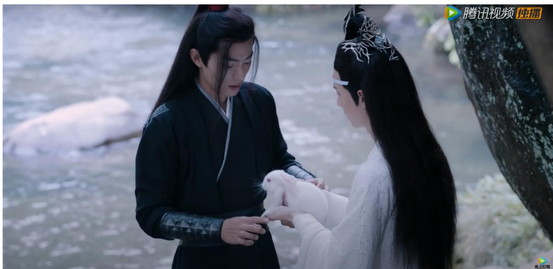
Obrázek 6: Lan Wangji podávající králíčka Wei Wuxianovi