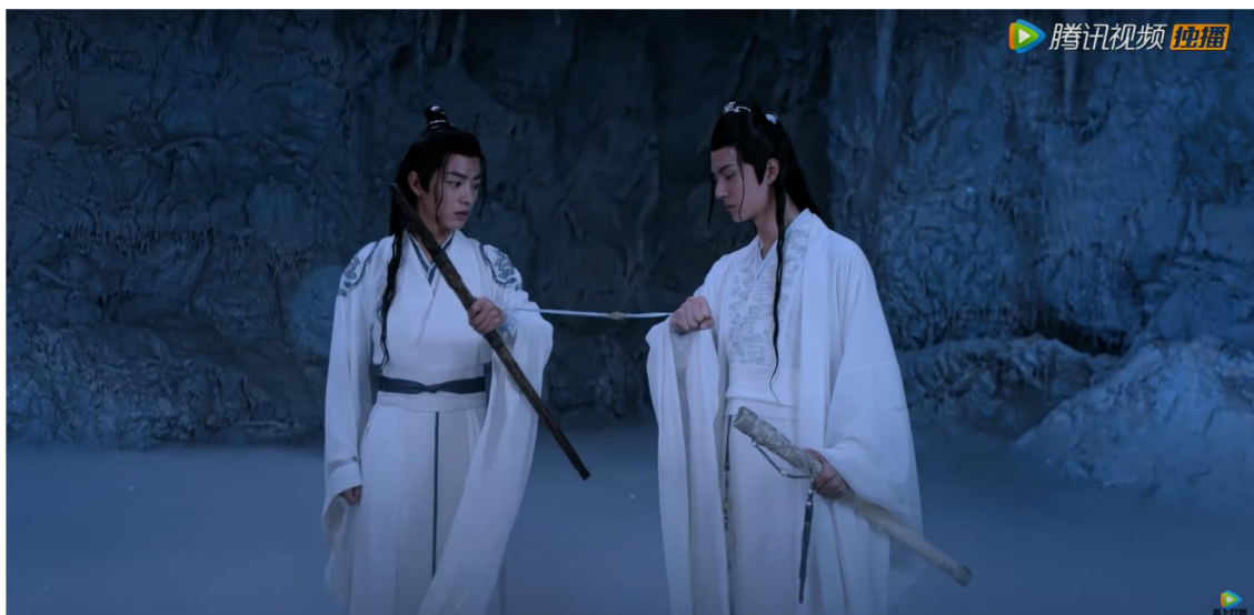
Obrázek 4: Lan Wangji a Wei Wuxian svázání pomocí stuhy