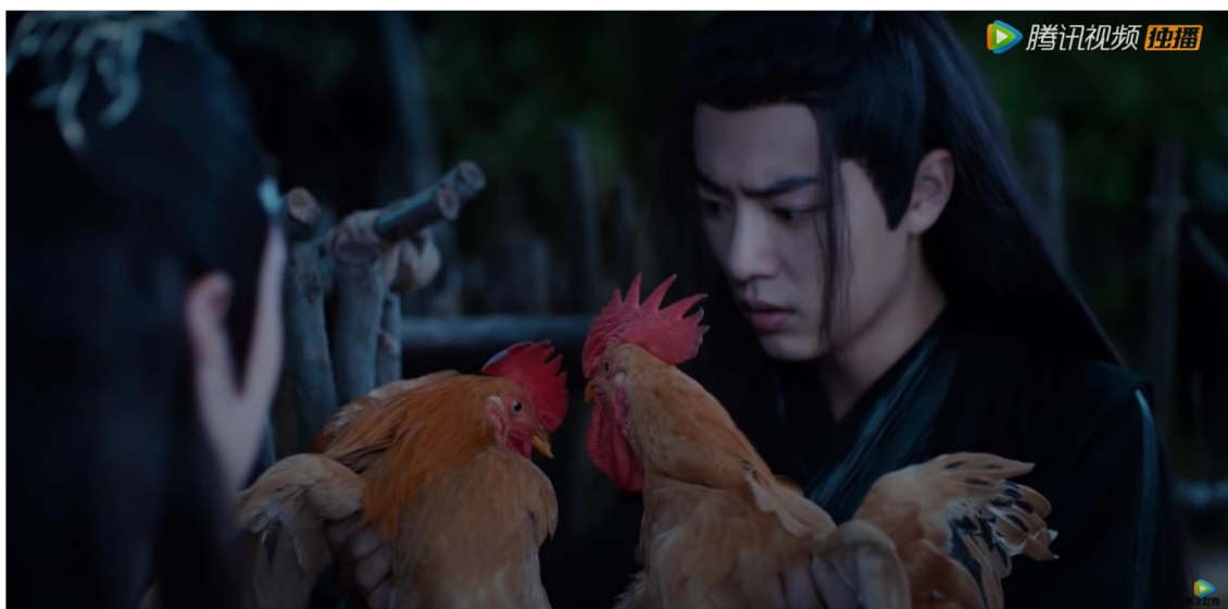
Obrázek 7: Zmatený Wei Wuxian se slepicemi

(腾讯视频 Tencent Video. The Untamed EP36, YouTube.)