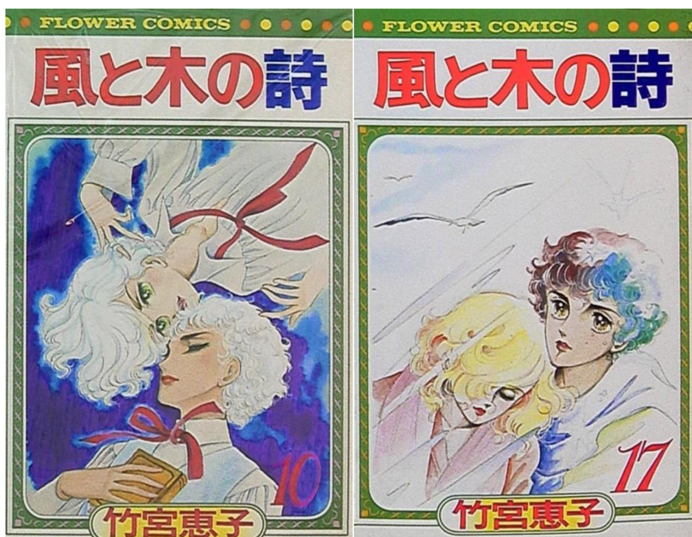
(KEIKO, Takemiya. Kaze to Ki no Uta .)