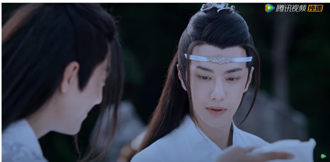
Obrázek 5: Úsměv na tváři Lan Wangjiho