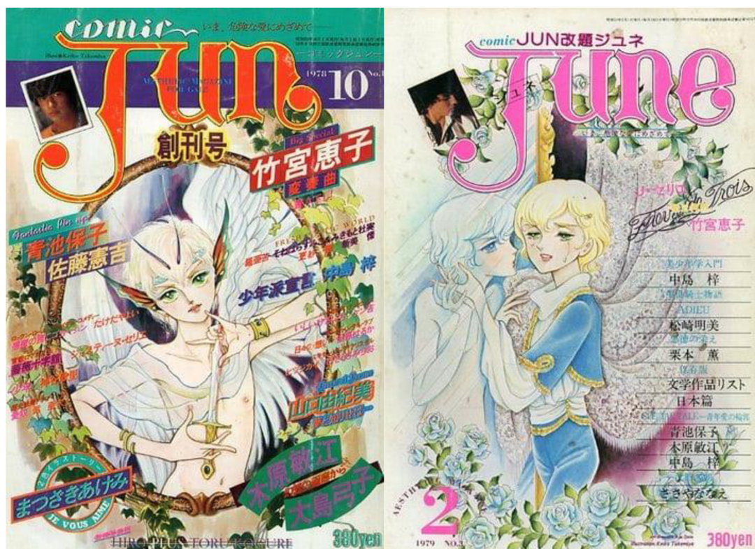
(Comic Jun., June.)

Na konci osmdesátých let se homoerotické příběhy začaly objevovat ve značné míře i v nezávisle vydávaných často amatérských doujinshi (同人誌; „fanfikce“), avšak mladé autorky již neměly chuť publikovat v June. Jednak z toho důvodu, že z velké části vydával amatérská díla za nepatrný honorář, jednak proto, že byl ochotný vydávat pouze