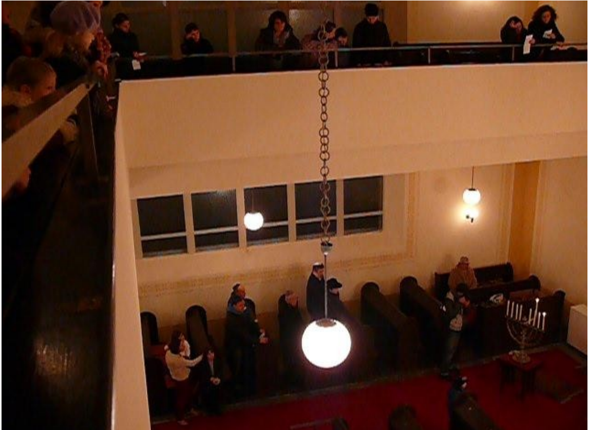
Autorka: pí. Dagmar Juráňová