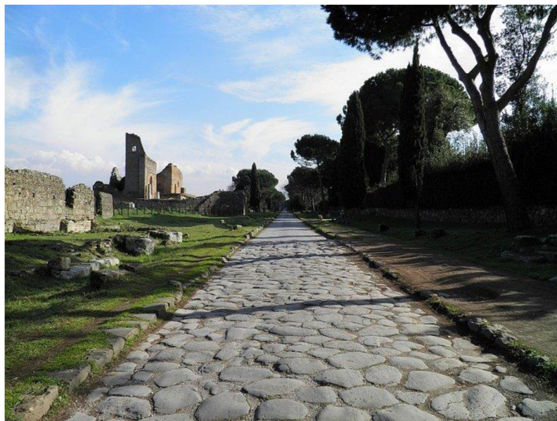
Obr. č. 1: Via Appia, autor fotografie: Carole Raddato Zdroj: www.worldhistory.org

milníky, které informovaly pocestné o vzdálenosti do konkrétních míst, podél cest pak byly budovány i poštovní stanice a zájezdní hostince (Martínek et al. 2014).