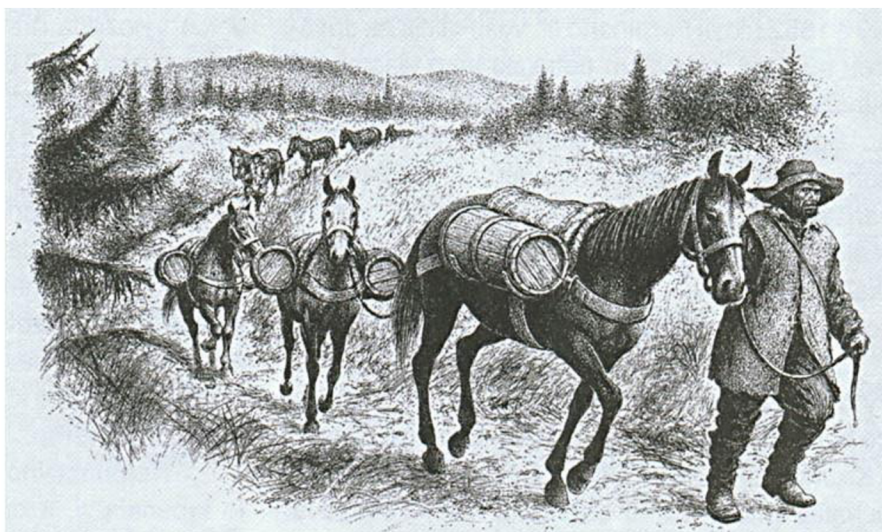
Obr. č. 3: Soumarská karavana. Podle J. Andresky 1994, kresba J. Petráček.

vyvinula dvě hlavní nocoviště – Waldkirchen v Německu a Volary v Čechách (Fuchs et al. 2014).