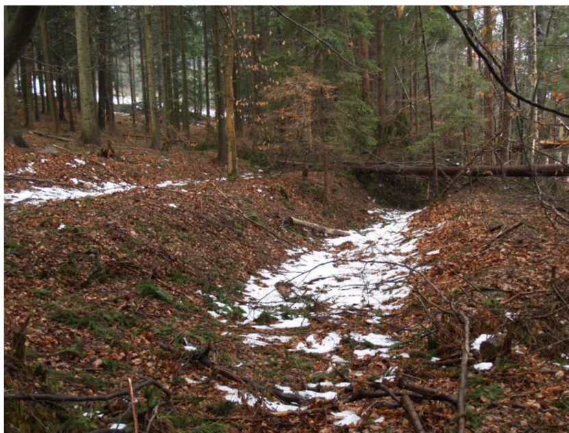
Obr. č. 4: Pozůstatky prachatického systému Zlaté stezky ležící ve spodní části údolí Fefrovského potoka mezi městem Prachatice a starou soumarskou osadou Libínské Sedlo. Stezka se zde zachovala v podobě dvou samostatných systémů úvozových cest.

na jejich základě je vyslán speciální letoun k provedení laserového skenování. Výsledkem je výškový model území. Těto metody se využívá především v lesním prostředí.