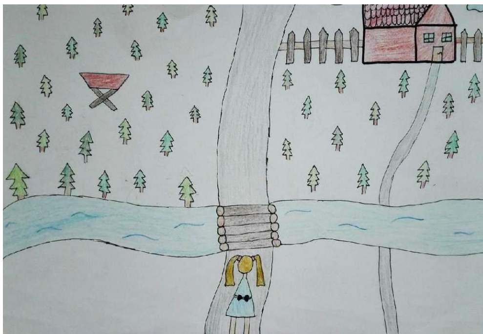
Obrázek č. 13: Alenka v říši divů (Linda, 12 let)