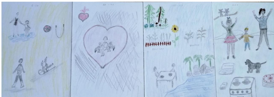
Obrázek č. 4: Leporelo zážitků ze 4 životních etap (Jolana)

Navrhla jsem Jolaně, aby ještě obrázek vybarvila a vybuodovala tam ještě prostor. Jolana domalovala moře a některé postavy se pokusila usadit do krajiny.