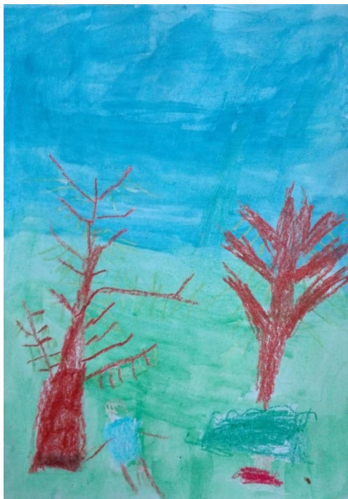
Obrázek č. 8: Alenka v říši divů (Mirek, 9 let)

Vzhledem k rozsahu práce jsem v této části vytvořila pouze soubor výtvarných artefaktů dětí a dospělých, které jsem zkoumala z hlediska užité symboliky.