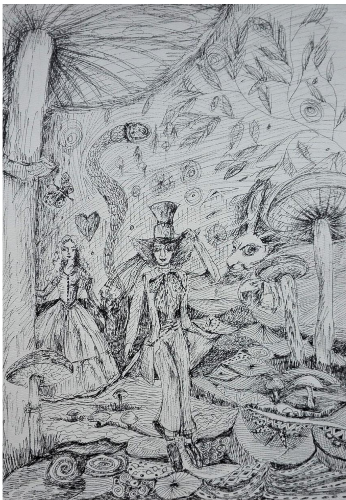
Obrázek č. 16: Alenka v říši divů (Marta, 75 let)

Autorka obr. 15 využila vícero motivů z pohádky, jako jsou houby, králík, motýl, had. Had by mohl být zástupcem draka v pohádce.