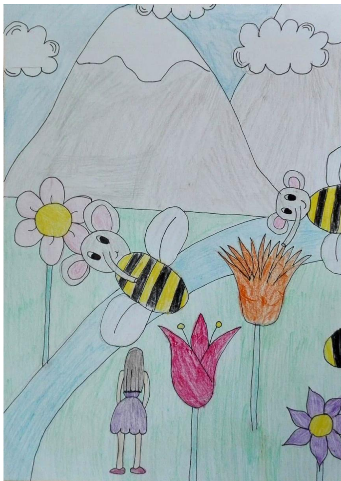
Obrázek č. 10: Alenka v říši divů (Simona, 12 let)