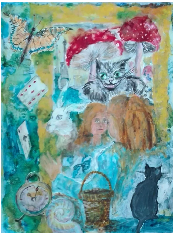
Obrázek č. 15: Alenka v říši divů (Jitka, 67 let)