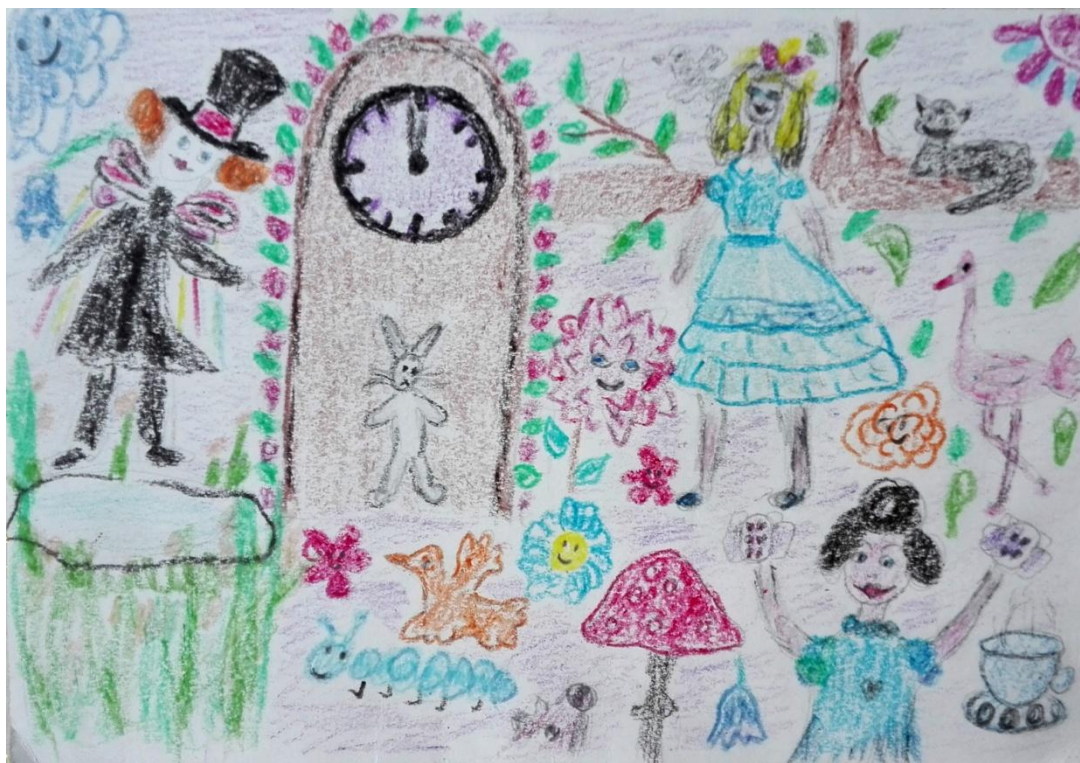
Obrázek č. 3: Alenka v říši divů (Jolana)

Nepřehlédnutelný je v tomto obrázku hnědý „falický“ sloup s fialovými hodinami, připomínající také náhrobek, který stojí mezi Alenkou a Kloboučníkem. Uvažuji o možném regresu do falického období, které souvisí také s určitou nepropojeností výjevů s prostorem. Kombinace hnědě a fialové barvy tohoto symbolu ve mně rozehrává hru myšlenek nad souvislostmi s rolí rodičů v autorčině životě, případně jejím vlastním rodičovstvím.