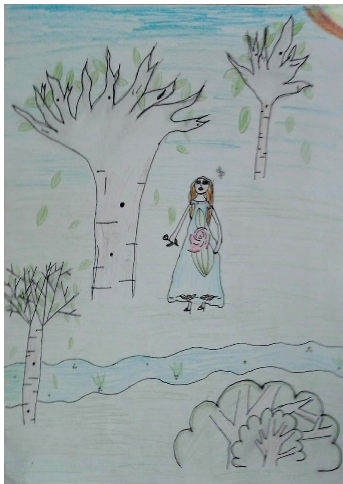
Obrázek č. 11: Alenka v říši divů (Zuzana, 11 let)