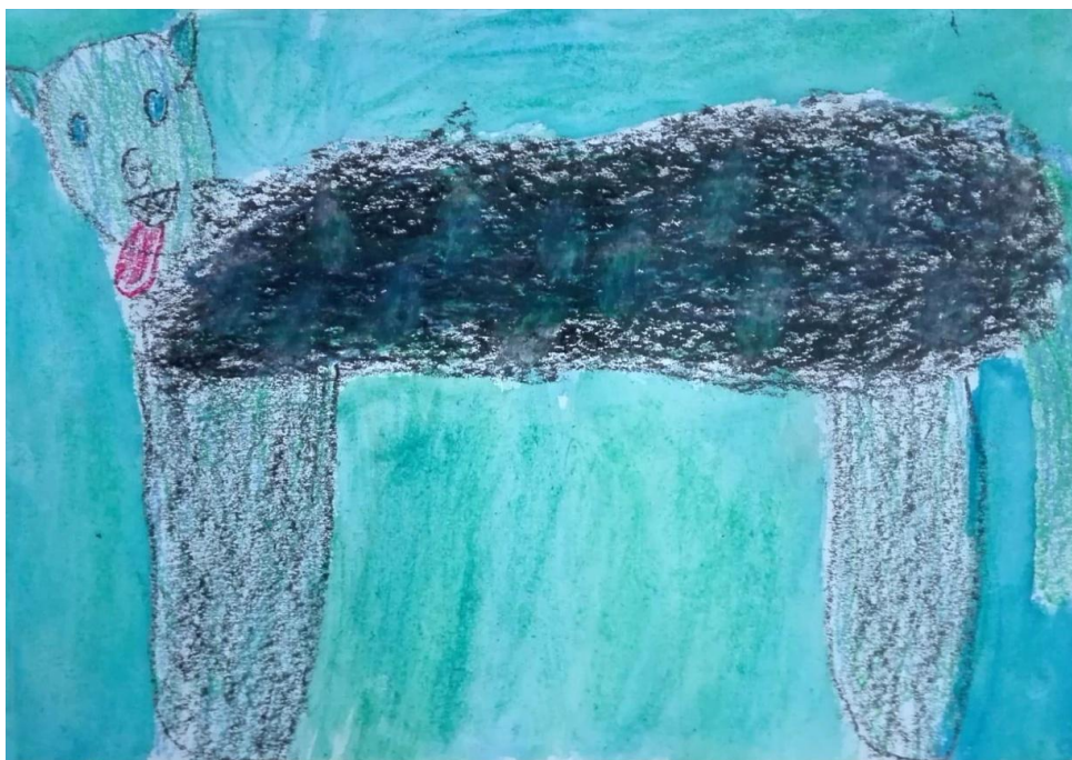
Obrázek č. 6: Alenka v říši divů (Matěj, 8 let)