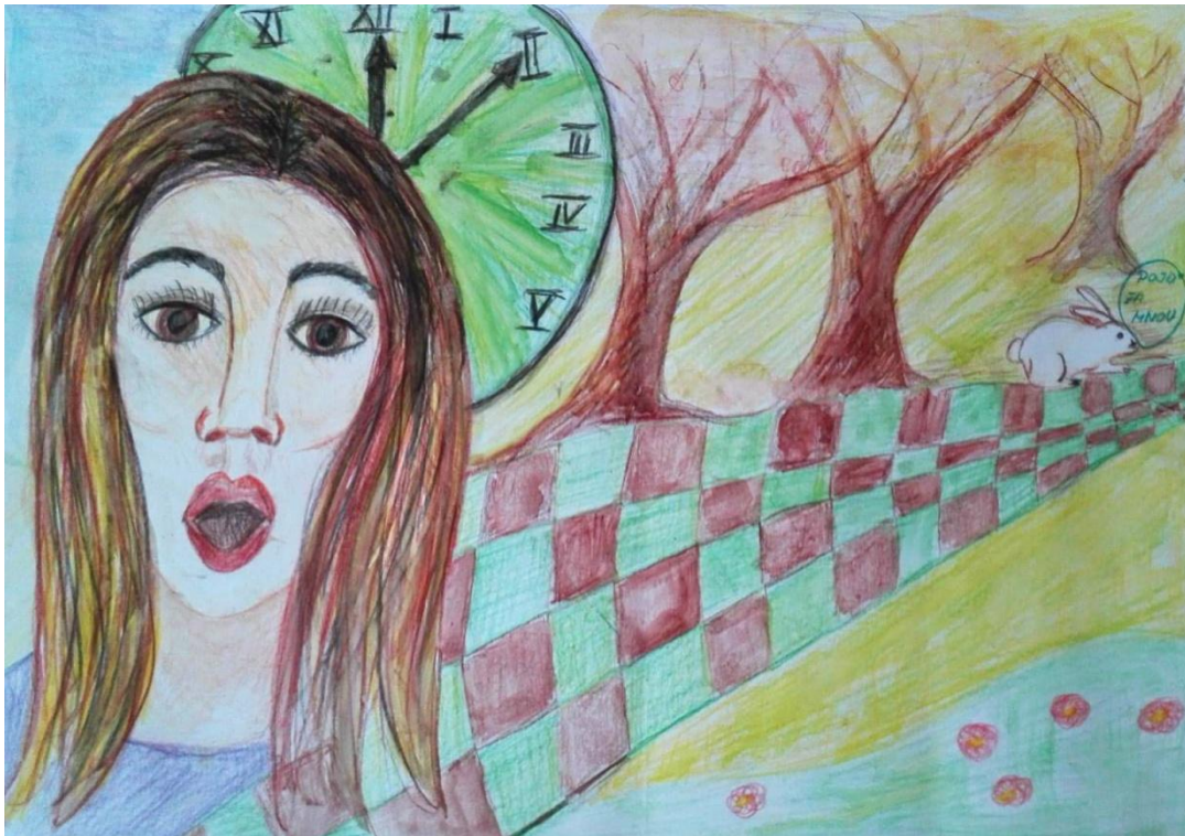
Obrázek č. 1: Alenka v říši divů (Helena)

Otcovská úhlopříčka nás vede od obličeje postavy, přes cestu, až ke králíčkovi, který říká „Pojď za mnou“. Králík jako symbol instinktu pobízí autorku, ať jde. Cesta postavu částečně překrývá. "Přerůstá" snad něco autorku? V kombinaci hnědé a světle zelené bychom mohli hledat závislost na původní rodině. Volba barevnosti cesty může rovněž odkazovat k mladší mužské postavě. Mohly bychom se ptát, jaký má autorka vztah se svým synem? Postava na artefaktu má na sobě fialový oděv. Fialová je barva mateřská, empatická, mohla by nás v kombinaci s nezralou zelenou vést k zamyšlení nad dvojím věkem" ve smyslu mateřství versus dětství, a v kombinaci s hnědou barvou k hledání norem, zakořeněnosti ve vlastním životě. Cestu obklopuje jedovatě žlutá barva. Napadá mě opět spojitost s racionalitou a potřebou.