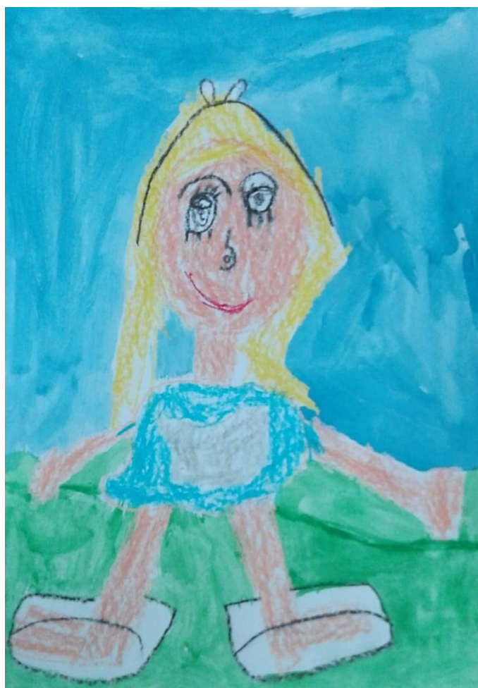
Obrázek č. 9: Alenka v říši divů (Fanda, 7 let)