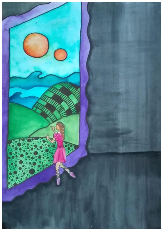
Obrázek č. 12: Alenka v říši divů (Olga, 15 let)