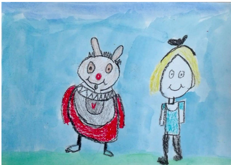
Obrázek č. 7: Alenka v říši divů (Vláda, 8 let)