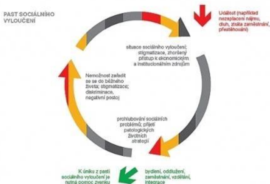
Obr. 2: Past sociálního vyloučení (Švec, 2010)

Situaci z hlediska sociálního vyloučení v České republice je věnována další podkapitola práce.