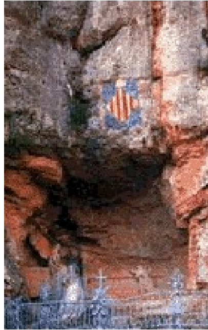
Fig. 1. El Primer Misterio de Gloria del Rosario monumental de Montserrat con el visible escudo catalán