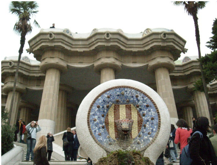
Fig. 8. La Sala Hipóstila del Parc Güell con el emblema catalán detrás de la cabeza de la serpiente