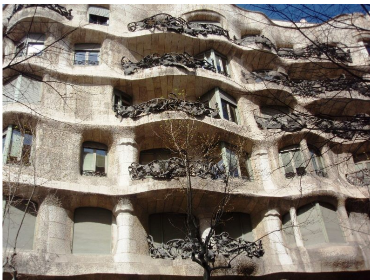
Fig. 10. Detalle de la fachada de la Casa Milà