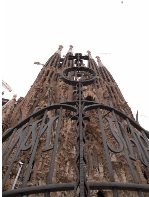
Fig. 11. Sagrada Familia