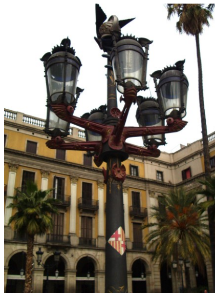
Fig. 2. Farolas en la Plaça Reial (Plaza Real) con el visible símbolo catalán en la columna