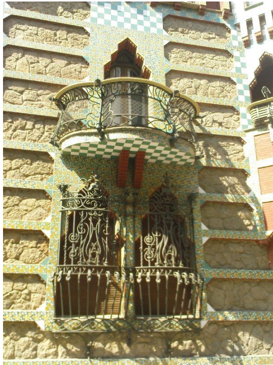
Fig. 5. Detalle de la fachada de la Casa Vicens

Recurso: La foto adquirida de la colección propia de autora.