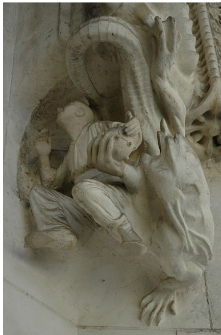
Fig. 12. La bomba de Orsini en la fachada de la Sagrada Familia