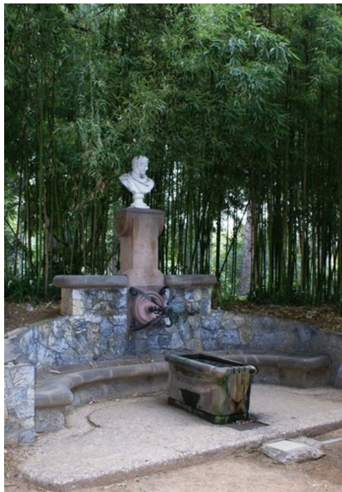
Fig.4. Font d'Hercules (Fuente de Hercules) con el escudo catalán al contenidor