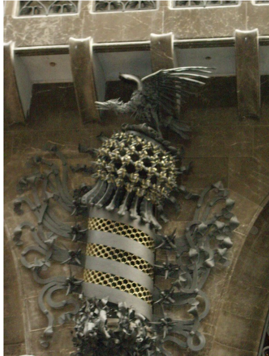
Fig. 7. El escudo catalán en la obra herrera entre las puertas del Palau Güell (Palacio Güell)