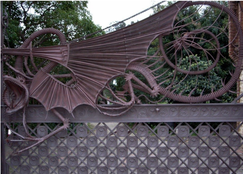
Fig. 6. La puerta de la Finca de los Pabellones Güell