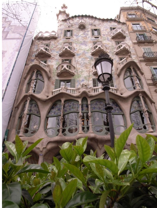
Fig. 9. Casa Batlló