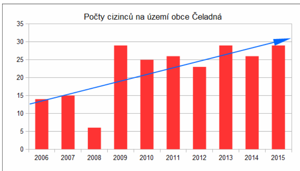
Graf č. 1 Cizinci v regionu

Z údajů Ministerstva vnitra České republiky, které eviduje mimo jiné i počty cizinců žijících také v obci Čeladná, je zcela patrný narůstající trend v počtu cizinců žijících na území obce. Je proto předpoklad, že se počet cizinců žijících v Čeladné bude i nadále zvyšovat.