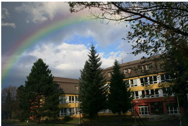
Obrázek č.1: Současná podoba budovy ZŠ Čeladná, p.o. 44

Nová budova základní školy byla vybudována v dolní části obce. Základní kámen byl položen v prosinci 1974 a k slavnostnímu otevření došlo v roce 1979. Samostatným právním subjektem se škola stala v lednu 2003. 43