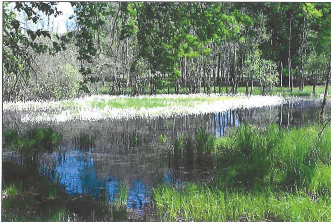
Obrázek 2: Rybník v jarních měsících

schopna zadržovat dostatek vody. V žádosti o poskytnutí finančního příspěvku byl jako zásadní problém uváděn nízký vodní sloupec v rybníku způsobený nánosy na dně, stav rybníka v jarních měsících je zobrazen na obrázku 2 níže. Dalším důležitým důvodem pro rekonstrukci byl špatný technický stav hráze a výpustného zařízení.