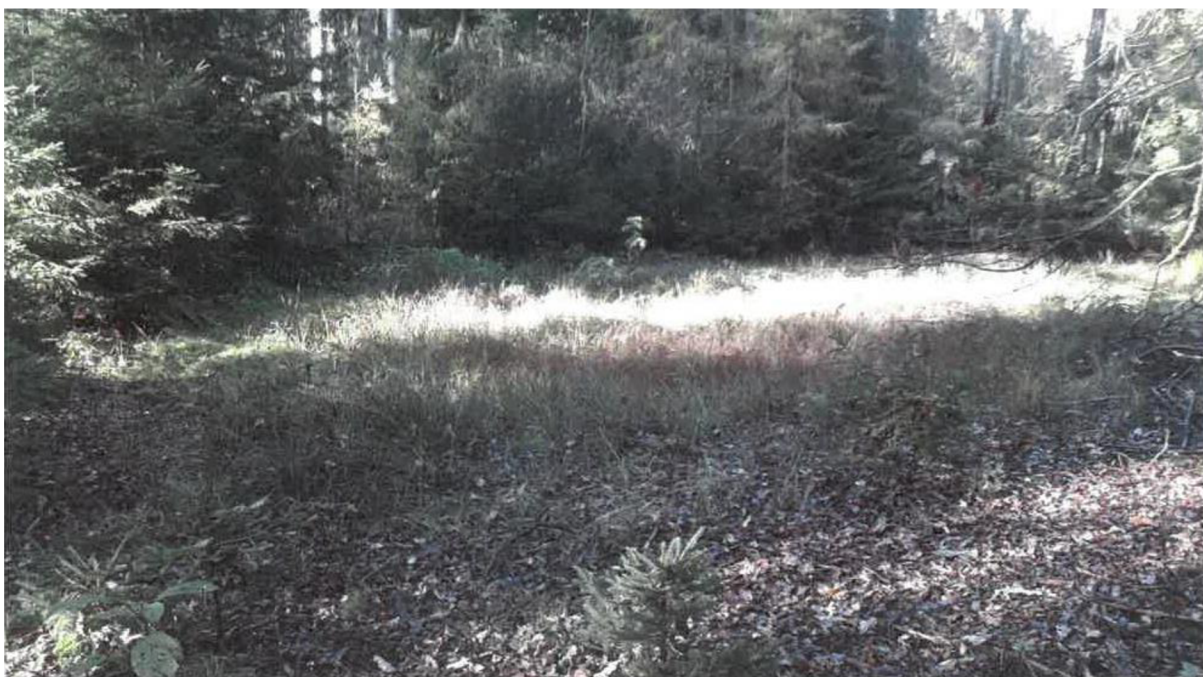
Obrázek 4: Oblast zazemněné tůně před obnovou (foto: Protokol o posouzení žádosti, 2020)