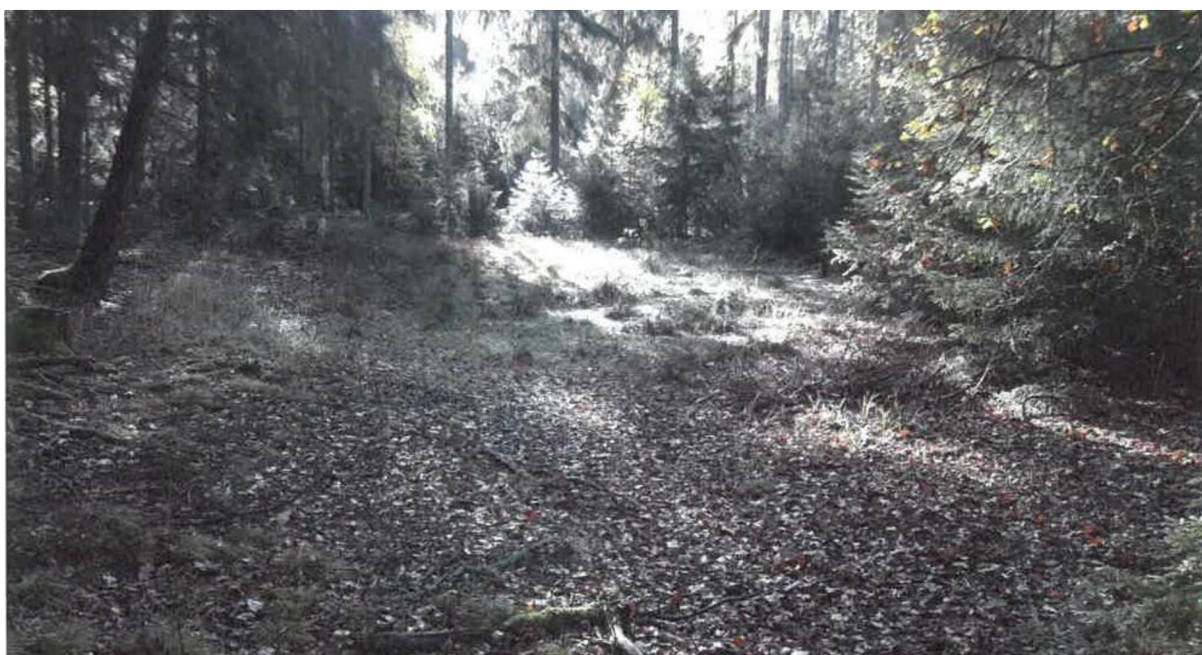
Obrázek 3: Oblast zazemněné tůně před obnovou

Na základě výběrového řízení byla pro zhotovení projektu vybrána firma GREENMAN, s. r. o., která cenu stanovila na 42 035 Kč, dotace byla přidělena na celou obnovu tůně. Projekt byl realizován za tři měsíce a 31. května 2021 byla odevzdána dokumentace k závěrečnému vyhodnocení.