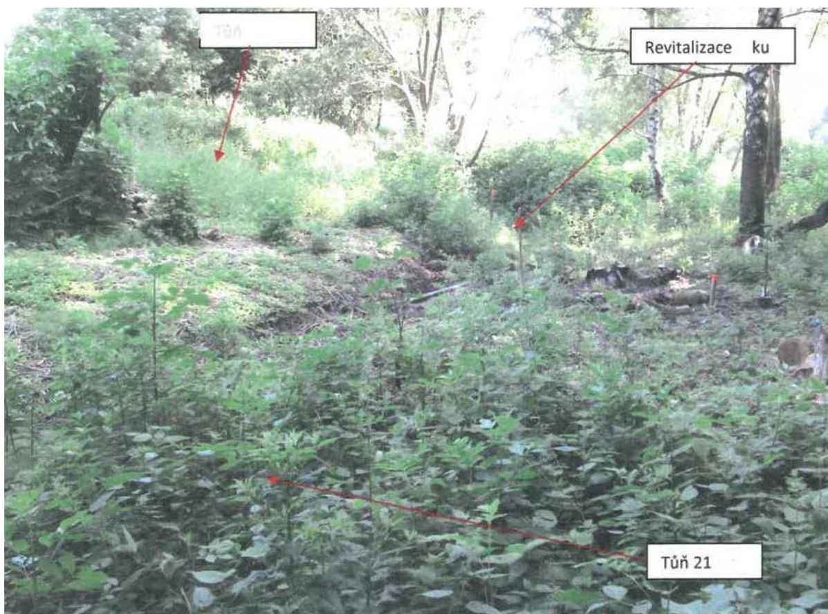
Obrázek 5: Tůně před revitalizací

Projekt byl dokončen, dokumentace k vyhodnocení záměru byla schválena 31. října 2020, stav tůní i toku je možné pozorovat na obrázku 5, na obrázku 6 je vidět tok již revitalizovaný, upravený v rámci estetického dojmu z krajiny.