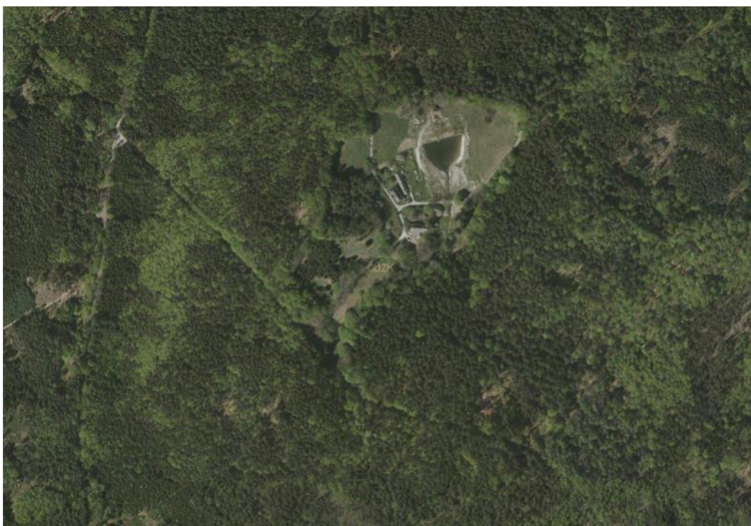
Obrázek 7: Letecký pohled na území, kde byla vodní nádrž budována

Vyhodnocení projektu proběhlo 30. června 2020.