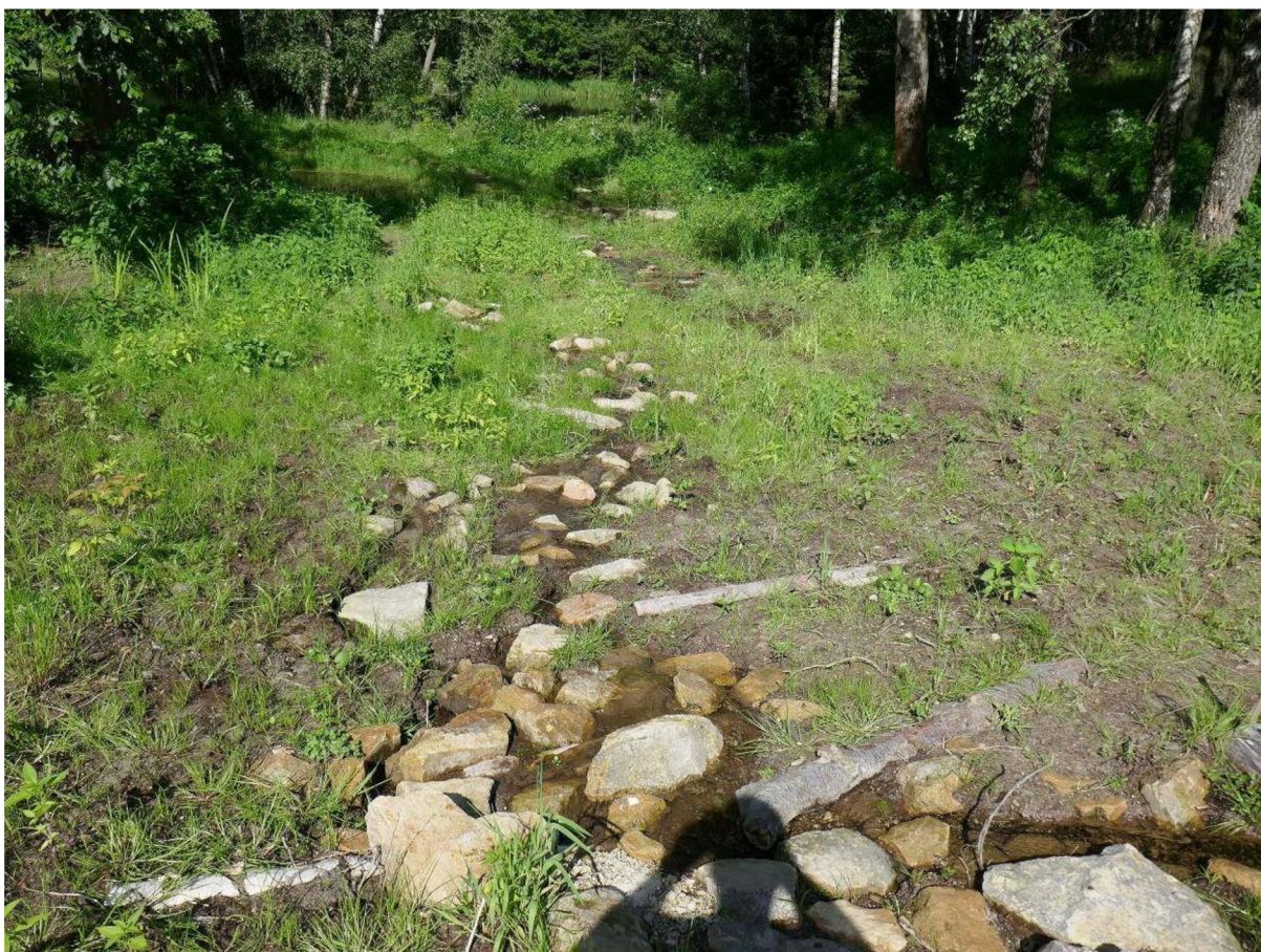
Obrázek 6: Revitalizovaný občasný vodní tok