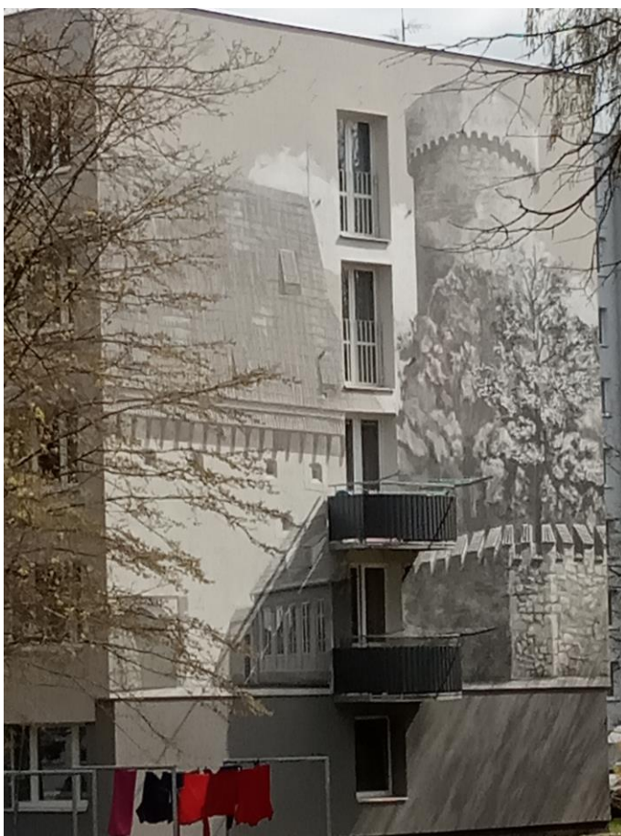
Obrázek 5: Malba na panelovém domě na Pražském sídlišti představující část táborského hradu Kotnov