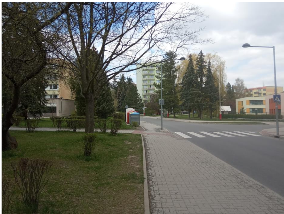
Obrázek 4: Současná podoba sídliště (zachycen je stejný úsek sídliště jako na fotografii Marie Šechtlové).