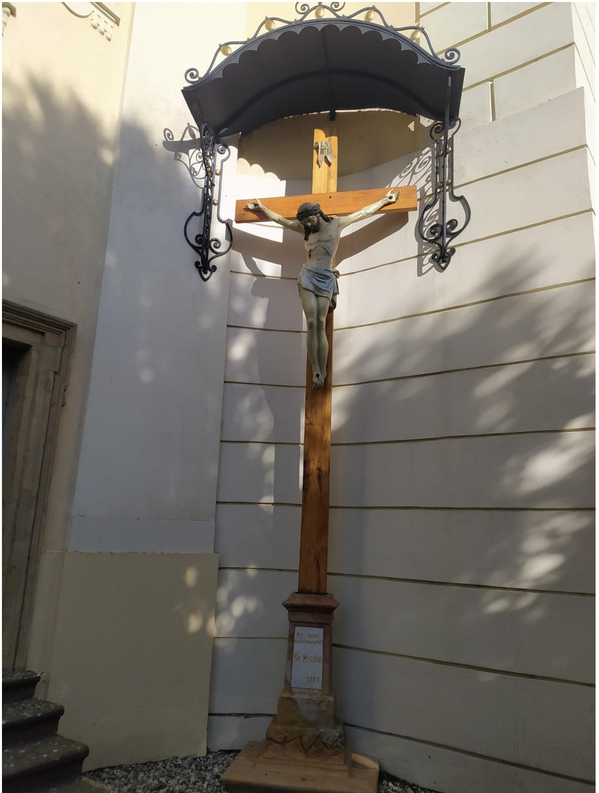
14. Kostel sv. Jakuba Většího v Kostelci na Hané, socha Ježíše Krista.