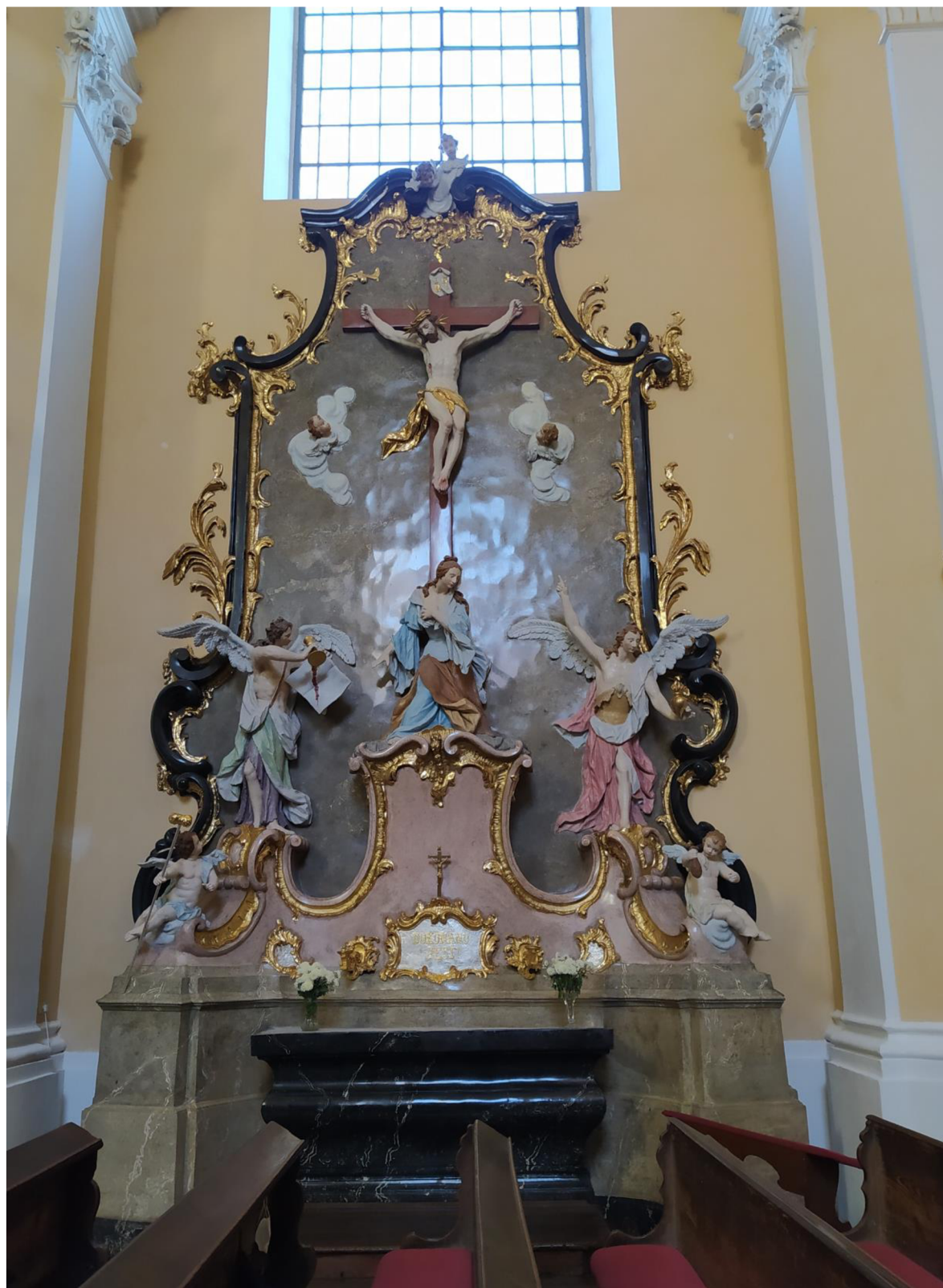
7. Kostel sv. Jakuba Většího v Kostelci na Hané, oltář Bolestné Panny Marie.