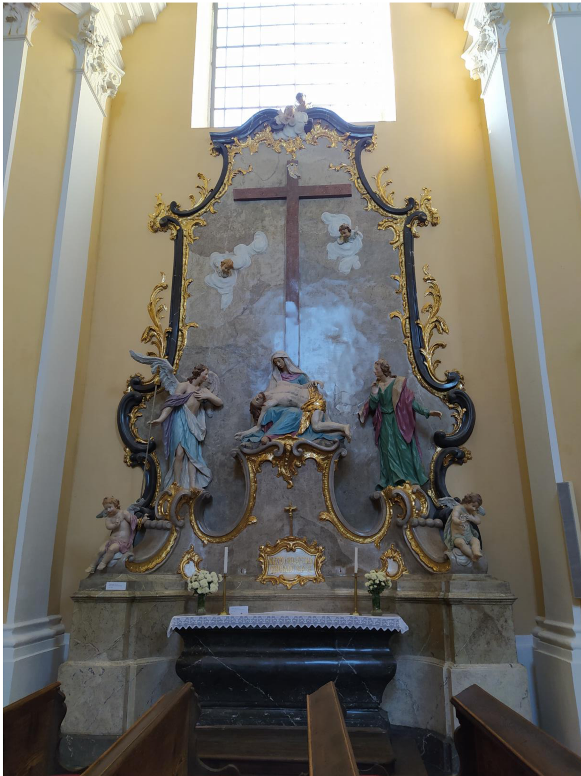
10. Kostel sv. Jakuba Většího v Kostelci na Hané, oltář sv. Kříže.