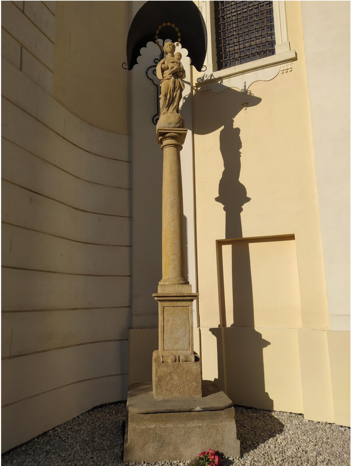
4. Kostel sv. Jakuba Většího v Kostelci na Hané, socha Panny Marie.