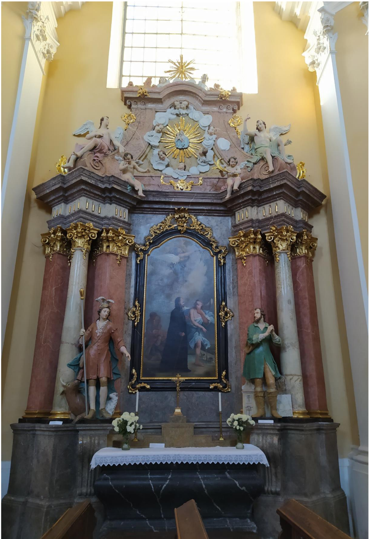
8. Kostel sv. Jakuba Většího v Kostelci na Hané, oltář sv. Jana Nepomuckého. Foto: Lenka Motalíková