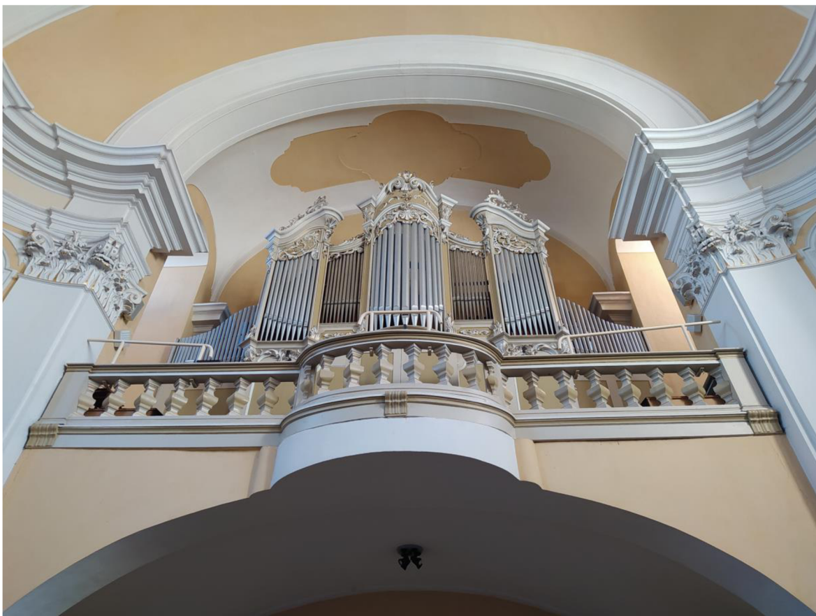
2. Kostel sv. Jakuba většího v Kostelci na Hané, pohled na kruchtu s varhanami.

V roce 1693 vytvořil v Olomouci pro kostel zvon Pavel Reimer. Na zvonu se nacházely reliéfy Madony s dítětem, sv. Jiřím a Jakubem Větším. 38 V kostele se nacházely celkem tři zvony, ale zůstal zde pouze jeden vytvořený v roce 1693. K němu přibyly další dva až po téměř 80 letech. Menší zvon byl zasvěcený sv. Cyrilovi a Metodějovi, větší pak Nejsvětějšímu srdci Ježíšovu a Neposkvrněnému srdci Panny Marie. Oba zvony posvětil biskup Josef Nuzík 27. 7. 2019. 39