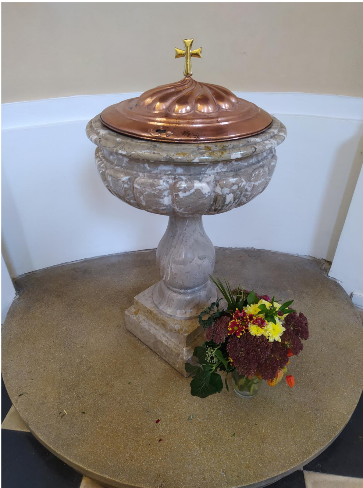
16. Kostel sv. Jakuba Většího v Kostelci na Hané, křtitelnice.