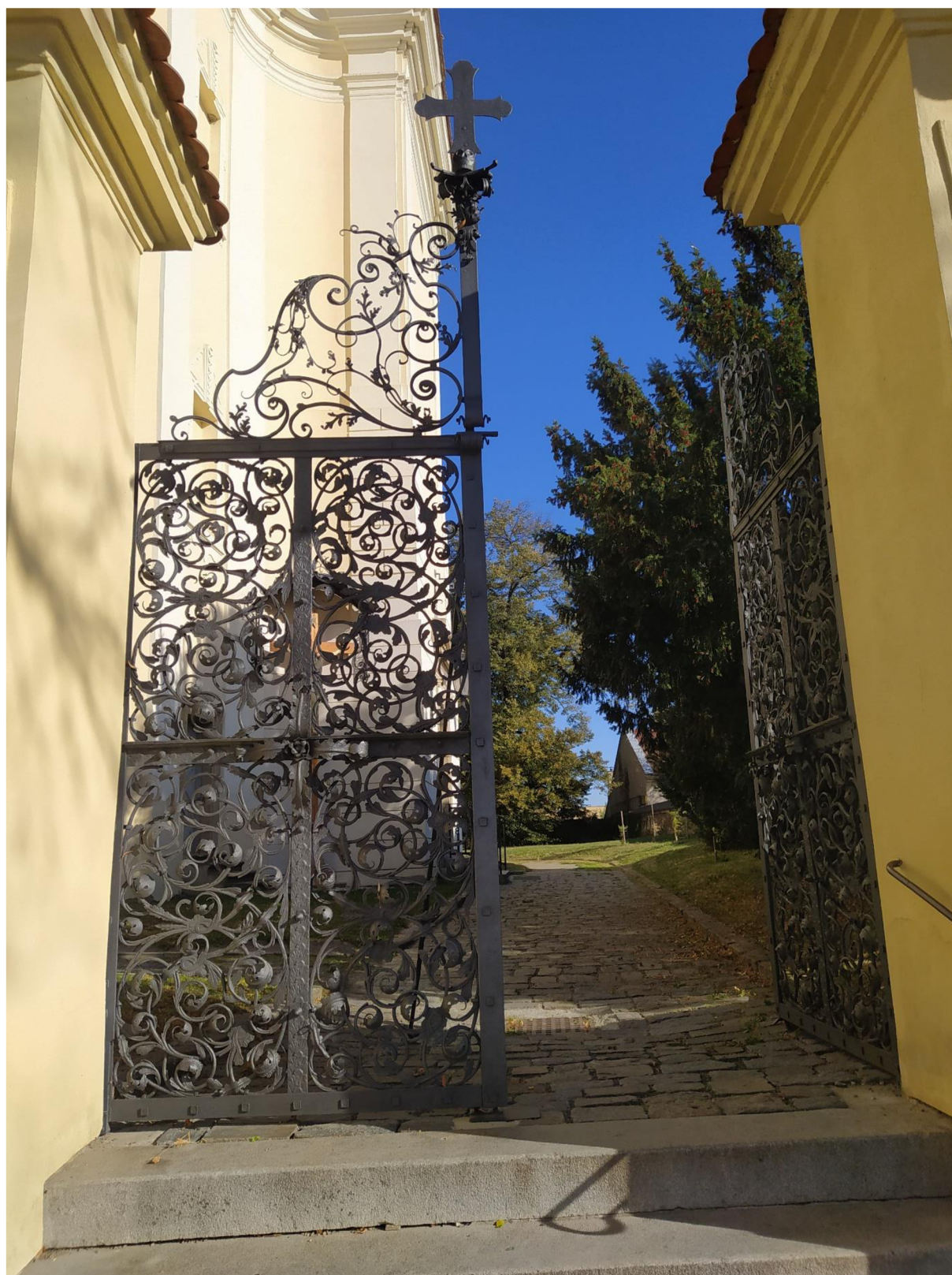
13. Kostel sv. Jakuba Většího v Kostelci na Hané, vstupní brána.