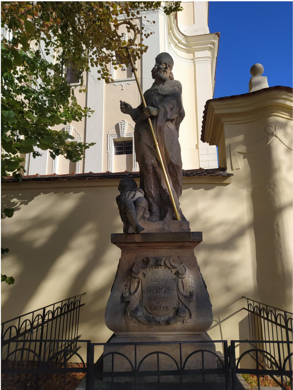
5. Kostel sv. Jakuba Většího v Kostelci na Hané, socha sv. Valentina.