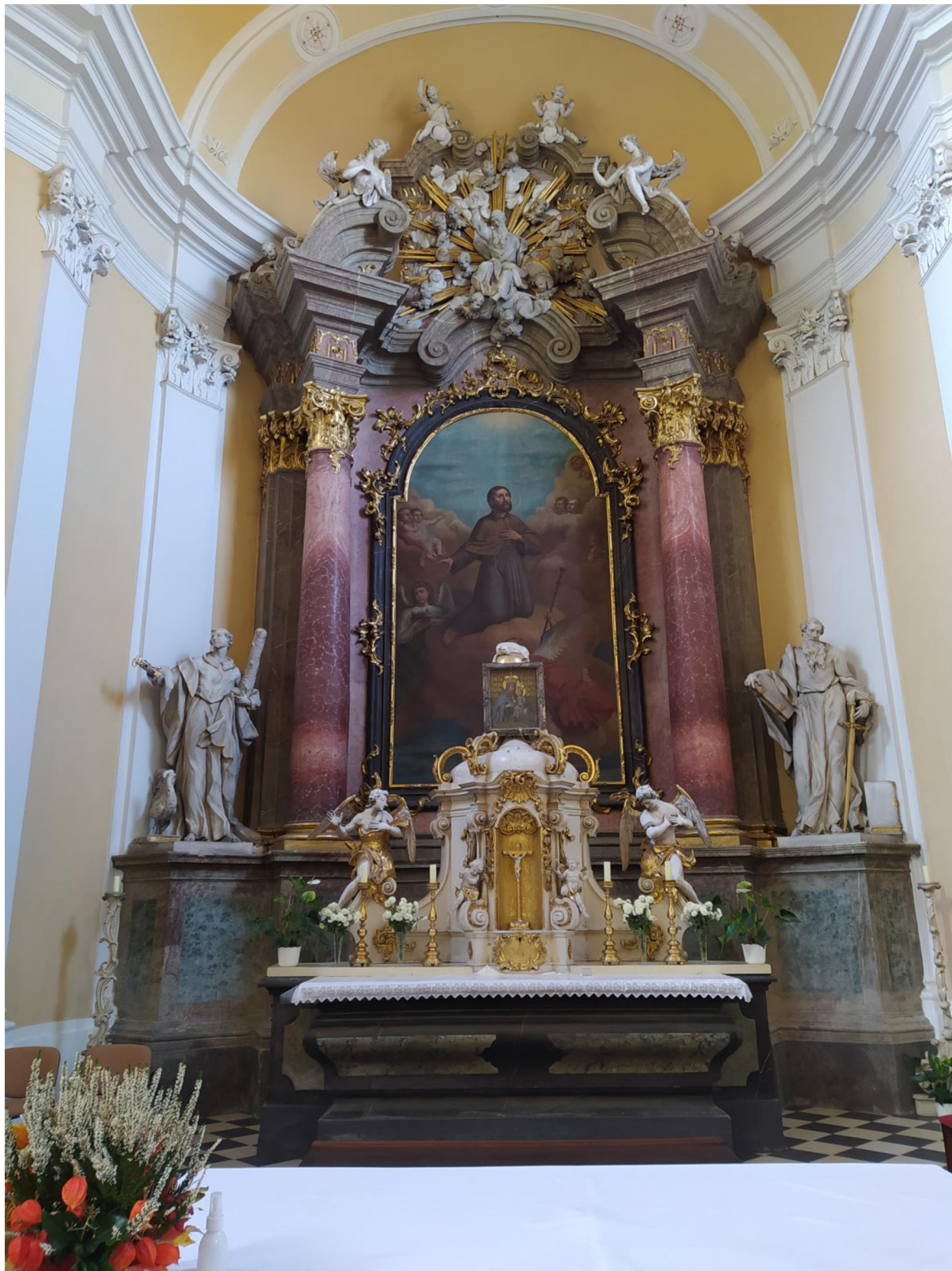
6. Kostel sv. Jakuba Většího v Kostelci na Hané, hlavní oltář sv. Jakuba Většího.