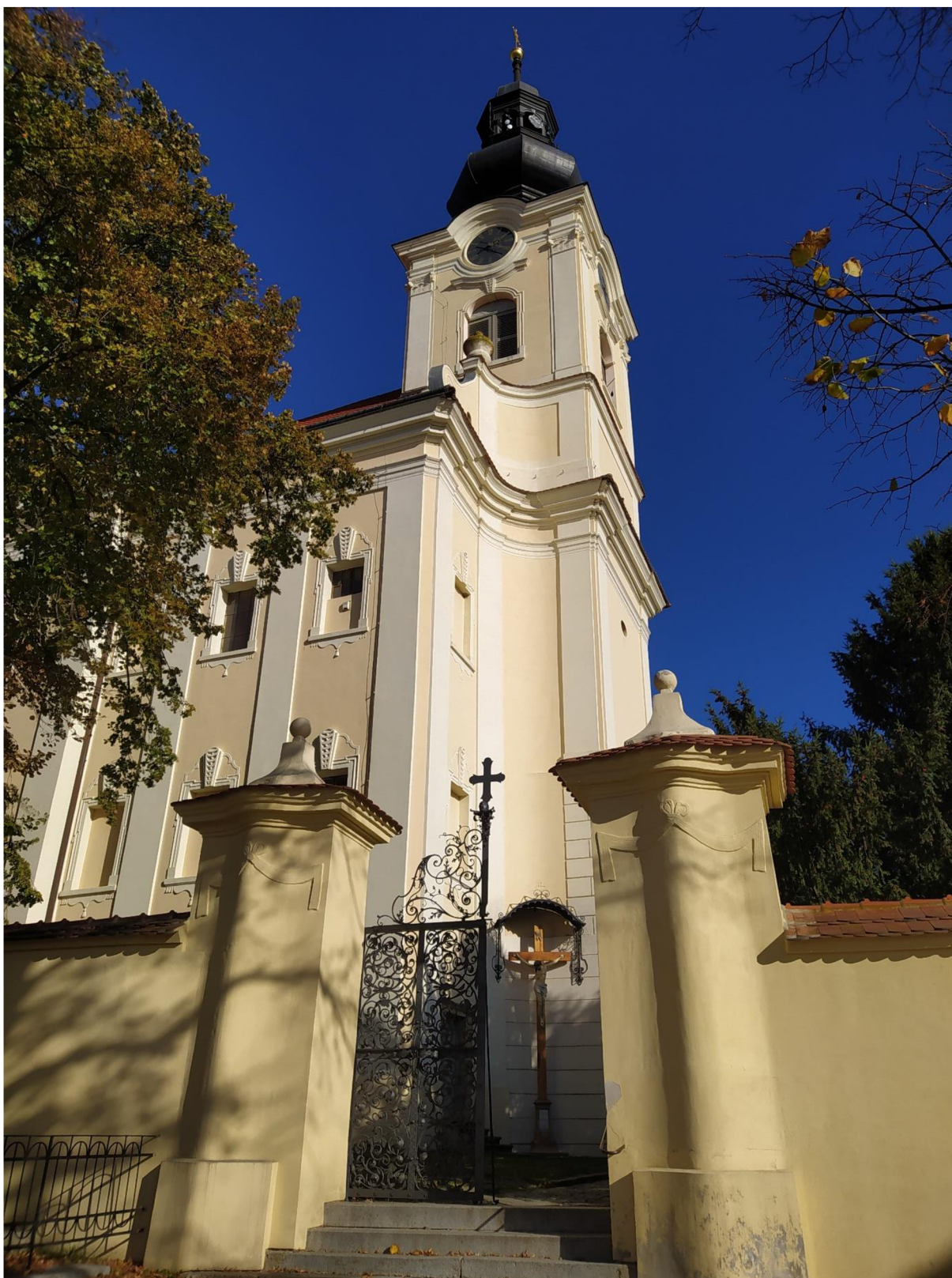
12. Kostel sv. Jakuba Většího v Kostelci na Hané se vstupní branou, pohled jihozápadní strany.