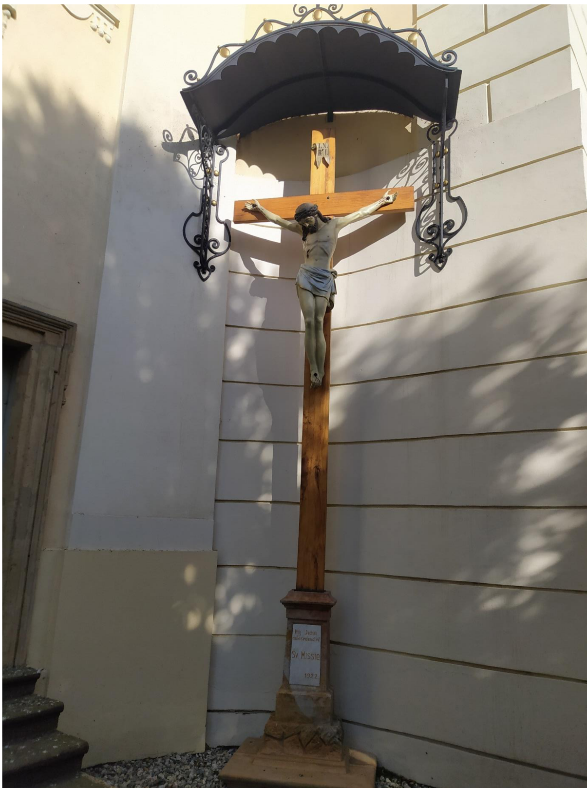
14. Kostel sv. Jakuba Většího v Kostelci na Hané, socha Ježíše Krista.