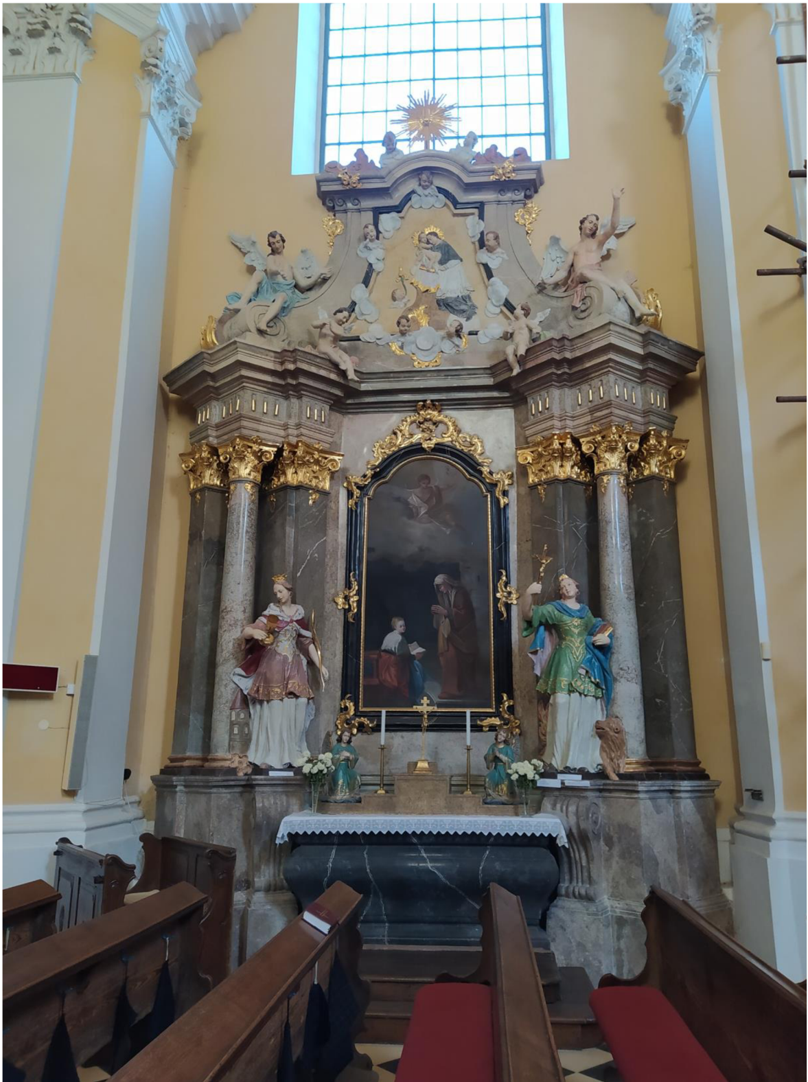
9. Kostel sv. Jakuba Většího v Kostelci na Hané, oltář sv. Anny.