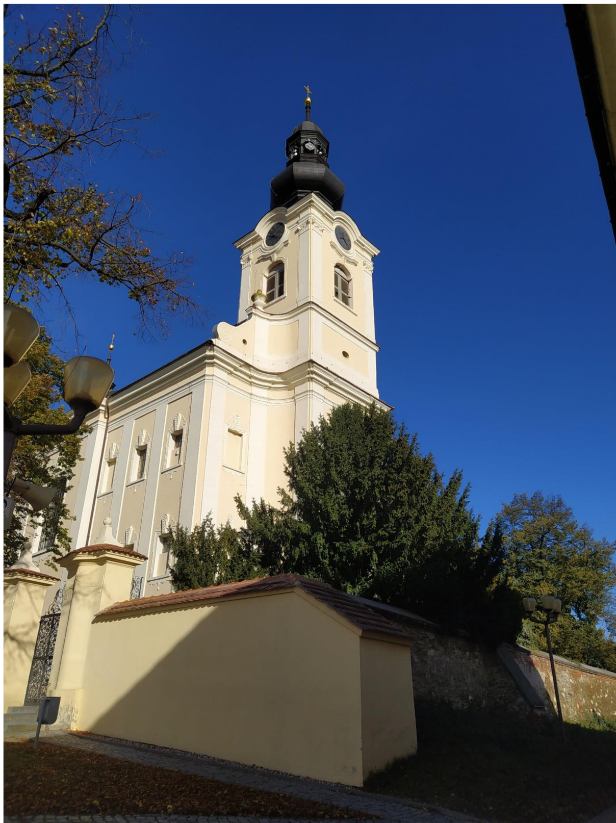
11. Kostel sv. Jakuba Většího v Kostelci na Hané, pohled z jiho- západní strany.