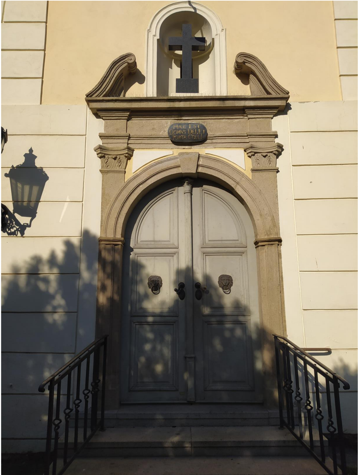
3. Kostel sv. Jakuba Většího v Kostelci na Hané, vstup do kostela.