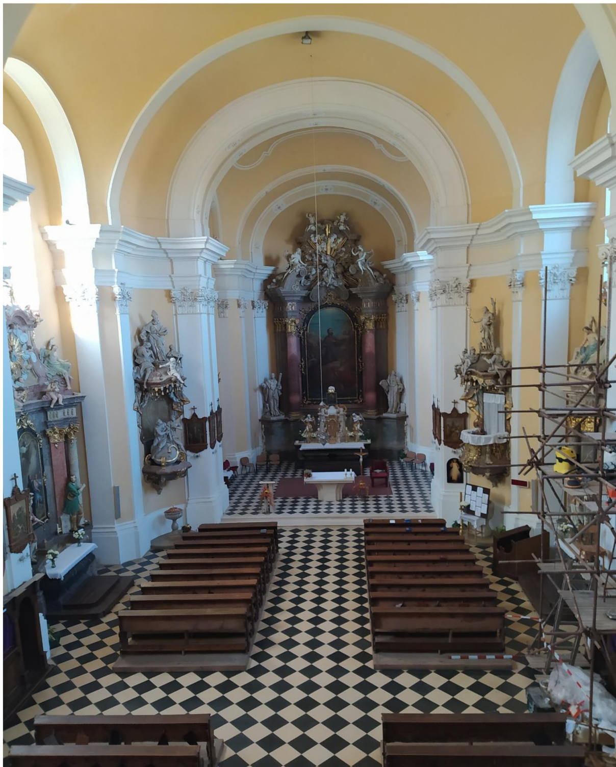
15. Kostel sv. Jakuba Většího v Kostelci na Hané, pohled z kruchty na interiér.