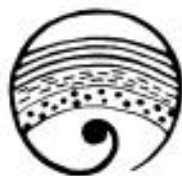
Obrázek č. 7 – Logo Předškolního oddělení

Předškolní oddělení má několik výchovně-vzdělávacích cílů, kterými jsou: pomáhat dětem se začlenit do kolektivu, a tak je připravit na školní docházku, učit děti samostatnosti a zároveň spolupráce a toleranci k vrstevníkům, rozvíjet jejich schopnosti a dovednosti, vést je k odpovědnosti a dodržování pravidel. O to vše se pokouší ve svých aktivitách uspět. 64