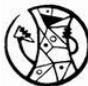
Obrázek č. 8 – Logo Přírodovědného oddělení