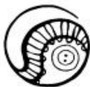
Obrázek č. 9 – Logo Jazykového oddělení