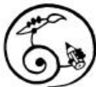
Obrázek č. 3 – Logo Tvořivého oddělení

Tvořivé oddělení nabízí zájemců kroužky rozdělené podle věkových kategorií i podle zaměření.