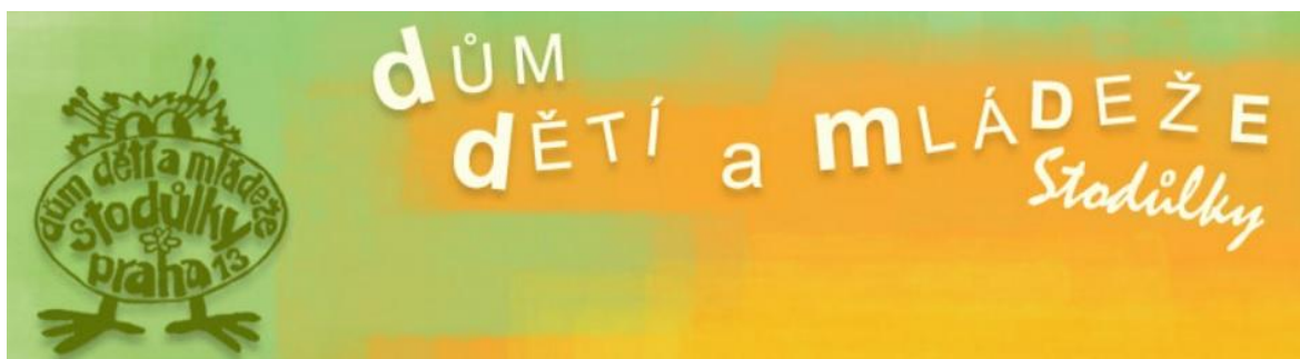
Obrázek č. 2 – Logo DDM Stodůlky

Dům dětí a mládeže Stodůlky je příspěvková organizace pořádající širokou škálu volnočasových aktivit – zájmového vzdělání pro děti, mládež, rodiny s dětmi a další zájemce v souladu s vyhláškou č. 74/2015 o zájmovém vzdělávání. Poslední platné rozhodnutí o zařazení do školského rejstříku č. 590985/2008 je ze dne 20. 4. 2009.